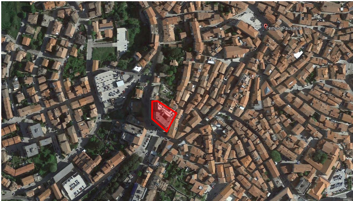
Figura 2 – Ubicazione – l’unità immobiliare oggetto di procedura esecutiva è evidenziata da un perimetro rosso