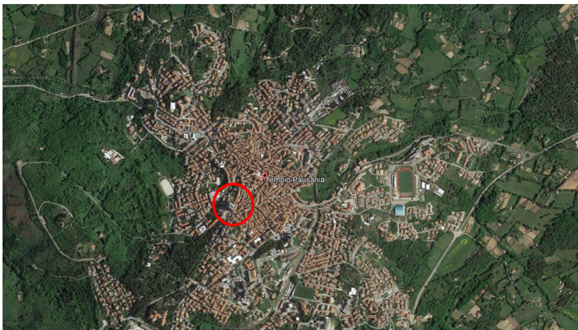
Figura 1 –Ubicazione – Tempio Pausania - il perimetro rosso segnala l'area su cui insiste il fabbricato nel quale è allocata l'unità immobiliare oggetto di procedura esecutiva

La sua posizione centrale permette inoltre di raggiungere agevolmente e facilmente anche a piedi tutti i servizi che ci si può aspettare di trovare in un comune di circa 13.000 abitanti, quale quello per l'appunto di Tempio Pausania.