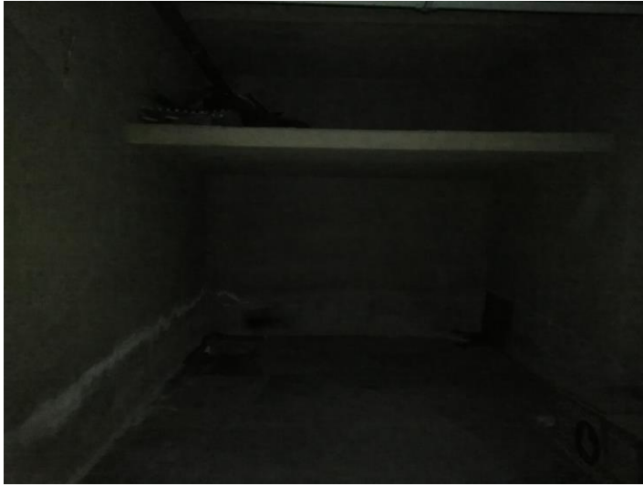
Foto 2 Vista interna