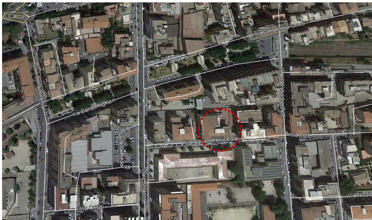
Figura 1. Foto aerea localizzazione dell'immobile in oggetto

Il cespite oggetto di stima, fa parte di un condominio denominato "condominio quadrifoglio", oggetto della presente riguarda, il garage ubicato al primo piano sotto strada.