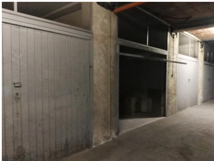
Foto 1 Ingresso