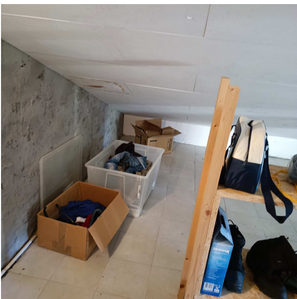
Sottotetto, vano con presenza di pannelli termoisolanti