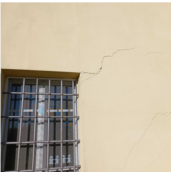
Crepe sul perimetro della finestra