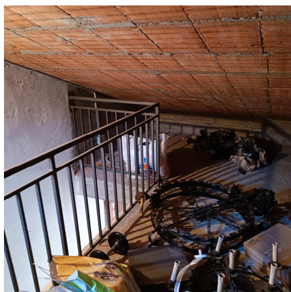
Scala accesso al sottotetto e protezione scala sul sottotetto