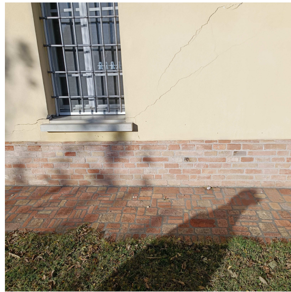
Crepe parete est - esterno