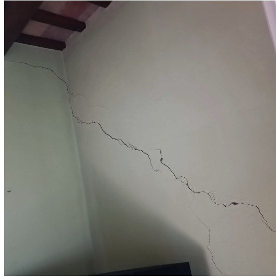
Crepe all'interno dell'abitazione