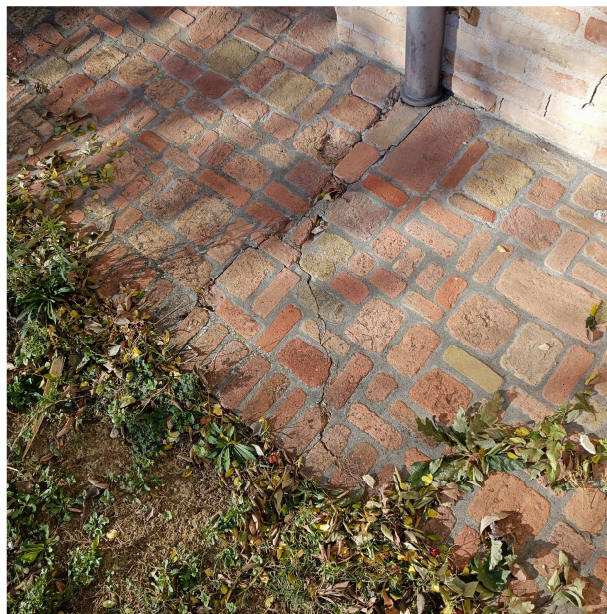
Particolare fessura su finestra est e sul marciapiede