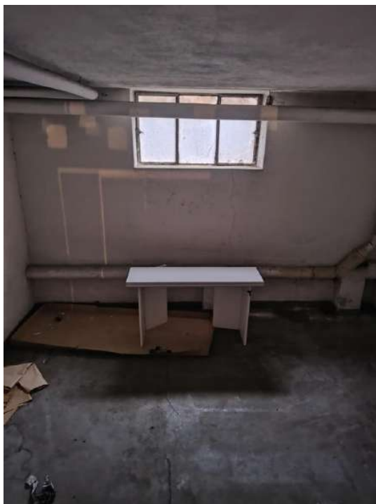
Foto 19 - Cantina