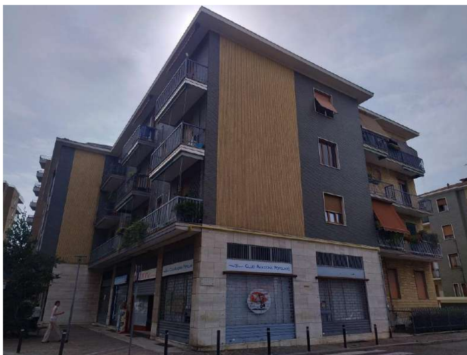
Foto 2 – Vista del complesso immobiliare da via Piave angolo via Don L. Sturzo