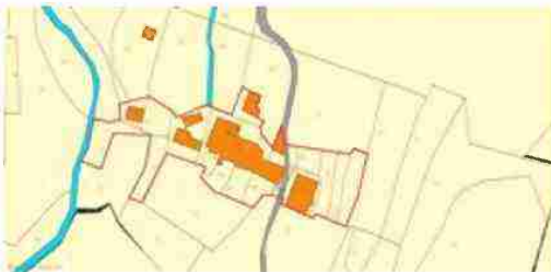
LOCALIZZAZIONE COMPLESSO SU BASE CATASTALE