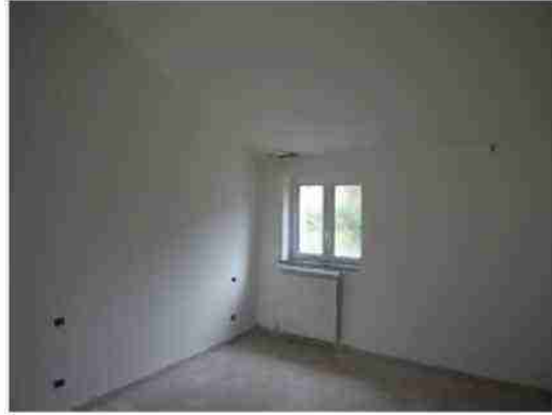
APPARTAMENTO CIV. 6 VISTE INTERNE LOCALI