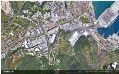
LOCALIZZAZIONE AREA A SCALA TERRITORIALE

I beni sono ubicati in zona rurale in un'area agricola, le zone limitrofe si trovano in un'area agricola (i più importanti centri limitrofi sono SAVONA (5 KM) GENOVA (50 KM)). Il traffico nella zona è locale, i parcheggi sono inesistenti. Sono inoltre presenti i servizi di urbanizzazione primaria.