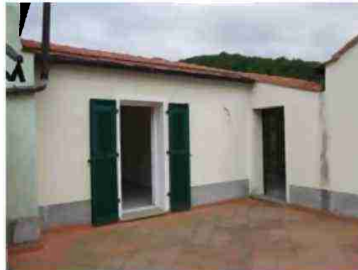
FRONTI PRINCIPALI E TERRAZZA PERTINENZIALE