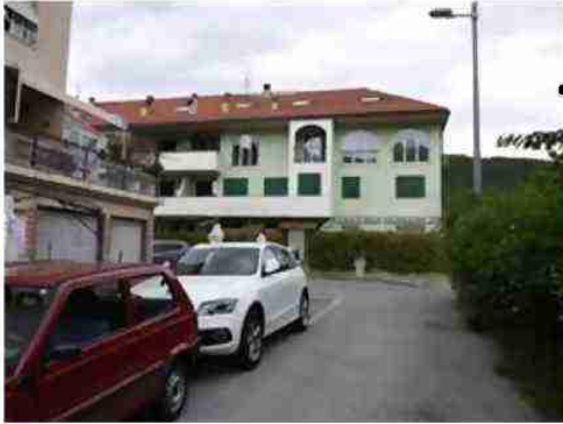
area di accesso al complesso via Piave civ. 224 C/D/E - mappale 673