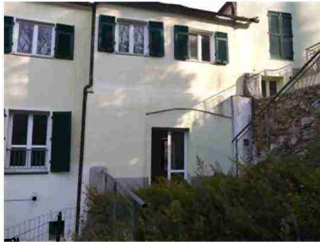
PORZIONE DI FABBRICATO CIV. 14 VISTE ESTERNE LATO MONTE - CORTE GIARDINO