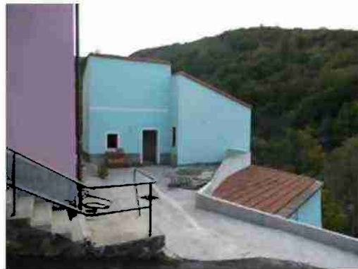
FABBRICATO INDIPENDENTE CIV. 22 VISTE ESTERNE