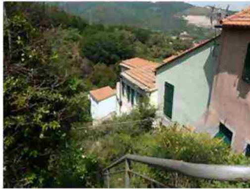
PORZIONE DI FABBRICATO CIV. 8 VISTE ESTERNE DA MONTE