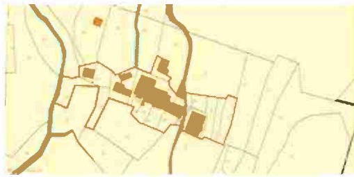
LOCALIZZAZIONE COMPLESSO SU BASE CATASTALE