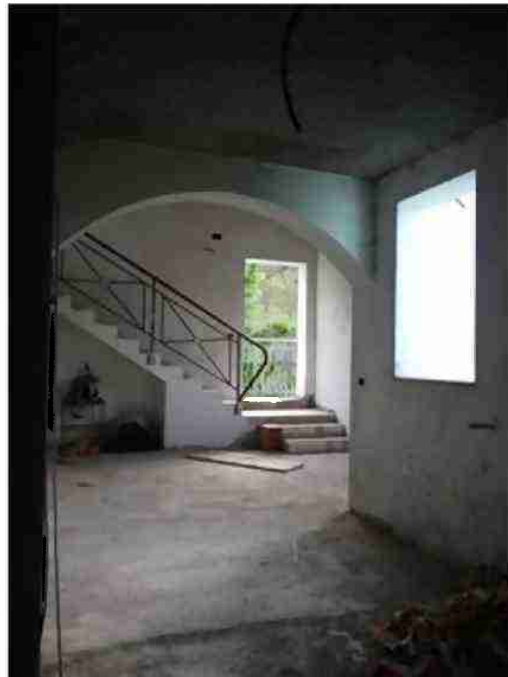
APPARTAMENTO CIV. 22 VISTE INTERNE