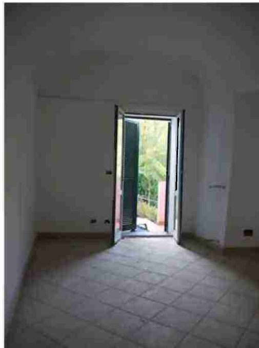
APPARTAMENTO CIV. 20 VISTE INTERNE