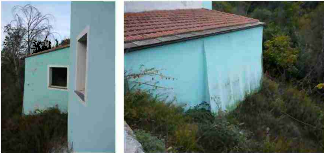
FABBRICATO INDIPENDENTE CIV. 22 VISTE ESTERNE