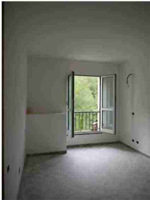
APPARTAMENTO CIV. 14 VISTE INTERNE