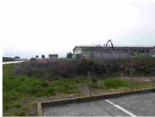
TIPOLOGIA INSEDIAMENTO PRODUTTIVO ADIACENTE AL LOTTO (LATO OVEST)