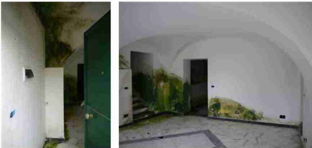
APPARTAMENTO CIV. 14 VISTE INTERNE

Costituiscono inoltre accessori comuni a tutte le unità costituenti il complesso descritte ai lotti da 1 a 9 le aree pedonali esterne individuate con i mappali 706, 707, 709 e 710 sub. 12, poste sul lato nord dello stesso; l'area ove sono collocati i contatori ENEL individuata con i mappali 1140 e 1141, posta immediatamente a monte della strada pubblica; l'area individuata con il mappale 1149 in parte adibita a scala di accesso ai terreni sottostanti via Mulini sul lato sud del complesso, ove sono collocati i contatori del GAS.