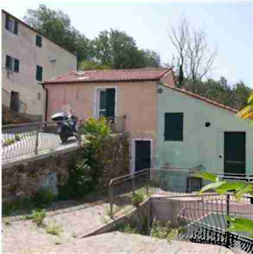
CIV. 6 VISTA DA VALLE