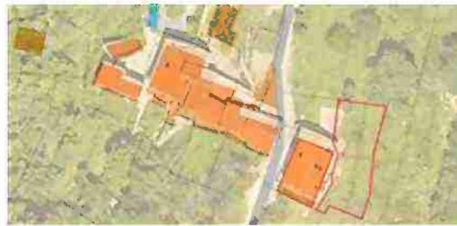
INDIVIDUAZIONE IMMOBILI LOTTO 1