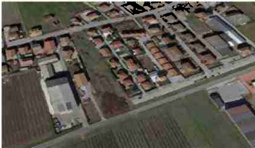
LOTTO EDIFICABILE VISTA DA SUD OVEST (STRADA PROVINCIALE)

Il terreno presenta una forma rettangolare allungata, un'orografia pianeggiante, il terreno è lasciato a gerbido.