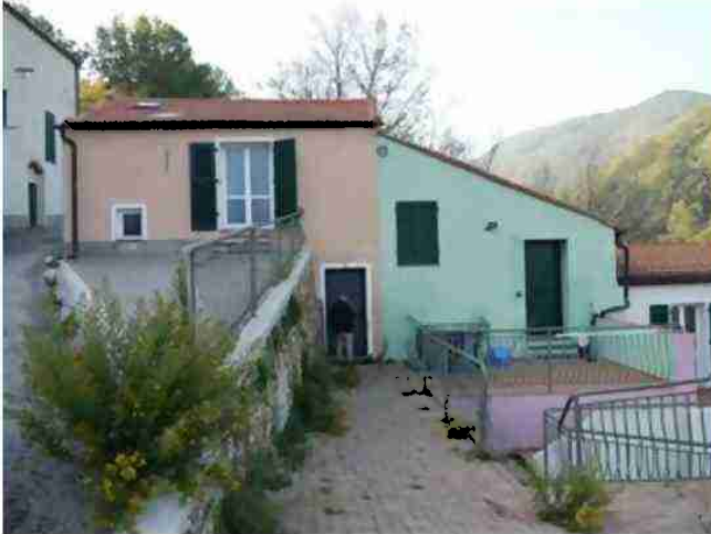
PORZIONE DI FABBRICATO CIV. 8 VISTE ESTERNE DA VALLE

Coerenze: al piano secondo sottostrada: mappale 709, terrapieno a due lati, appartamento mappale 710 sub. 4; al piano primo sottostrada: mappale 711 dal quale si accede, mappale 709, appartamento mappale 710 sub. 1, mappali 1148 e 1147, appartamento mappale 710 sub. 3