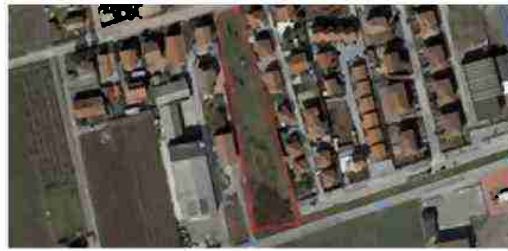
INDIVIDUAZIONE AREA SU BASE SATELLITARE