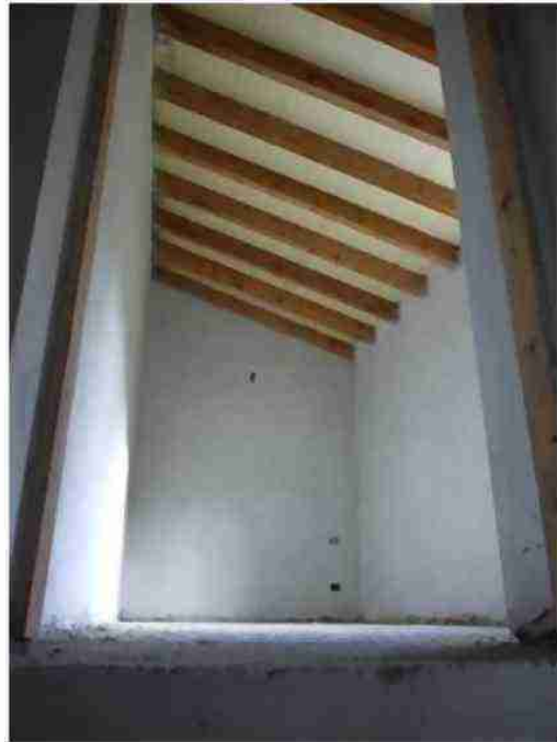
APPARTAMENTO CIV. 22 VISTE INTERNE