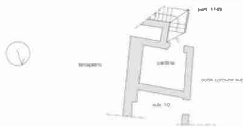
CANTINA PIANO S4

APPARTAMENTO CIV. 20 - RILIEVO DI MASSIMA