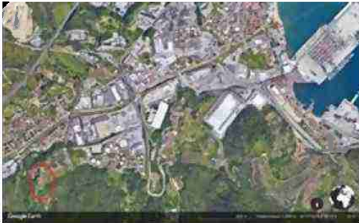
LOCALIZZAZIONE AREA A SCALA TERRITORIALE

I beni sono ubicati in zona rurale in un'area agricola, le zone limitrofe si trovano in un'area agricola (i più importanti centri limitrofi sono SAVONA (5 KM) GENOVA (50KM)). Il traffico nella zona è locale, i parcheggi sono inesistenti. Sono inoltre presenti i servizi di urbanizzazione primaria.