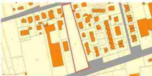
INDIVIDUAZIONE AREA SU BASE CATASTALE