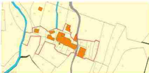
LOCALIZZAZIONE COMPLESSO SU BASE CATASTALE