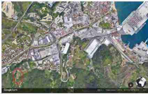
LOCALIZZAZIONE AREA A SCALA TERRITORIALE