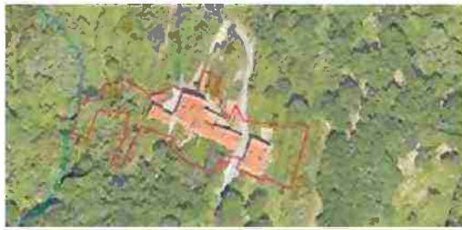
LOCALIZZAZIONE COMPLESSO SU BASE SATELLITARE