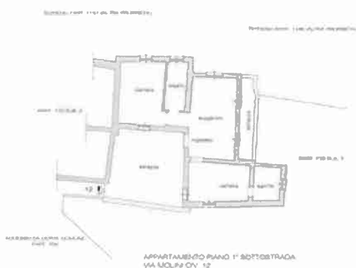
APPARTAMENTO CIVICO 12 - RILIEVO DI MASSIMA