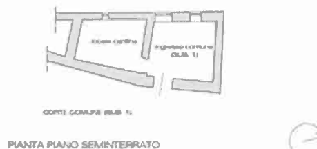
CANTINA RILIEVO DI MASSIMA