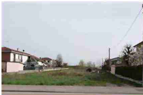
VISTE LOTTO DA NORD

La superficie catastale complessiva del lotto è di 5.490 mq.; la superficie complessiva dell'area effettivamente edificabile è pari a 2.456 mq.