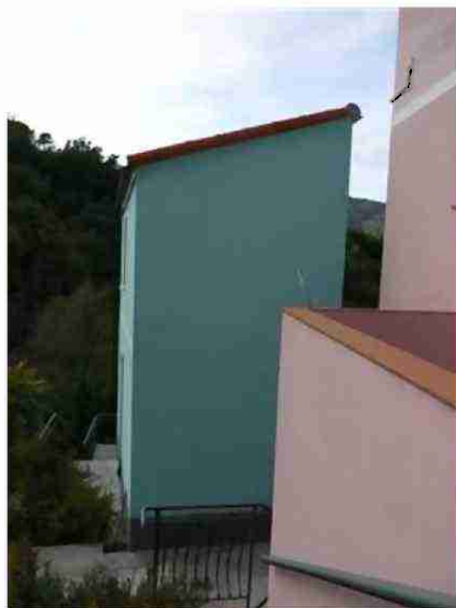
FABBRICATO INDIPENDENTE CIV. 22 VISTE ESTERNE