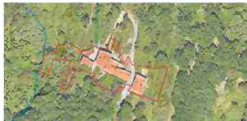
LOCALIZZAZIONE COMPLESSO SU BASE SATELLITARE