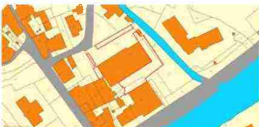
LOCALIZZAZIONE COMPLESSO SU BASE CATASTALE