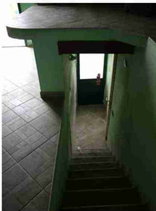
APPARTAMENTO CIV. 8 VISTE INTERNE