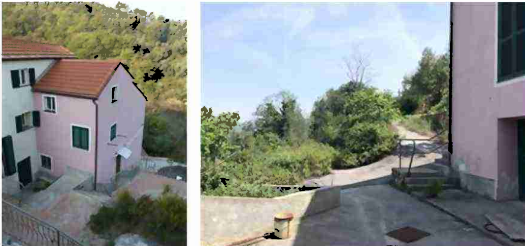
AREE DI PERTINENZA COMUNI A TUTTO IL COMPLESSO