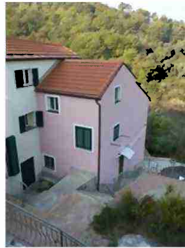
AREE DI PERTINENZA COMUNI A TUTTO IL COMPLESSO