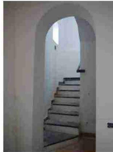
APPARTAMENTO CIV. 6 VISTE INTERNE LOCALI