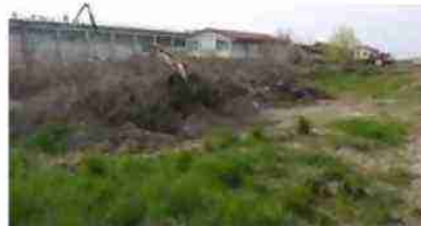
LOTTO EDIFICABILE VISTA DA SUD OVEST (STRADA PROVINCIALE)