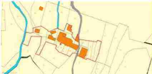
LOCALIZZAZIONE COMPLESSO SU BASE CATASTALE