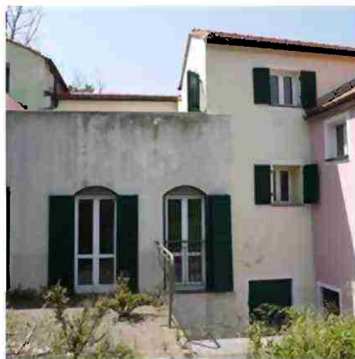
PORZIONE DI FABBRICATO CIV. 14 VISTE ESTERNE