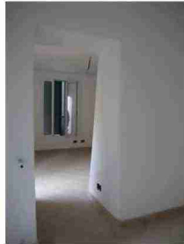
APPARTAMENTO CIV. 20 VISTE INTERNE