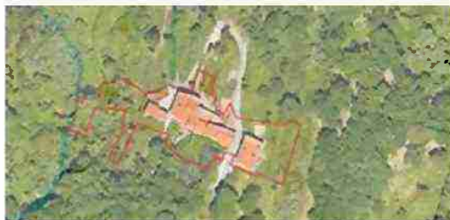
LOCALIZZAZIONE COMPLESSO SU BASE SATELLITARE