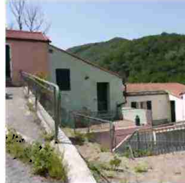
PORZIONE DI FABBRICATO CIV. 8 VISTE ESTERNE