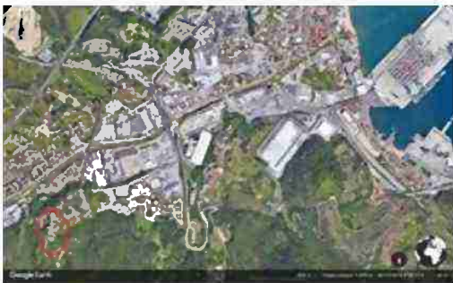
LOCALIZZAZIONE AREA A SCALA TERRITORIALE

I beni sono ubicati in zona rurale in un'area agricola, le zone limitrofe si trovano in un'area agricola (i più importanti centri limitrofi sono SAVONA (5 KM) GENOVA (50KM)). Il traffico nella zona è locale, i parcheggi sono inesistenti. Sono inoltre presenti i servizi di urbanizzazione primaria.