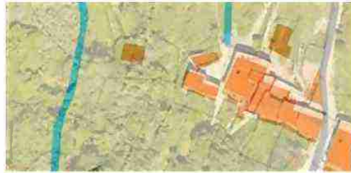
INDIVIDUAZIONE IMMOBILI LOTTO 8