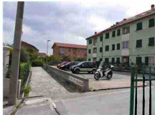
camminamento pedonale lato nord ovest mappale 671