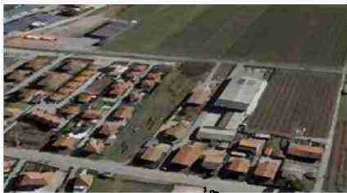
LOTTO EDIFICABILE VISTA DA NORD EST (VIA SALUZZO)