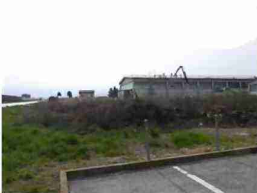
VISTE LOTTO DA SUD