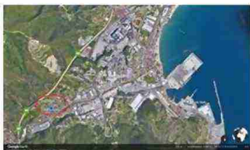
LOCALIZZAZIONE COMPLESSO A SCALA TERRITORIALE