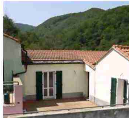
VISTE TERRAZZA PERTINENZIALE