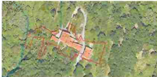
LOCALIZZAZIONE COMPLESSO SU BASE SATELLITARE