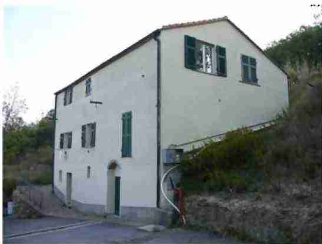
FABBRICATO VIA MOLINI CIV, 1/3/5