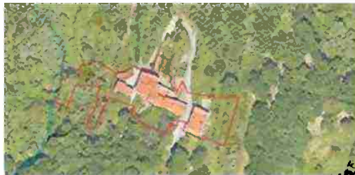
LOCALIZZAZIONE COMPLESSO SU BASE SATELLITARE