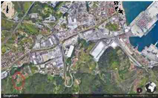
LOCALIZZAZIONE AREA A SCALA TERRITORIALE

I beni sono ubicati in zona rurale in un'area agricola, le zone limitrofe si trovano in un'area agricola (i più importanti centri limitrofi sono SAVONA (5 KM) GENOVA (50 KM)). Il traffico nella zona è locale, i parcheggi sono inesistenti. Sono inoltre presenti i servizi di urbanizzazione primaria.