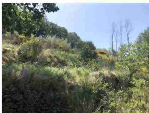
PORZIONE DI TERRENO AD USO COLTIVO