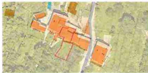
INDIVIDUAZIONE IMMOBILI LOTTO 5