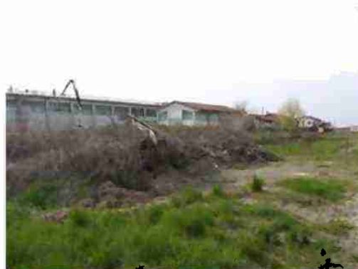
VISTE LOTTO DA SUD