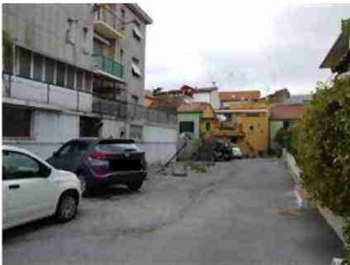
corte di accesso al fabbricato e posti auto a raso mappali 673 e 675