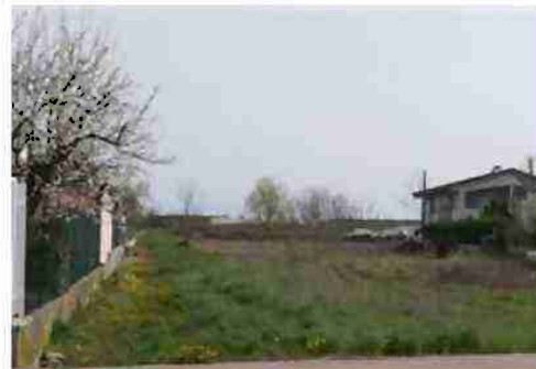
VISTE LOTTO DA NORD