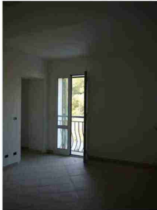
APPARTAMENTO CIV. 20 VISTE INTERNE