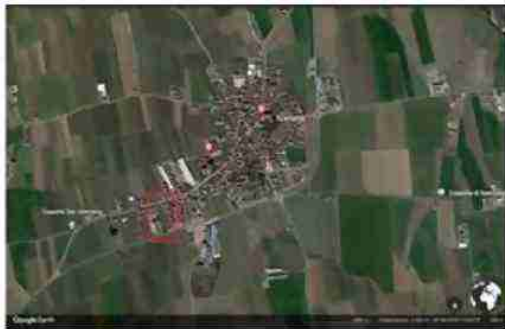
LOCALIZZAZIONE AREA A LIVELLO TERRITORIALE

I beni sono ubicati in zona periferica in un'area residenziale, le zone limitrofe si trovano in un'area agricola (i più importanti centri limitrofi sono SALUZZO (7 KM) SAVIGLIANO (8 KM) CUNEO (31 KM) ASTI (56 KM) ALESSANDRIA (87 KM)). Il traffico nella zona è locale, i parcheggi sono inesistenti. Sono inoltre presenti i servizi di urbanizzazione primaria.