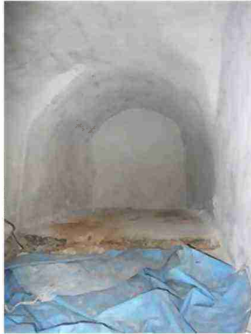
LOCALE DEPOSITO/CANTINA VISTE INTERNE