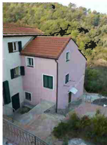
AREE DI PERTINENZA COMUNI A TUTTO IL COMPLESSO