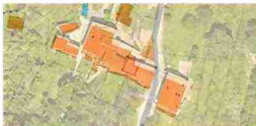
INDIVIDUAZIONE IMMOBILI LOTTO 3