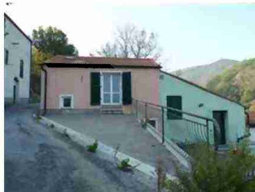
CIV. 6 ED AREA PERTINENZIALE ESTERNA VISTA DA VALLE