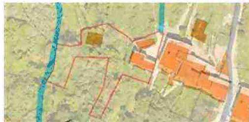
INDIVIDUAZIONE IMMOBILI LOTTO 7