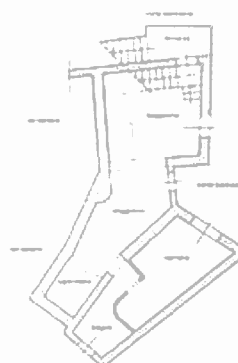
APPARTAMENTO VIA MOLINI CIV. 22 PIANO SEMINTERRATO

APPARTAMENTO CIV. 22 - PIANO S1 - RILIEVO DI MASSIMA