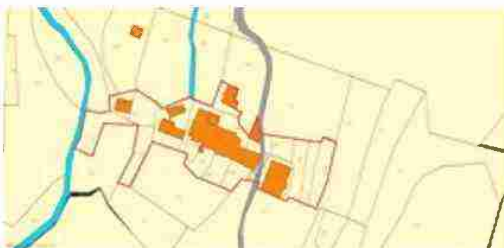
LOCALIZZAZIONE COMPLESSO SU BASE CATASTALE