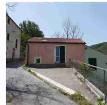
CIV. 6 ED AREA PERTINENZIALE ESTERNA