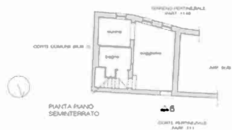
APPARTAMENTO CIV. 6 PIANO SEMINTERRATO - RILIEVO DI MASSIMA

APPARTAMENTO CIV. 6 PIANO TERRA - RILIEVO DI