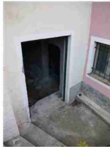
PORTA DI ACCESSO