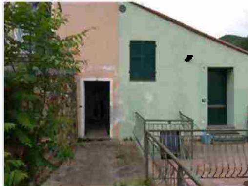
CIV. 6 ACCESSO AL PIANO S1