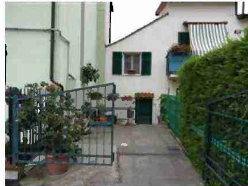
area accesso alle proprietà confinanti ed ai contatori mappale 658