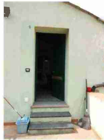
INGRESSO AL CIV. 8