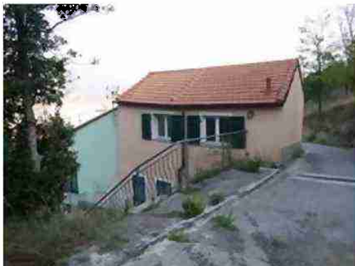
PORZIONE DI FABBRICATO CIV. 6 VISTA LATO MONTE

Coerenze: al piano primo sottostrada: mappale 711 dal quale ha accesso, appartamento mappale 710 sub. 2, mappale 1148 e terrapieno; al piano terreno: distacco su mappale 711, corte comune mappale 710 sub. 11, mappale 1148 ed appartamento mappale 710 sub. 2