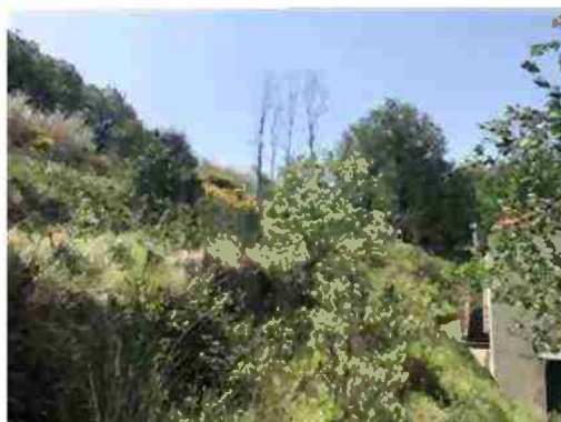
PORZIONE DI TERRENO PERTINENZIALE AL LOTTO