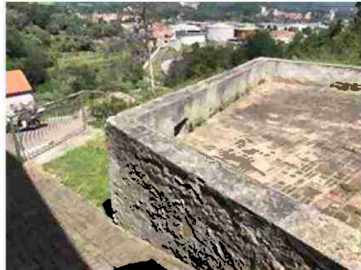
PORZIONE DI TERRENO AD USO CORTE GIARDINO