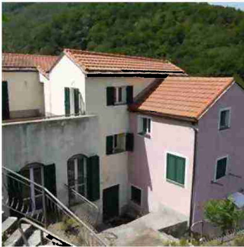
PORZIONE DI FABBRICATO DI CUI FA PARTE LA CANTINA