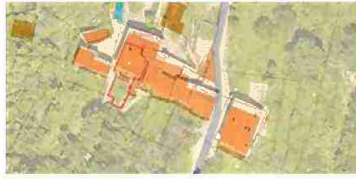
INDIVIDUAZIONE IMMOBILI LOTTO 6