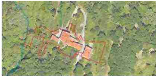
LOCALIZZAZIONE COMPLESSO SU BASE SATELLITARE