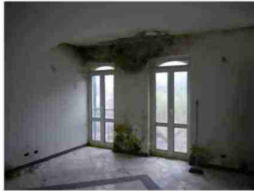
APPARTAMENTO CIV. 14 VISTE INTERNE