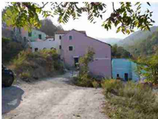
VISTA GENERALE DEL COMPLESSO