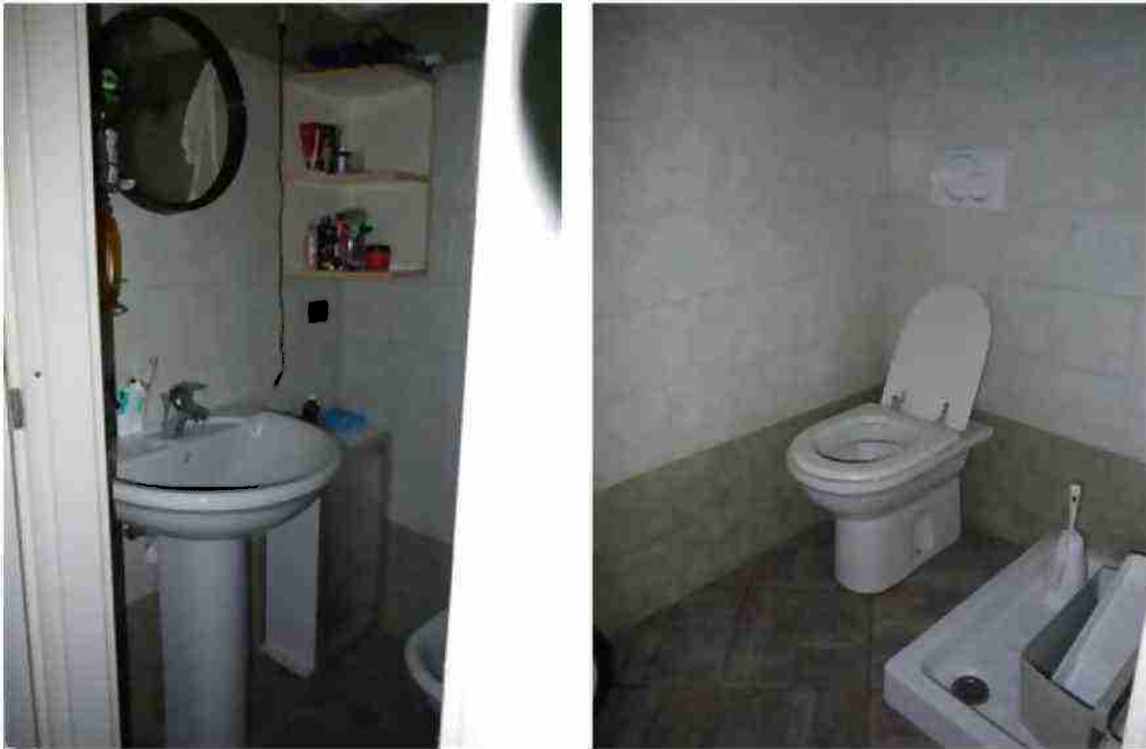
APPARTAMENTO CIV. 8 VISTE INTERNE