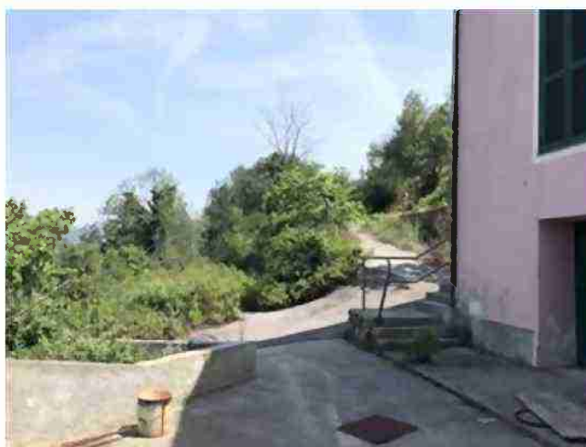
AREE DI PERTINENZA COMUNI A TUTTO IL COMPLESSO COMPLESSO