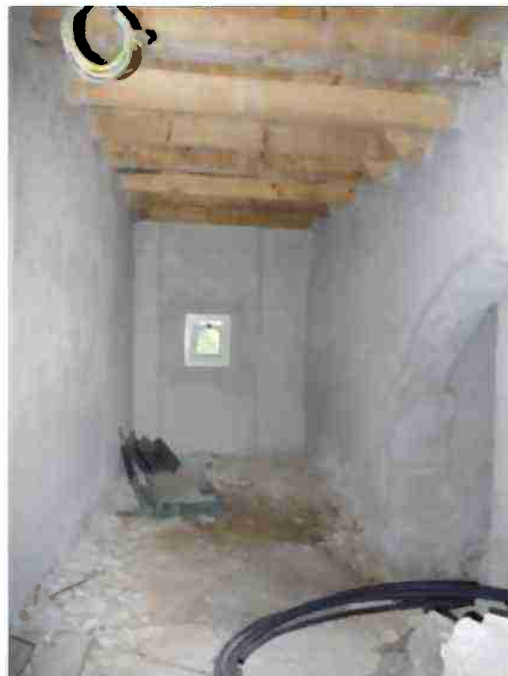
LOCALE DEPOSITO/CANTINA VISTE INTERNE