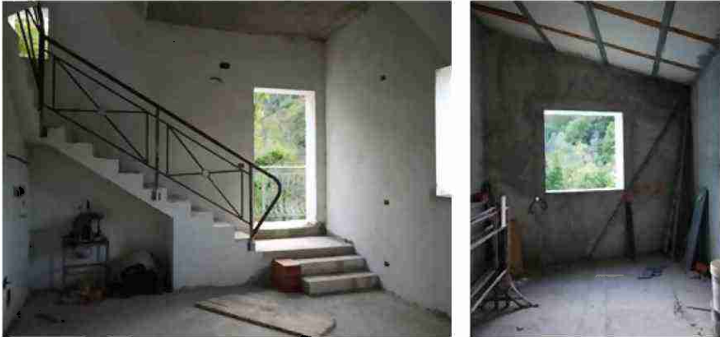
APPARTAMENTO CIV. 22 VISTE INTERNE