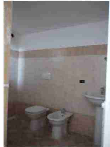
APPARTAMENTO CIV. 6 VISTE INTERNE LOCALI