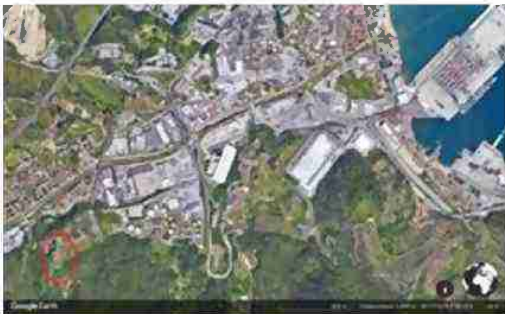
LOCALIZZAZIONE AREA A SCALA TERRITORIALE

I beni sono ubicati in zona rurale in un'area agricola, le zone limitrofe si trovano in un'area agricola (i più importanti centri limitrofi sono SAVONA (5 KM) GENOVA (50KM)). Il traffico nella zona è locale, i parcheggi sono inesistenti. Sono inoltre presenti i servizi di urbanizzazione primaria.