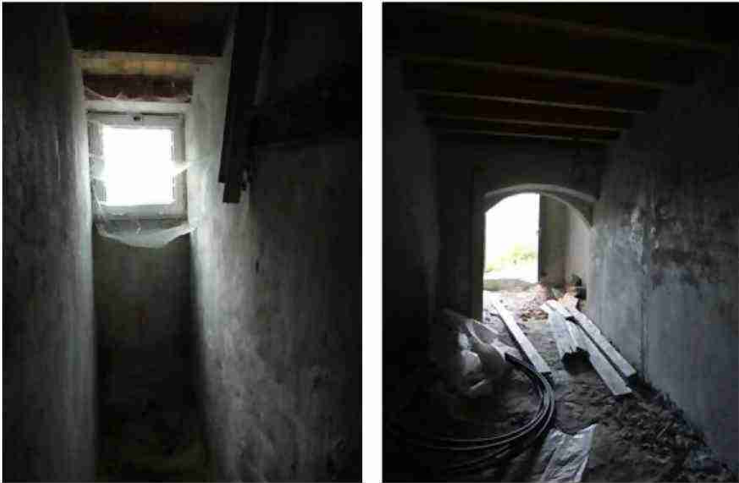
LOCALE DEPOSITO/CANTINA VISTE INTERNE