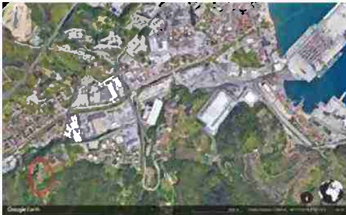
LOCALIZZAZIONE AREA A SCALA TERRITORIALE

I beni sono ubicati in zona rurale in un'area agricola, le zone limitrofe si trovano in un'area agricola (i più importanti centri limitrofi sono SAVONA (5 KM) GENOVA (50 KM)). Il traffico nella zona è locale, i parcheggi sono inesistenti. Sono inoltre presenti i servizi di urbanizzazione primaria.