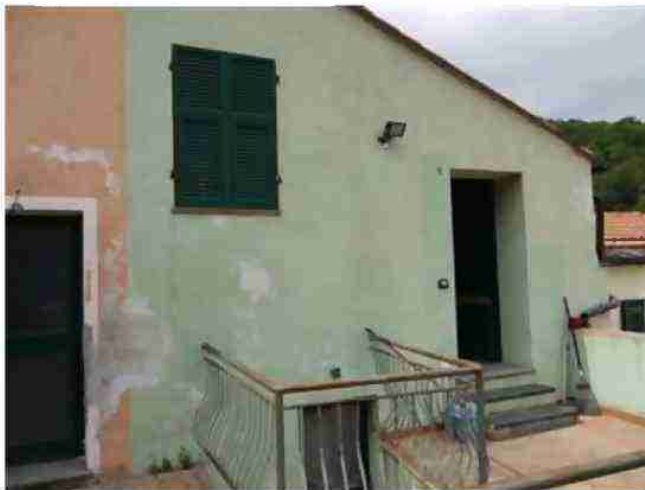
PORZIONE DI FABBRICATO CIV. 8 VISTE ESTERNE