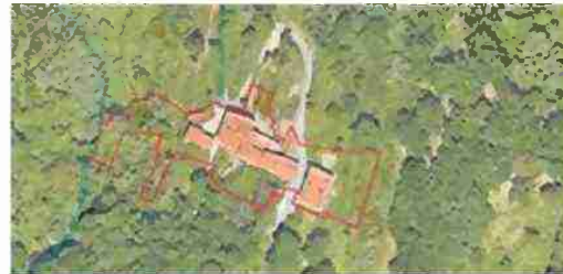
LOCALIZZAZIONE COMPLESSO SU BASE SATELLITARE