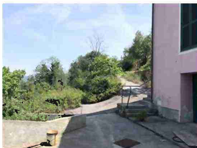
AREE DI PERTINENZA COMUNI A TUTTO IL COMPLESSO