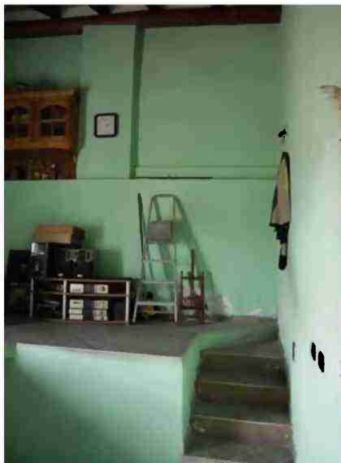
APPARTAMENTO CIV. 8 VISTE INTERNE