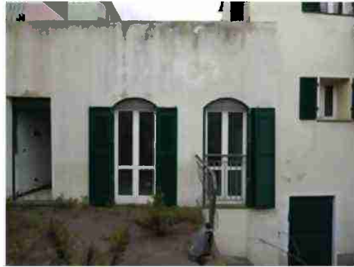
PORZIONE DI FABBRICATO CIV. 14 VISTE ESTERNE