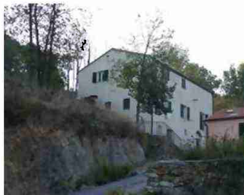
FABBRICATO VIA MOLINI CIV, 1/3/5