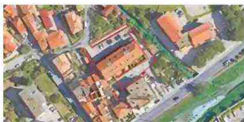
LOCALIZZAZIONE COMPLESSO SU BASE SATELLITARE