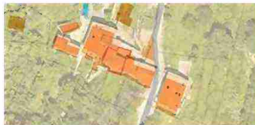
INDIVIDUAZIONE IMMOBILI LOTTO 4