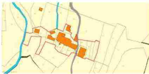
LOCALIZZAZIONE COMPLESSO SU BASE CATASTALE