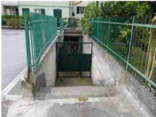
scala accesso ai box interrati mappale 670