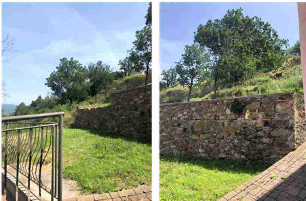
PORZIONE DI TERRENO AD USO CORTE GIARDINO