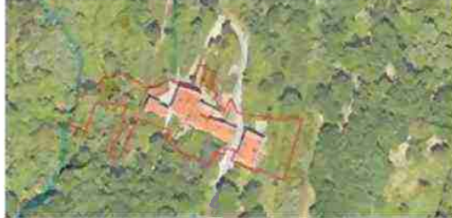
LOCALIZZAZIONE COMPLESSO SU BASE SATELLITARE