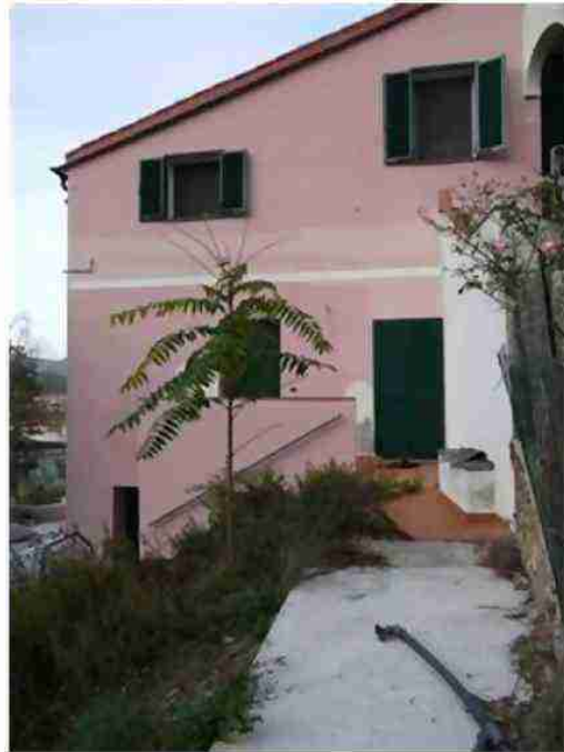
PORZIONE DI FABBRICATO CIV. 20 VISTE DA VALLE