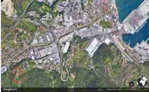
LOCALIZZAZIONE AREA A SCALA TERRITORIALE

I beni sono ubicati in zona rurale in un'area agricola, le zone limitrofe si trovano in un'area agricola (i più importanti centri limitrofi sono SAVONA (5 KM) GENOVA (50 KM)). Il traffico nella zona è locale, i parcheggi sono inesistenti. Sono inoltre presenti i servizi di urbanizzazione primaria.