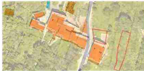
INDIVIDUAZIONE IMMOBILI LOTTO 9