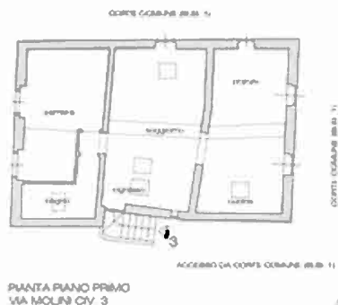
APPARTAMENTO CIVICO 3 - RILIEVO DI MASSIMA