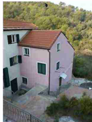
AREE DI PERTINENZA COMUNI A TUTTO IL COMPLESSO