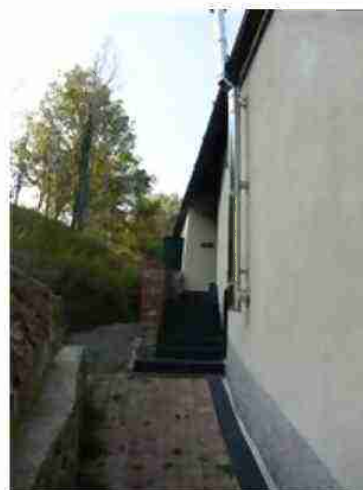
ACCESSO AL CIV. 3