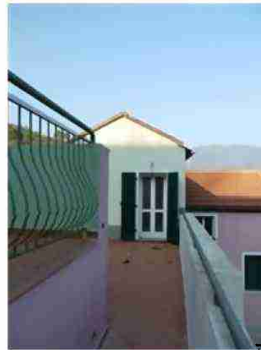
PORZIONE DI FABBRICATO CIV. 12 VISTE ESTERNE