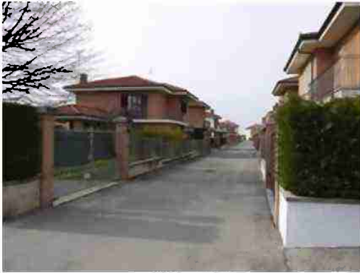
TIPOLOGIA INSEDIAMENTO RESIDENZIALE ADIACENTE AL LOTTO (LATO EST)