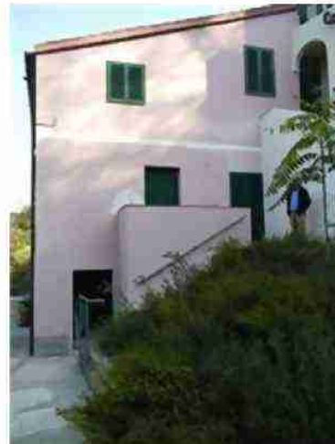
PORZIONE DI FABBRICATO CIV. 20 VISTA DA MONTE