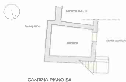
LOCALE CANTINA PIANO S4 - RILIEVO DI MASSIMA