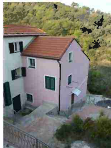
AREE DI PERTINENZA COMUNI A TUTTO IL