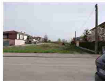
LOTTO EDIFICABILE VISTA DA NORD EST (VIA SALUZZO)