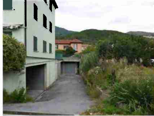
rampa di accesso ai box interrati mappali 673 e 694 e strette strisce di terreno adiacente mappali 674 - 695