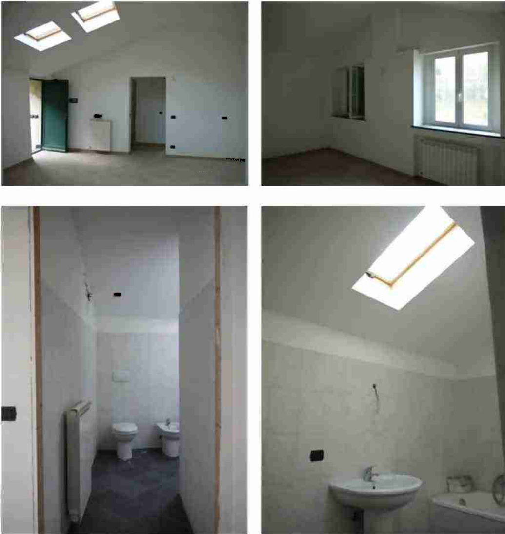
APPARTAMENTO CIV. 3 VISTE INTERNE