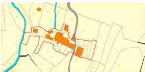
LOCALIZZAZIONE COMPLESSO SU BASE CATASTALE