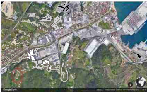
LOCALIZZAZIONE AREA A SCALA TERRITORIALE

I beni sono ubicati in zona rurale in un'area agricola, le zone limitrofe si trovano in un'area agricola (i più importanti centri limitrofi sono SAVONA (5 KM) GENOVA (50 KM)). Il traffico nella zona è locale, i parcheggi sono inesistenti. Sono inoltre presenti i servizi di urbanizzazione primaria.