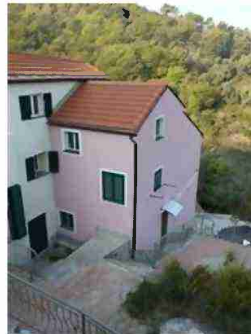
AREE DI PERTINENZA COMUNI A TUTTO IL COMPLESSO