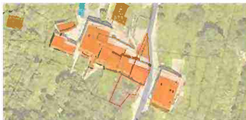
INDIVIDUAZIONE IMMOBILI LOTTO 2