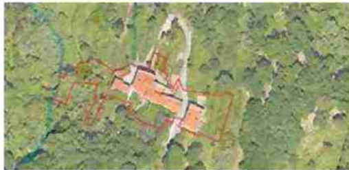
LOCALIZZAZIONE COMPLESSO SU BASE SATELLITARE