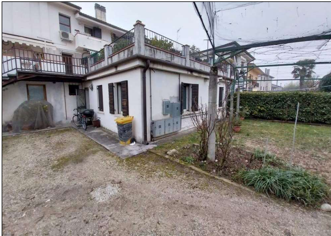
2) Lati sud ed est (parte con copertura a terrazza)