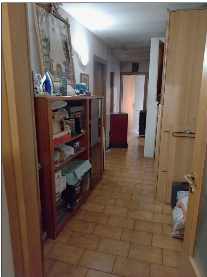
8) Corridoio lato ovest