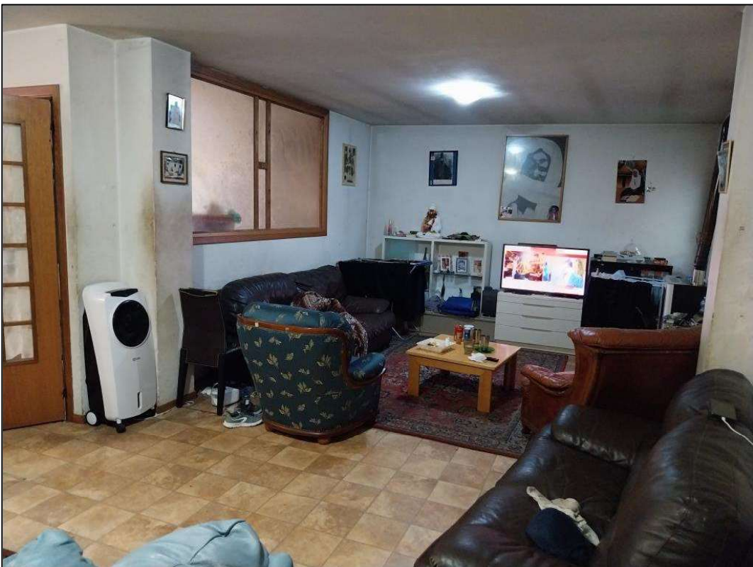
4) Soggiorno (vetrata sopra muretto divisorio con cucina)