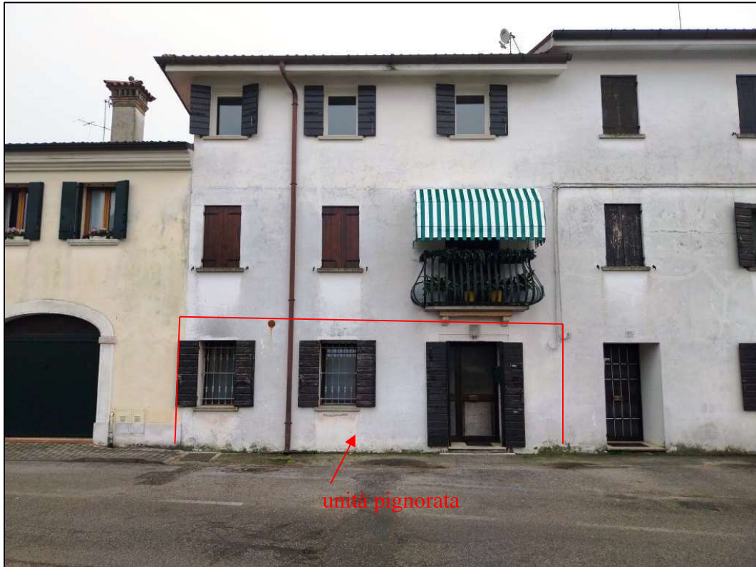
1) Lato nord – accesso da Via Caseggiato