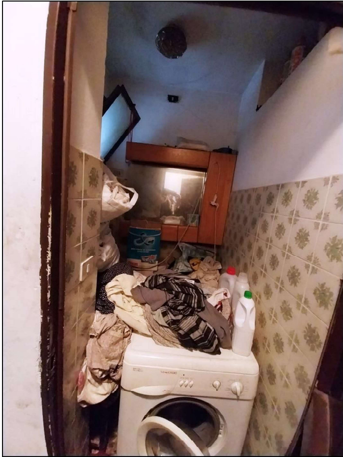
6) Wc lato est