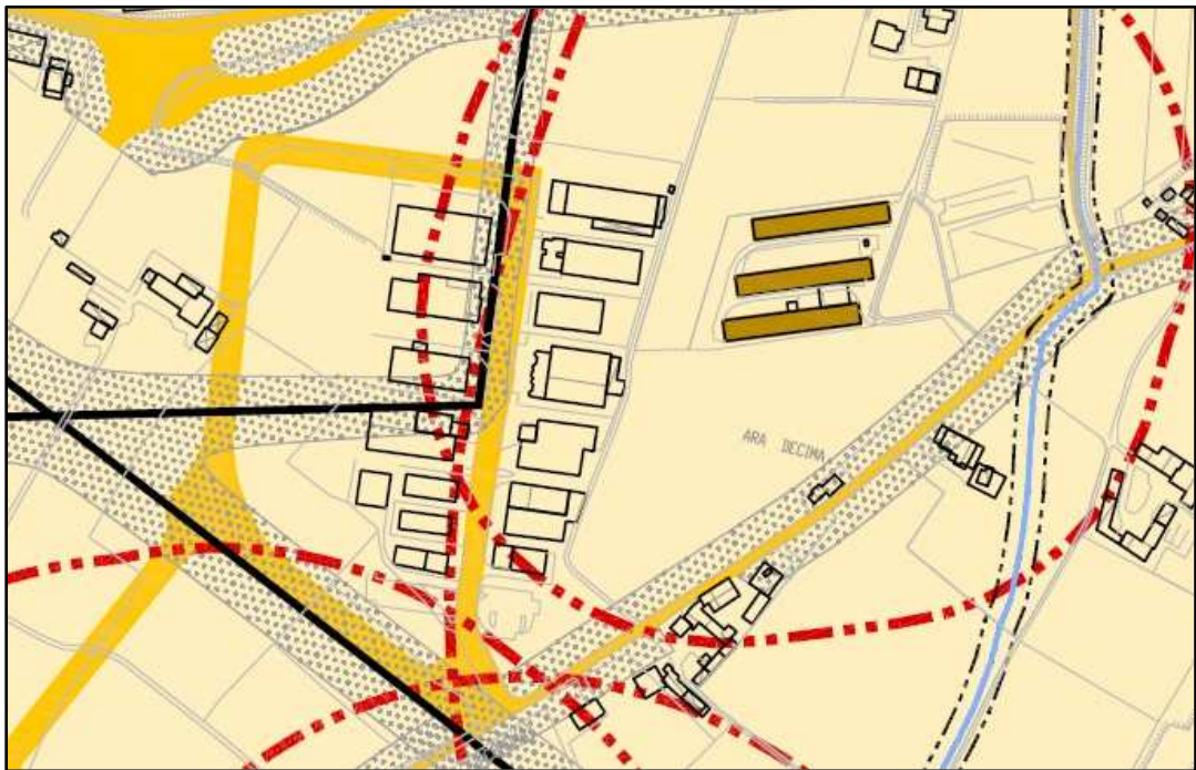
Estratto PAT - Vincoli