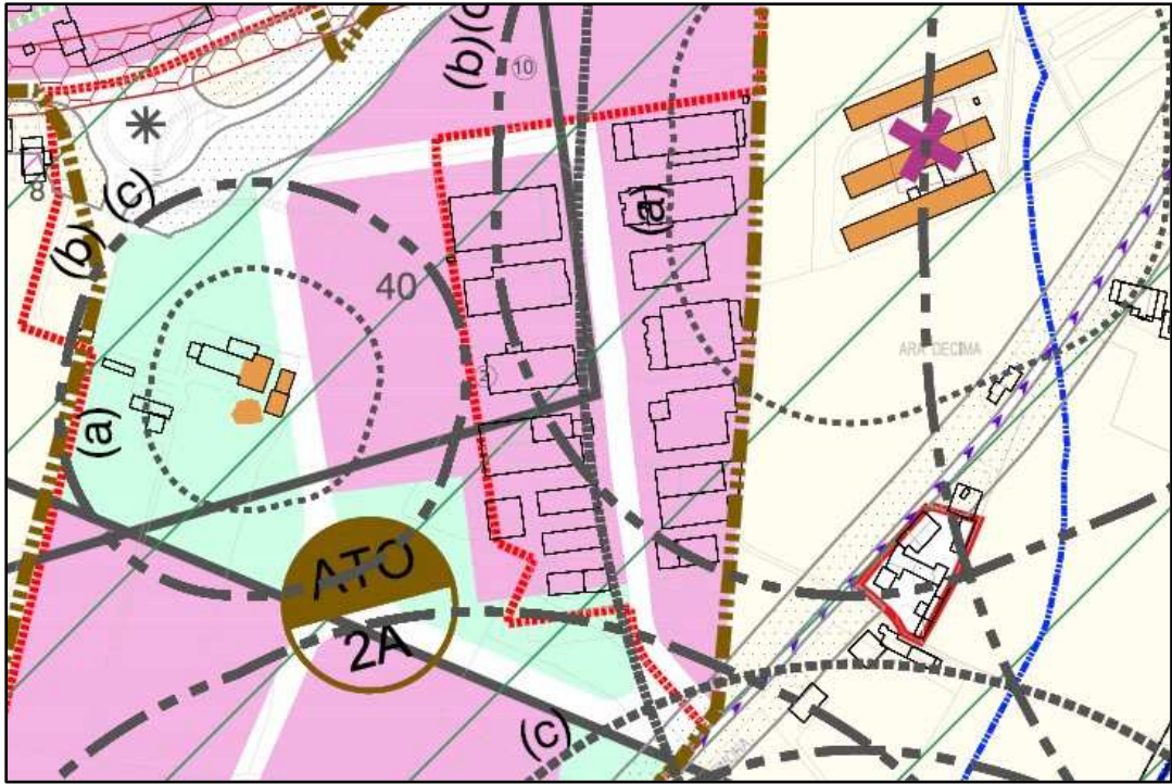
Estratto Piano degli Interventi