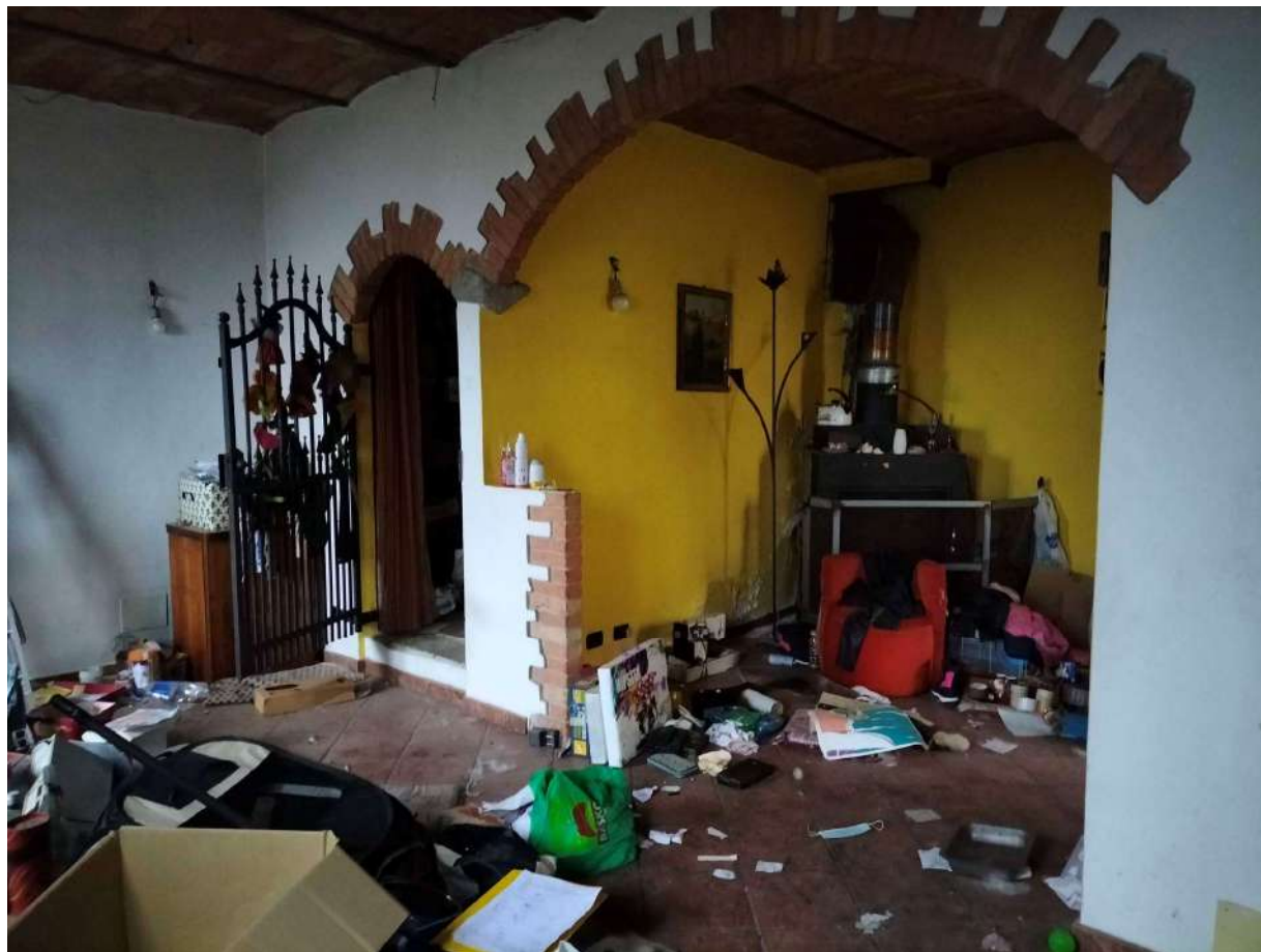
Locale INGRESSO Soggiorno- cucina ( difforme catastalmente)