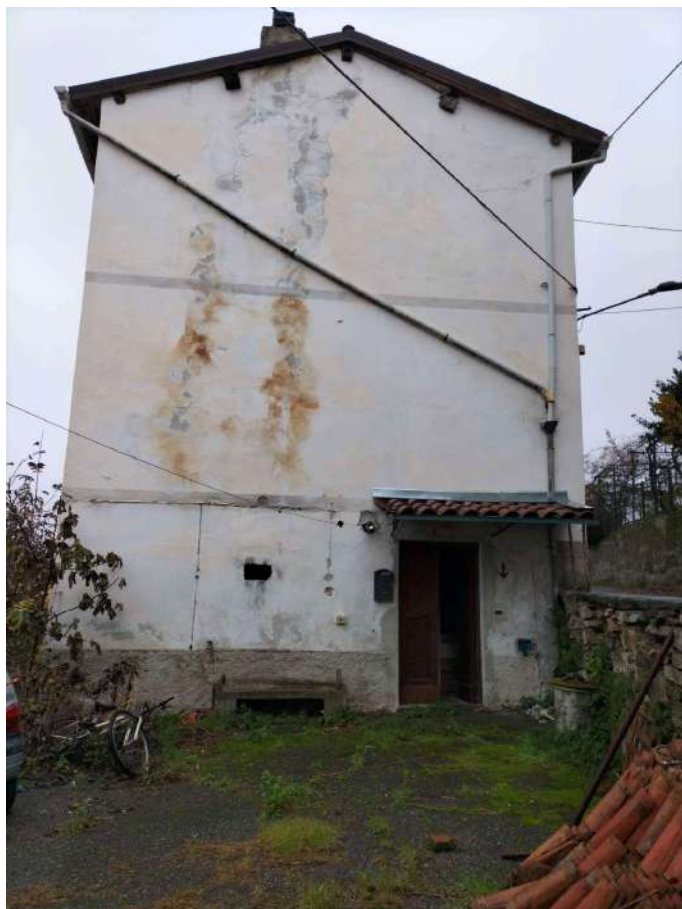
Ingresso dalla corte ( NORD)