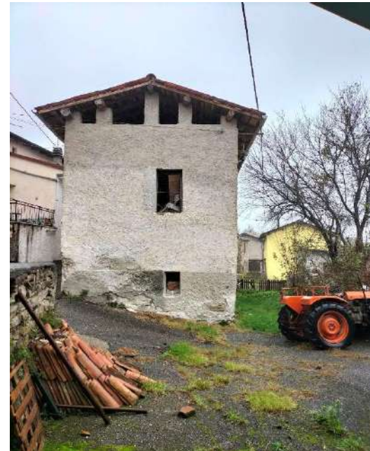
Vista dalla corte