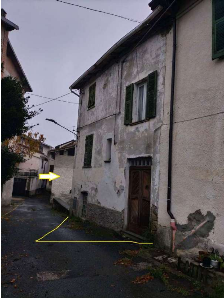
Abitazione e Ripostiglio (freccia gialla )