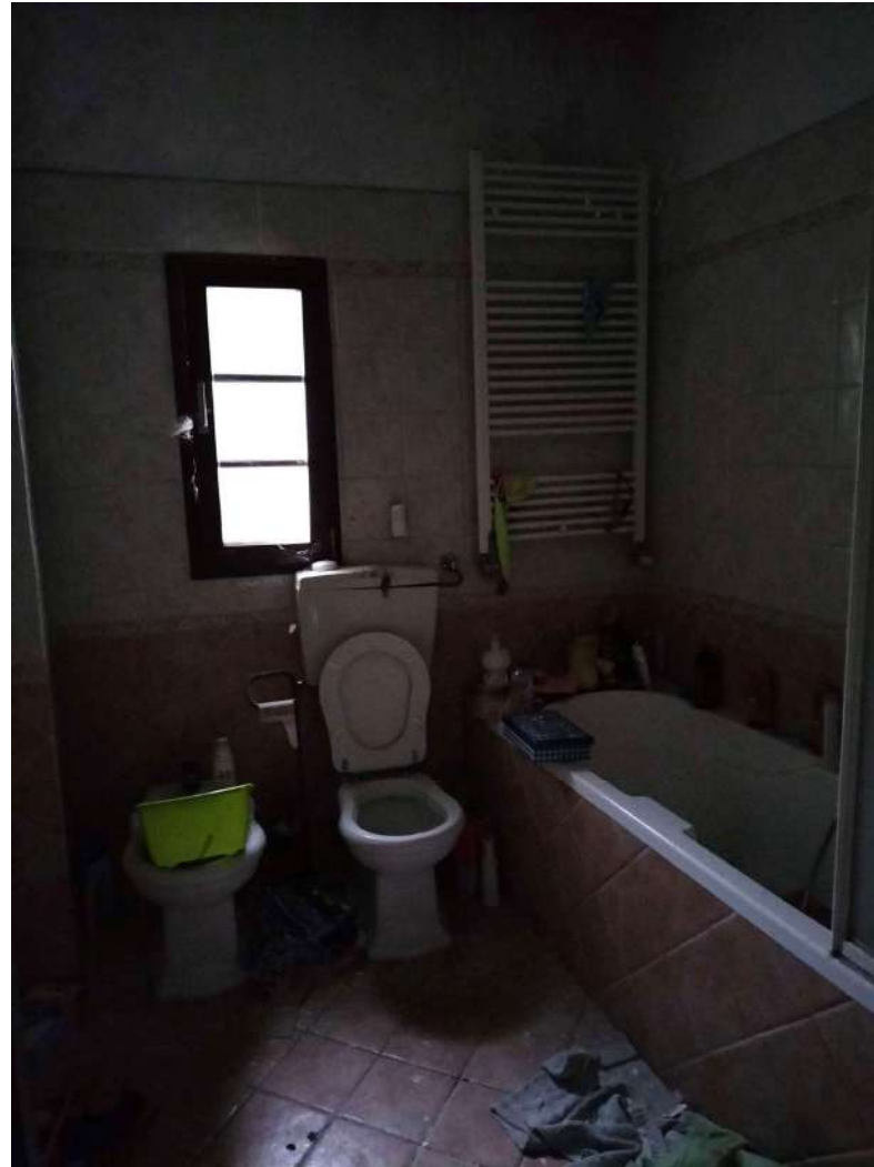
Wc. piano primo