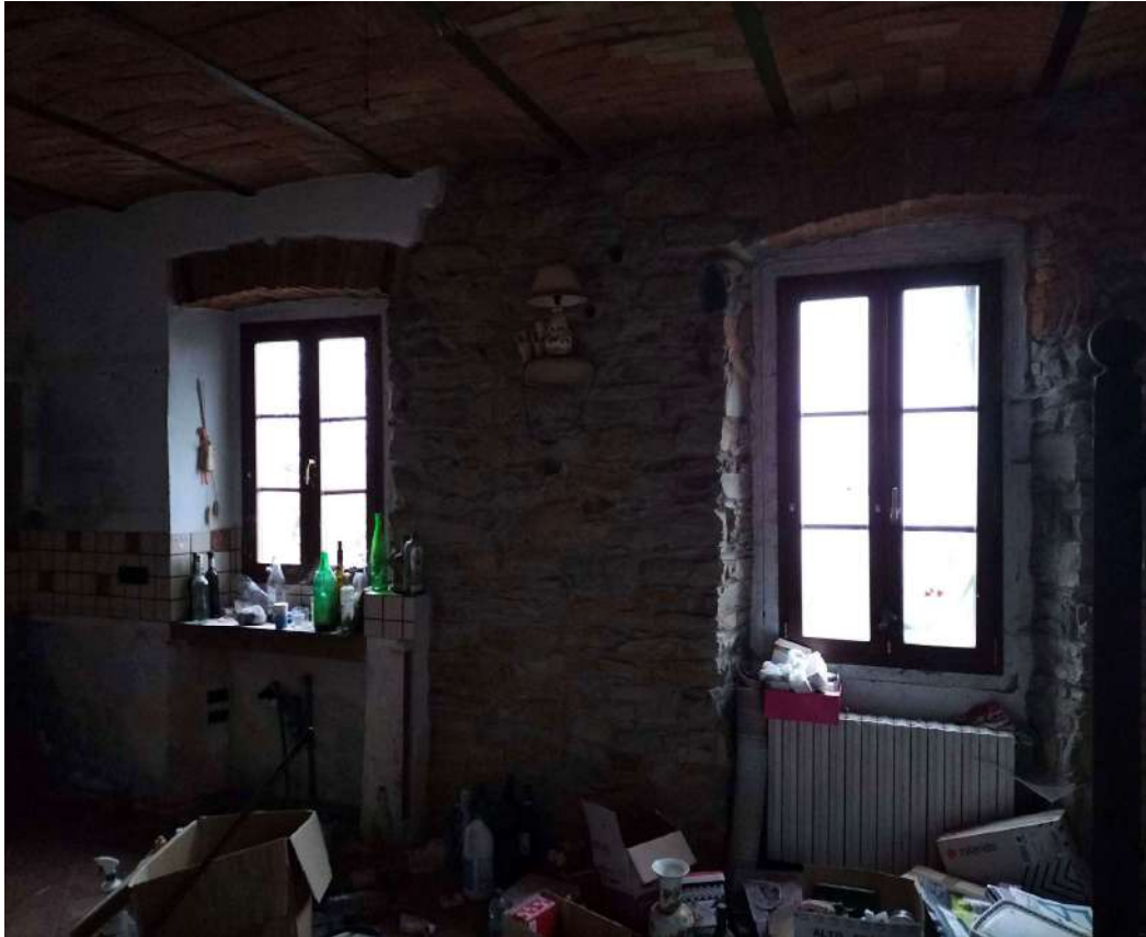
Soggiorno cucina p. terra