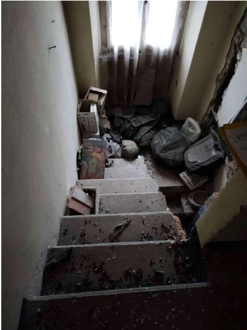
Scala acceso al piano primo