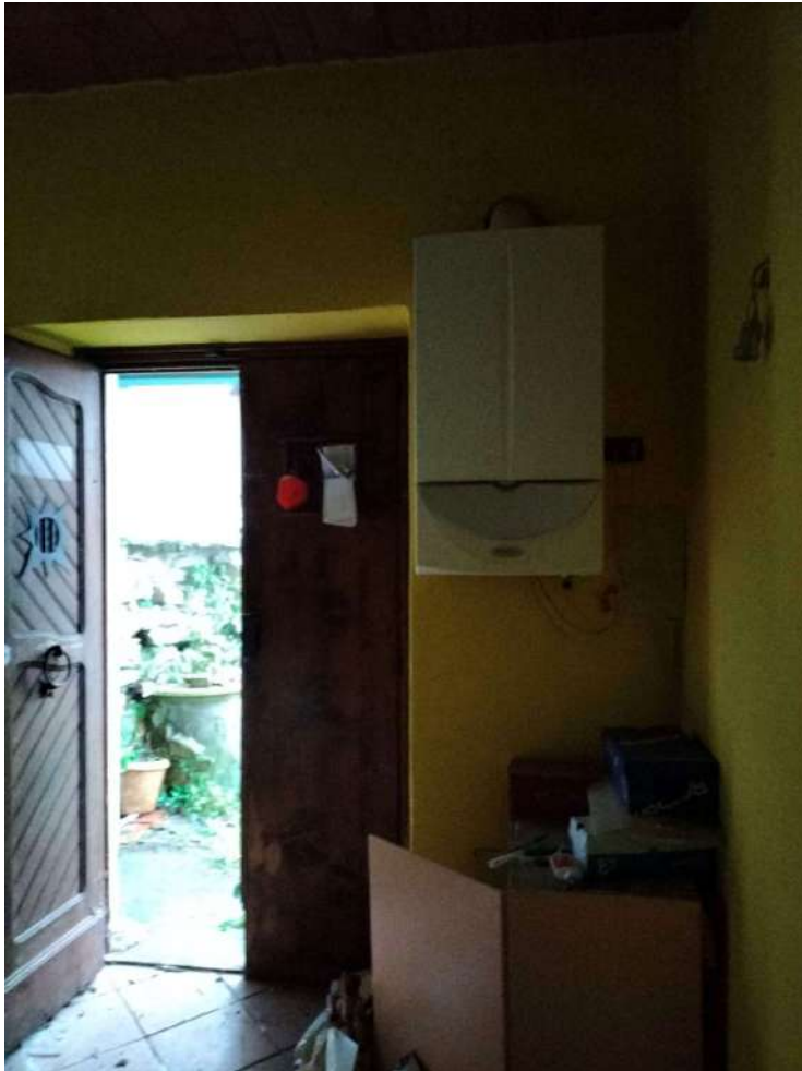
Calderina ingresso piano terra