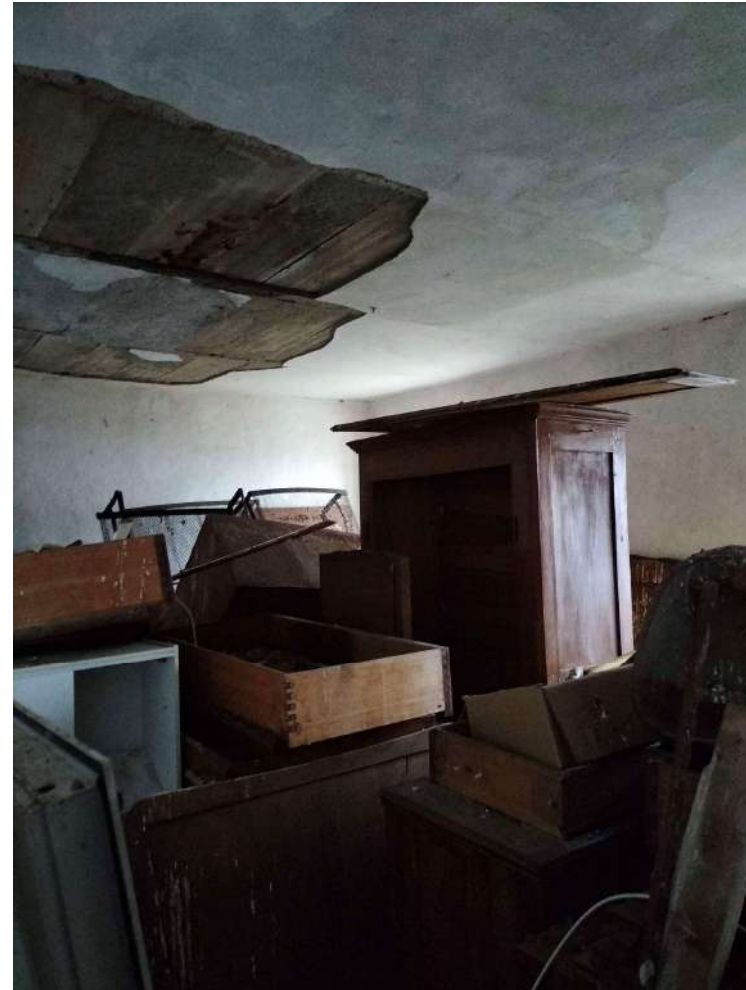
Camera piano primo