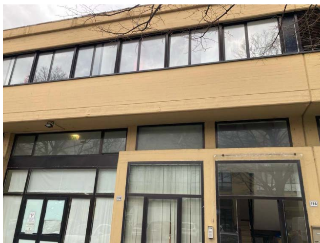
L'ingresso alle scale e le finestre al piano primo