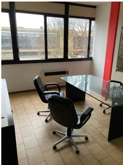
L'ufficio entrando a sinistra