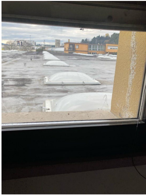
Veduta verso l'interno