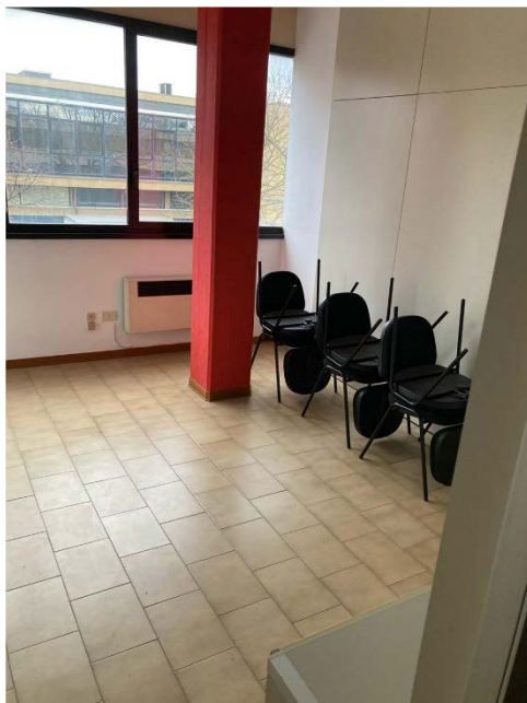
Il salone con alcune sedie