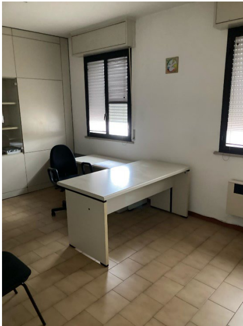
L'ufficio entrando a destra