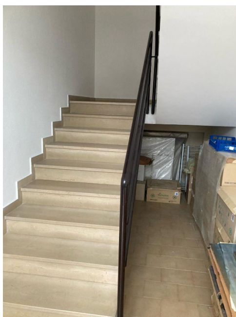
L'ingresso alle scale