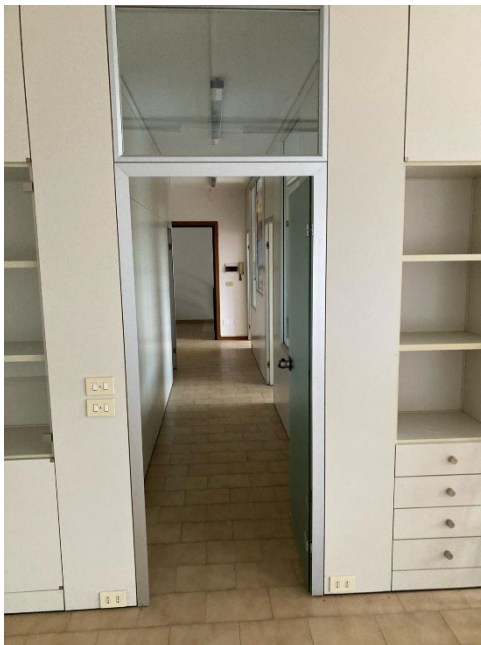
La divisione con le pareti mobili