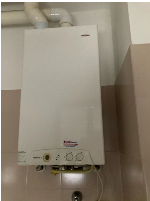
La caldaia posizionata nel bagno