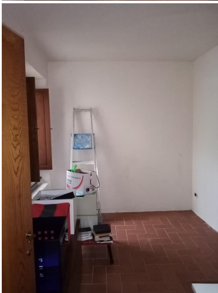
FOTO 19- camera