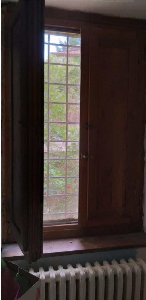
FOTO 26- infissi dettaglio interno