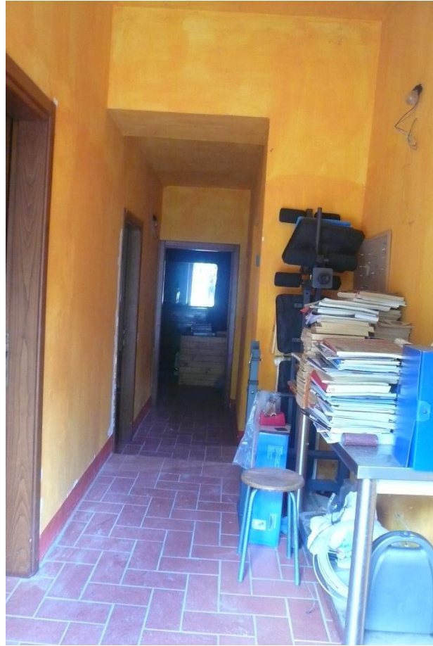
FOTO 14- ingresso vista su disimpegno