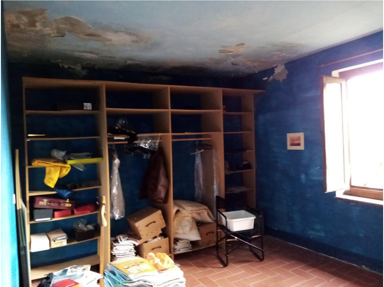
FOTO 15- camera -dettaglio infiltrazioni