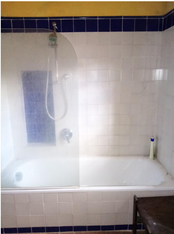
FOTO 21 - bagno