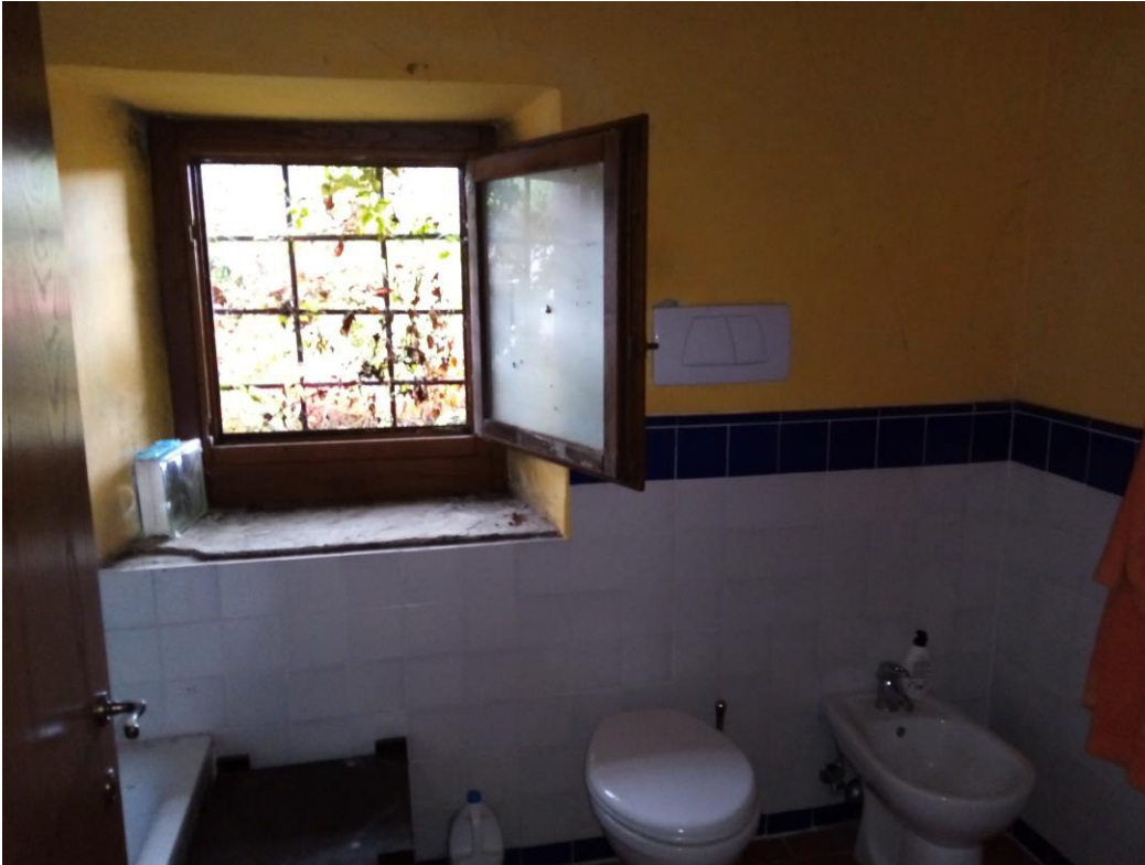
FOTO -20 bagno