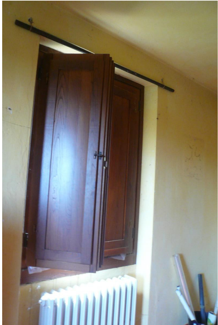
FOTO 27- infissi dettaglio interno