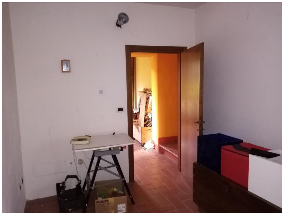
FOTO 18- camera