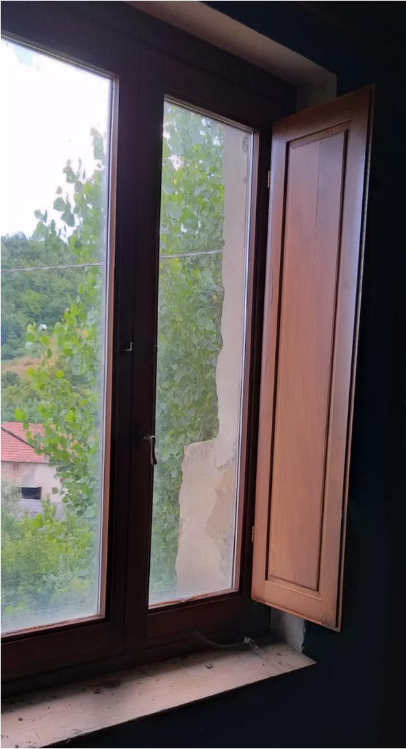
FOTO 28- infisso dettaglio interno