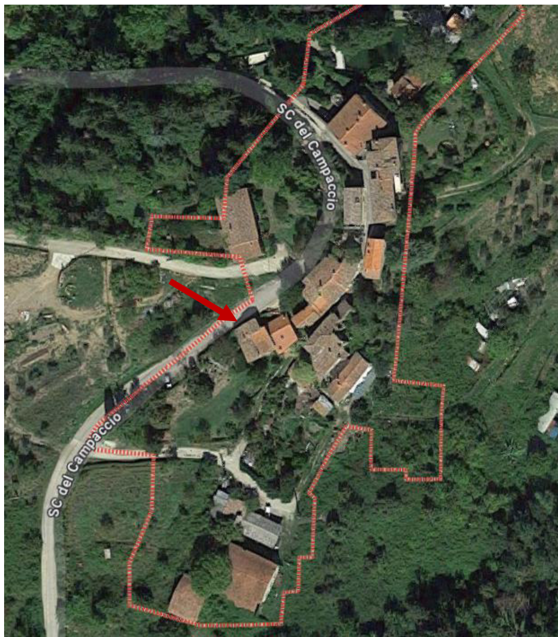
IMMAGINE AEREA - NUCLEO ABITATO DI CAMPACCIO con individuazione dell'immobile