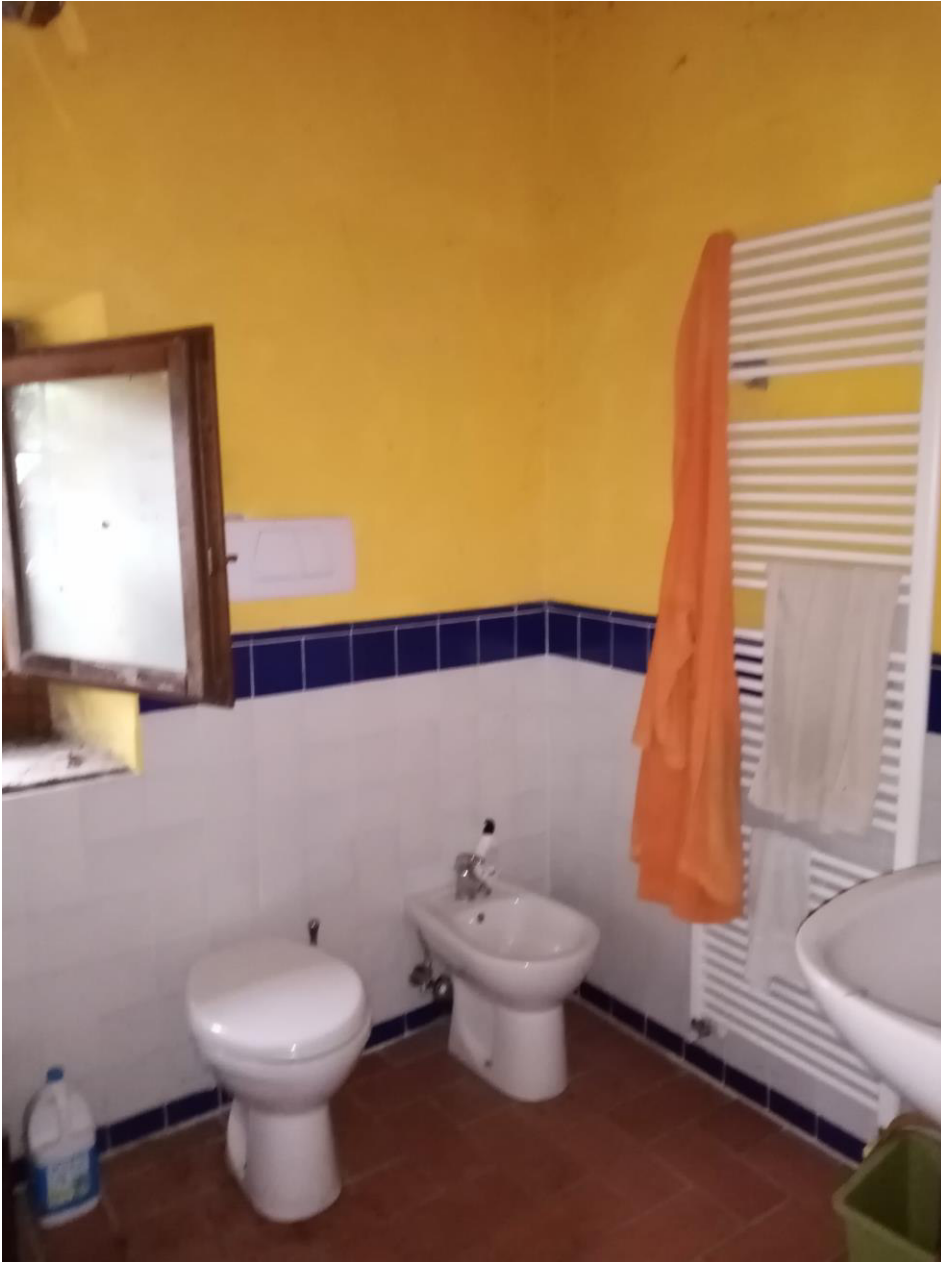
FOTO 22 - bagno