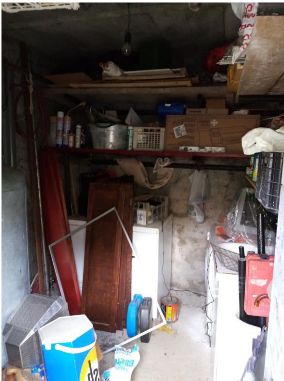
FOTO 25- locale cantina