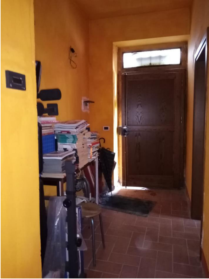
FOTO 13- ingresso