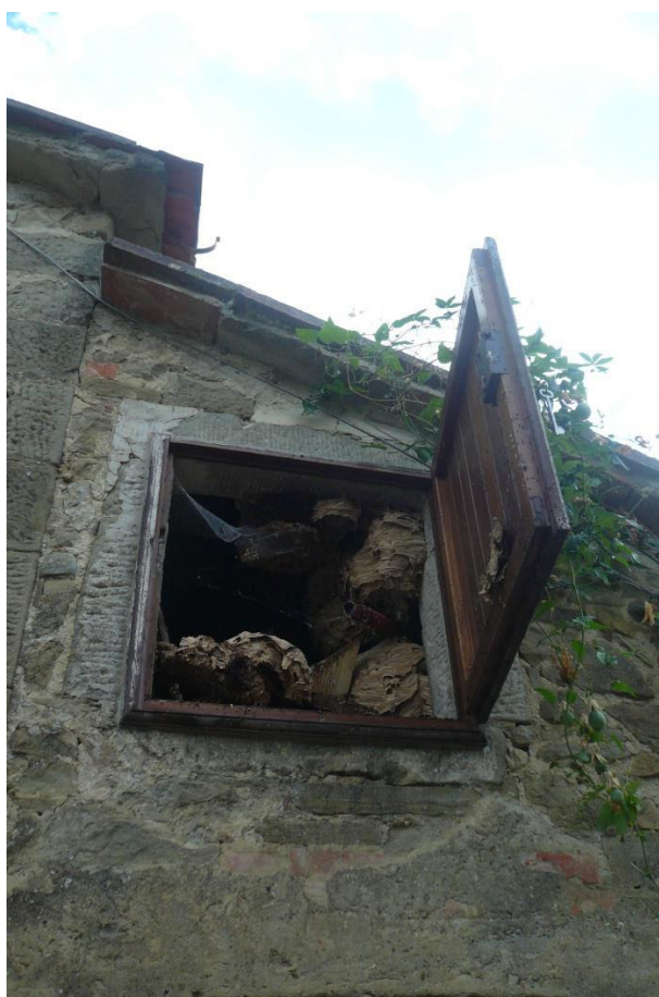
FOTO 10 accesso alla porzione di sottotetto