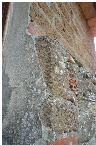
FOTO 8 – vista lato sud – finestra camera con accanto dettaglio sopraelevazione in bozze di tufo.