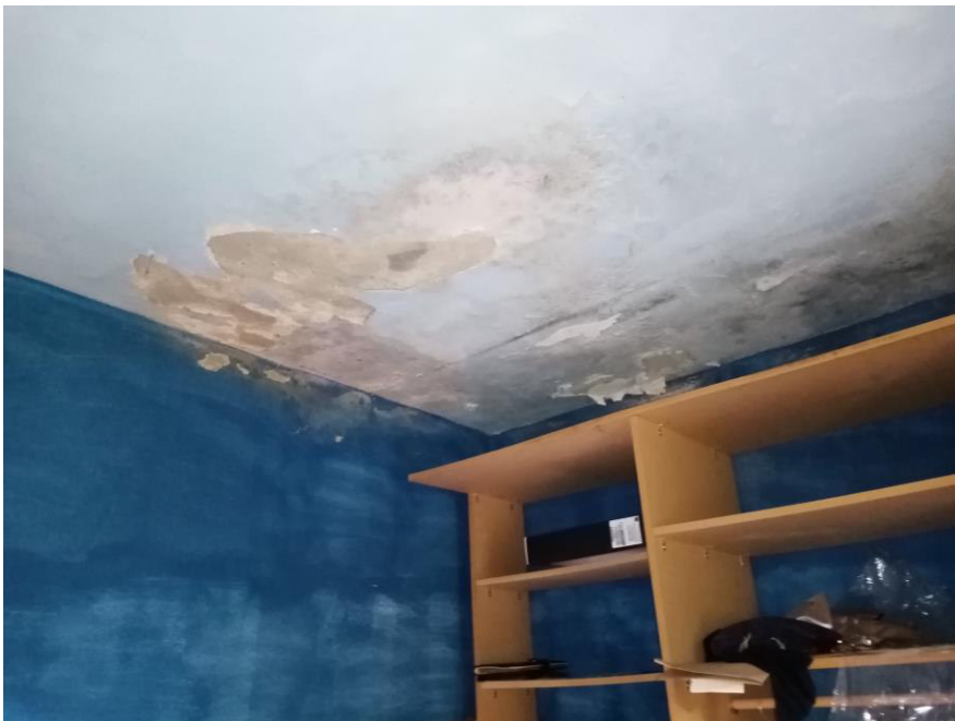
FOTO 16- dettaglio infiltrazioni