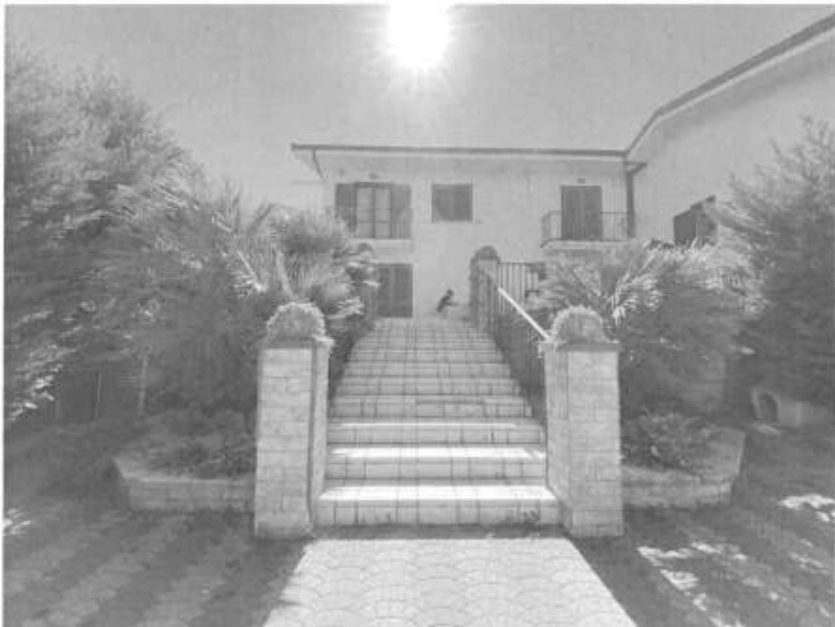
FIG. 2 - Ingresso da Via Santa Maria della Stozza

Arch. Paola Signorelli – Via Verona n. 14 – 87032 – AMANTEA (CS) – arch.paolasignorelli@pec.it – arch.paolasignorelli@gmail.com – cell: 3473803531