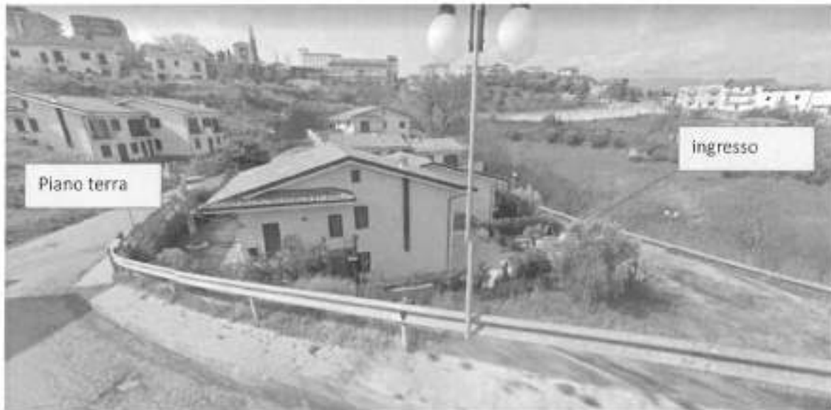
Fig. 1 - Prospetto laterale