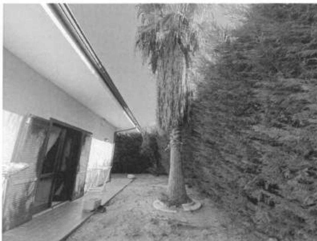
Fig. 3 - Cortile retrostante

L'immobile è sito in via Santa Maria della Stozza, e non come erroneamente indicato nell'atto di pignoramento in Via Cappuccini, ed è parte di una villetta bifamiliare con accesso indipendente dall'annessa corte esclusiva, posta sui lati nord, sud ed est. L'unità immobiliare si sviluppa su due livelli collegati da una scala interna ed una esterna. I due livelli, in planimetria catastale sono indicati come seminterrato e piano terra, ma il piano terra è al di sotto del livello della strada Santa Maria della Stozza, come evidenziato in fig 1 e il piano seminterrato è al di sopra dell'accesso reale della villetta. I due livelli sono così costituiti: