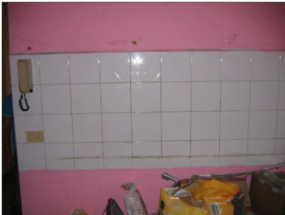
Foto n° 25 – Vista di una delle pareti del vano ingresso/cucina/soggiorno. La parete predisposta per la cucina è rivestita con piastrelle di maiolica delle dimensioni di cm 20x20. L'appartamento è, inoltre, dotato di impianto citofonico.