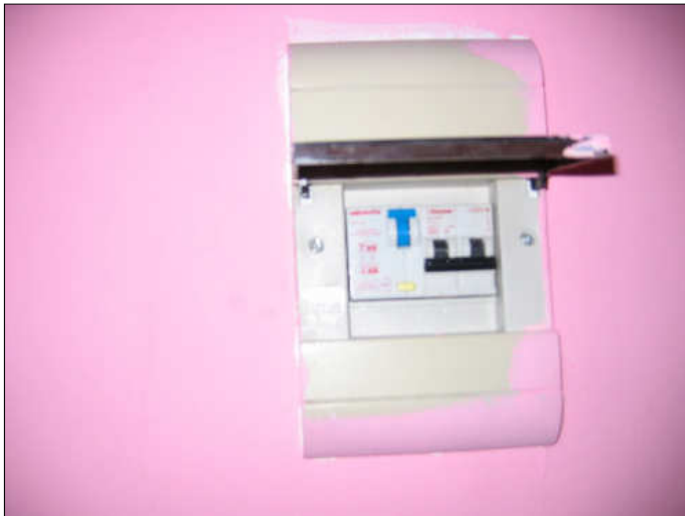
Foto n° 24 – Foto scattata al quadro elettrico posto all'ingresso dell'appartamento. Lo stesso è dotato di differenziale magnetotermico (salvavita) e di interruttore generale (prese-luci).