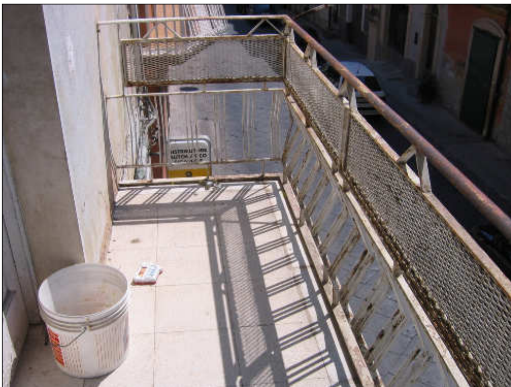
Foto n° 28 – Foto scattata sul balcone esterno che si affaccia su via Cavour. La pavimentazione è in monocottura e si presenta in buone condizioni. Scarso lo stato di finitura della ringhiera.