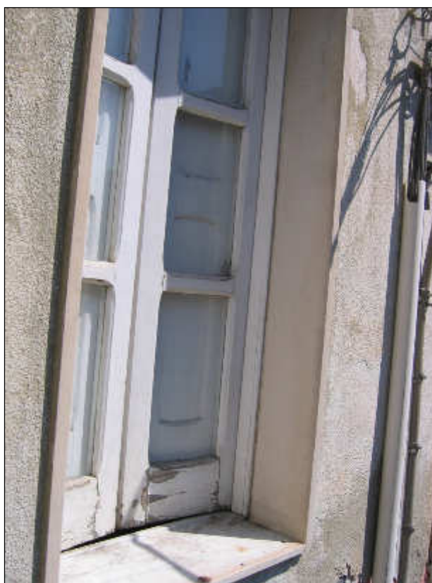
Foto n° 34 – Foto scattata all'infisso in legno posto all'interno del bagno.