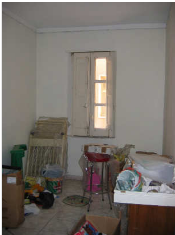
Foto n° 37 – Foto scattata all'interno della camera da letto. Le pareti sono tutte intonacate e tinteggiate con idropittura in discreto stato di conservazione.