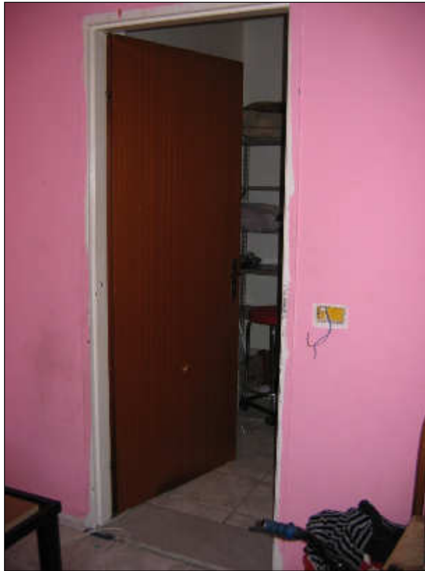
Foto n° 35 – Foto scattata alla porta di accesso alla camera da letto. L'impianto elettrico è fatiscente e privo di interruttori.