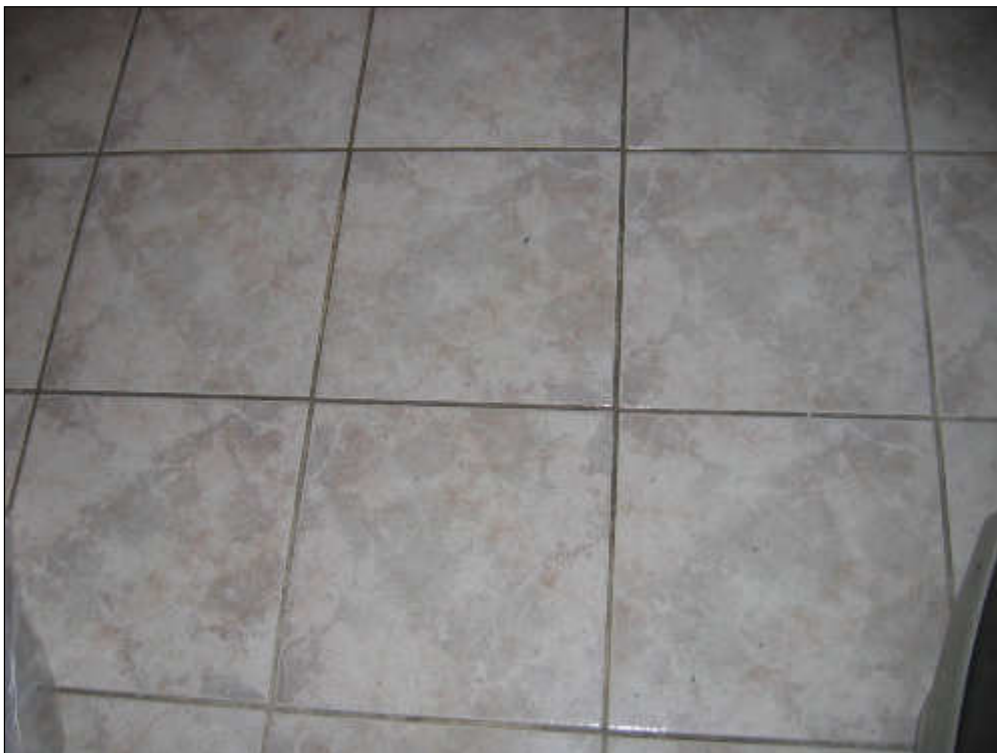
Foto n° 36 – Foto scatta al pavimento in monocottura posto all'interno della camera da letto.