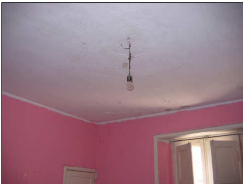
Foto n° 26 – Vista del soffitto e delle pareti del vano cucina/ingresso/soggiorno. Lo stesso è rifinito con pittura a tempera in non buone condizioni.