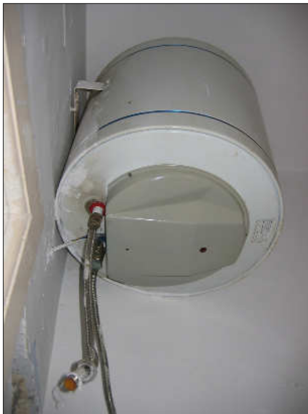
Foto n° 32 – Foto scattata allo scaldabagno elettrico da 50 litri. Lo stesso non risulta allacciato alla rete idrica in quanto sono stati rimossi gli impianti.