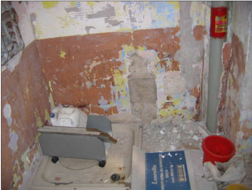
Foto n° 31 – Foto scattata all'interno del bagno. Lo stesso è privo di impianti, di servizi e di finiture.