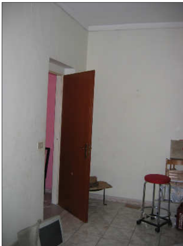
Foto n° 38 – Foto scattata all'interno della camera da letto. Le pareti sono tutte intonacate e tinteggiate con idropittura in discreto stato di conservazione.