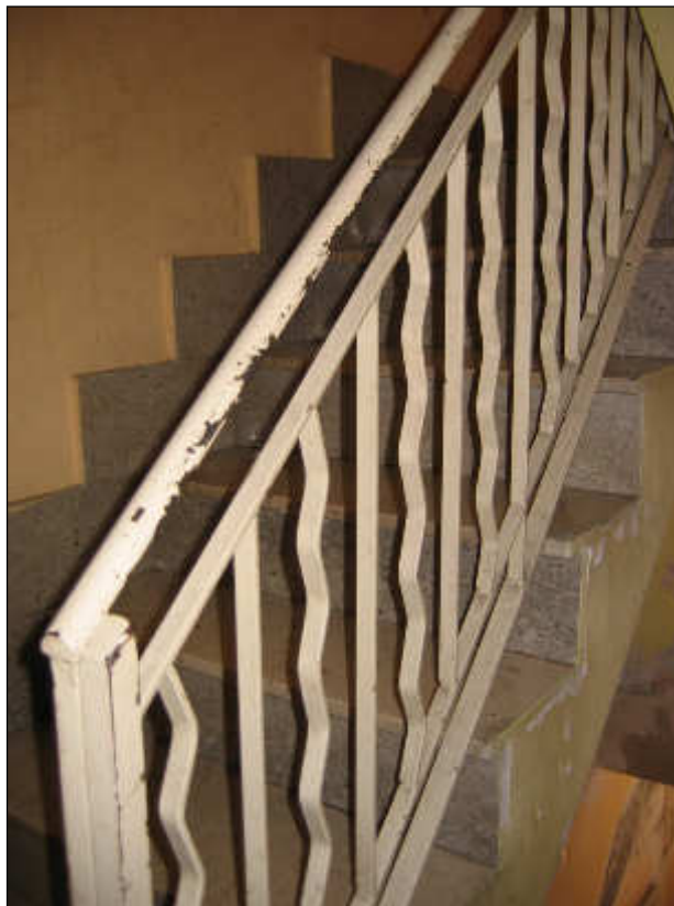
Foto n° 22 – Vista del ringhiera in ferro posta sulla scala di accesso. La stessa si presenta in discrete condizioni, essendo priva di manutenzione ordinaria.