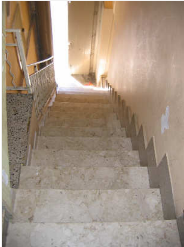
Foto n° 21 – Vista della scala di accesso al primo piano tutta rivestita in marmo. Le finiture delle pareti non sono in buono stato.