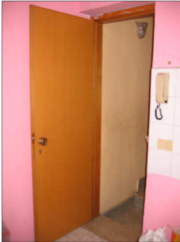
Foto n° 23 – Vista della porta di accesso all'appartamento del primo piano.