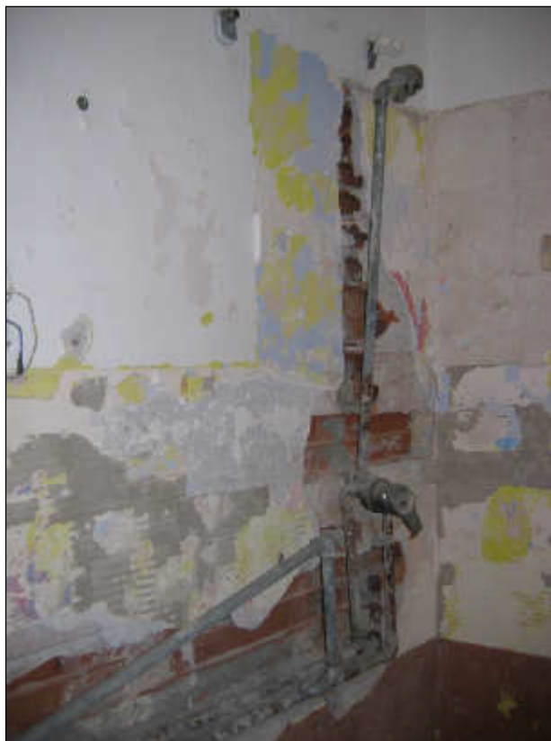
Foto n° 33 – Foto scattata alla porzione di impianto idrico relativo alla doccia ma che non risulta allacciato alla rete idrica.