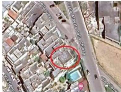
vista su GMaps