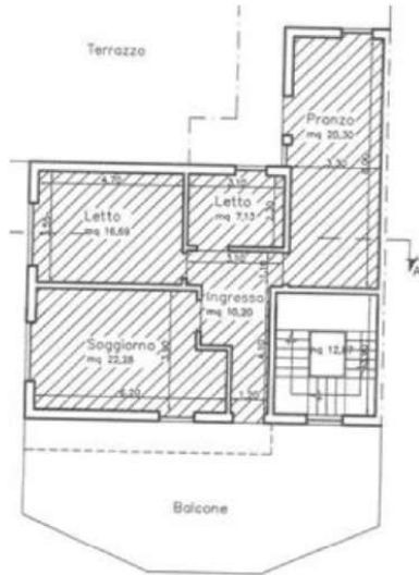
ultima planimetria depositata in comune