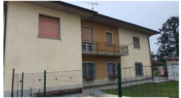
10. Esterno fabbricato