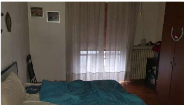
13. Camera da letto