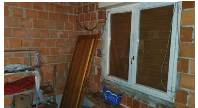
15. Locale pluriuso