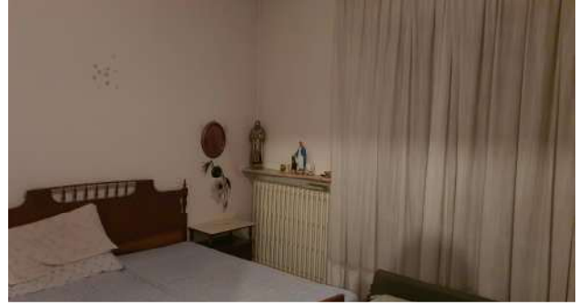
9. Camera da letto