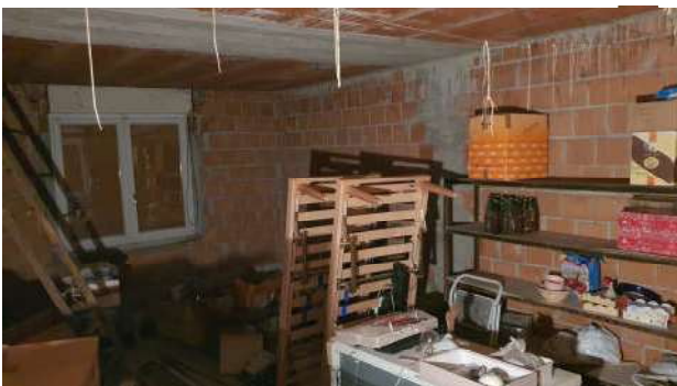
14. Locale pluriuso