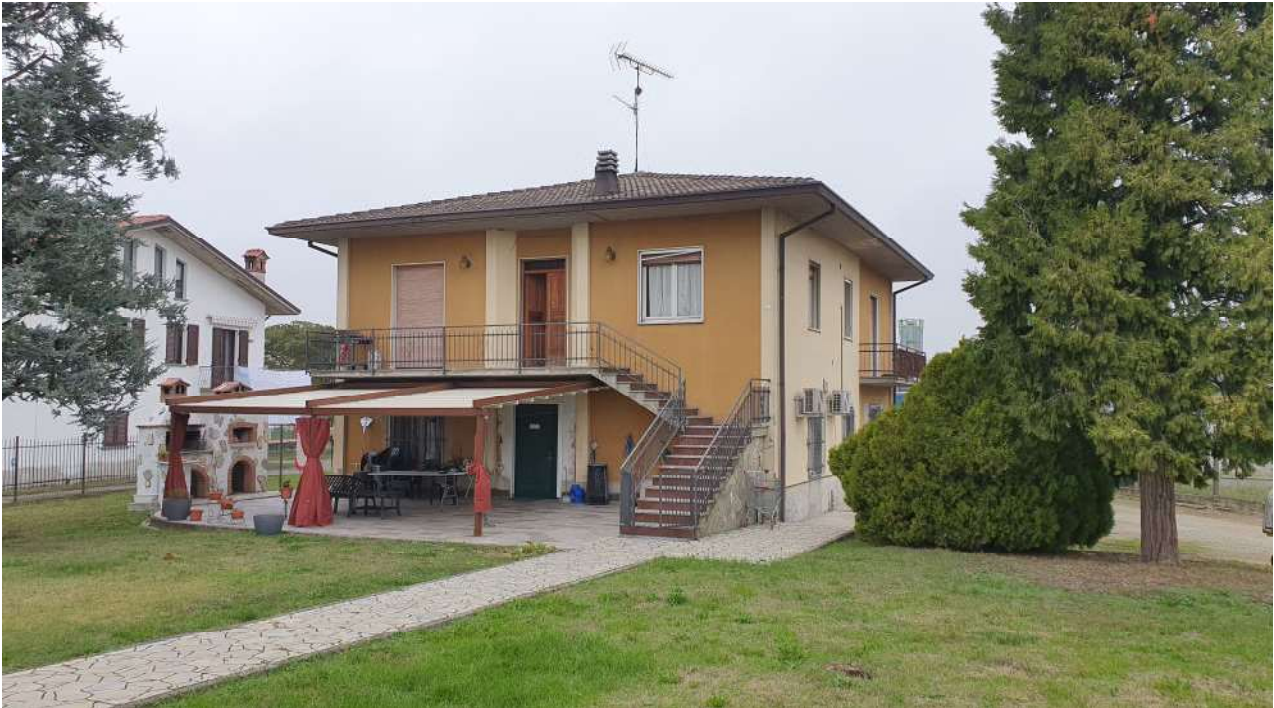
1. Esterno fabbricato