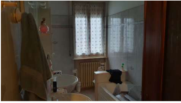
8. Servizio igienico