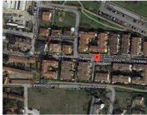
Vista aerea (fuori scala)