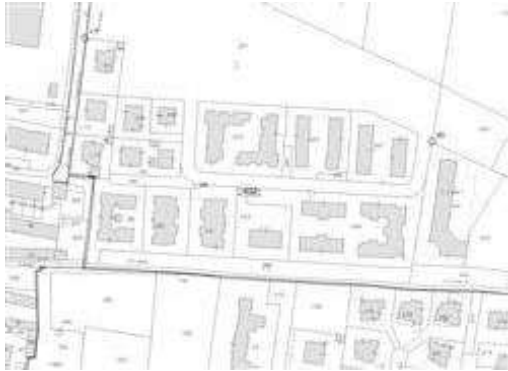
Estratto mappa catastale (fuori scala)

I beni sono ubicati in zona periferica in un'area residenziale, le zone limitrofe si trovano in un'area mista. Il traffico nella zona è locale, i parcheggi sono sufficienti. Sono inoltre presenti i servizi di urbanizzazione primaria e secondaria.