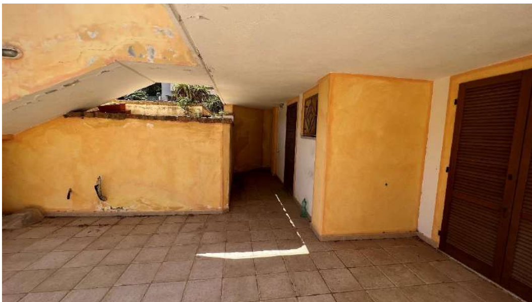
Figura 9 – Viste del subalterno 65