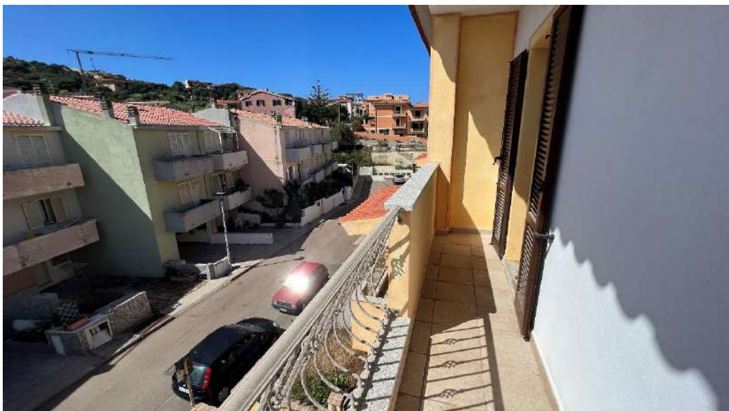
Figura 7 – Viste del subalterno 55