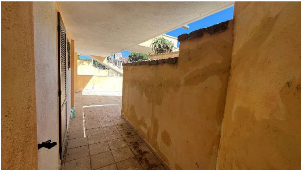
Figura 10 – Viste del subalterno 65