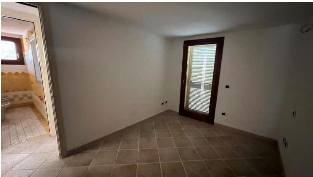
Figura 14 – Viste del subalterno 65