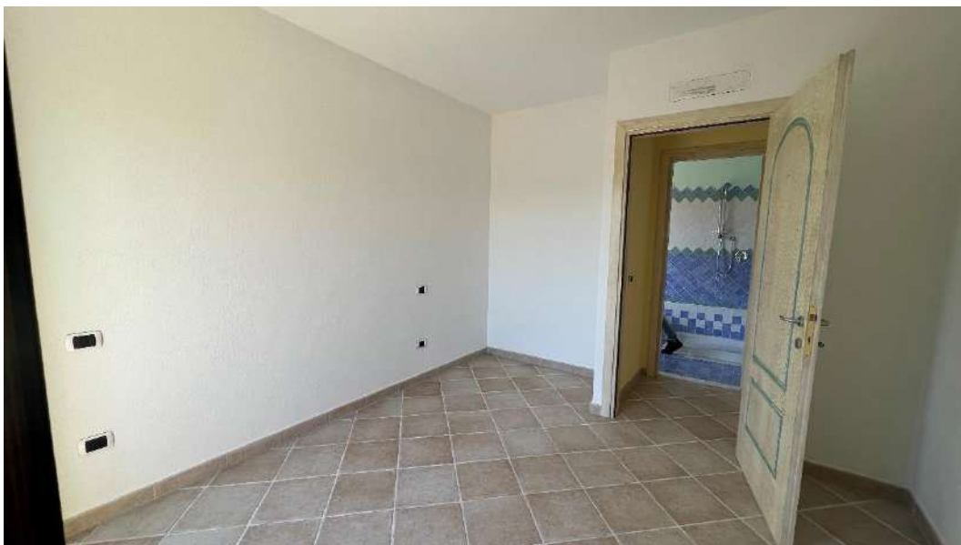
Figura 4 – Viste del subalterno 55