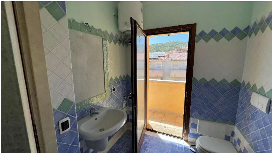
Figura 6 – Viste del subalterno 55