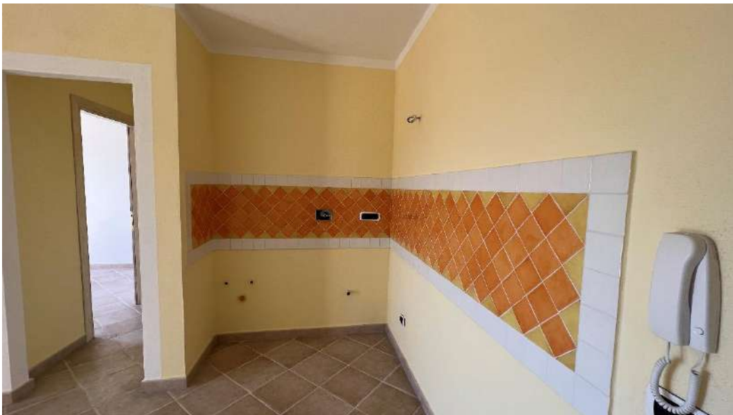
Figura 1 – Viste del subalterno 55