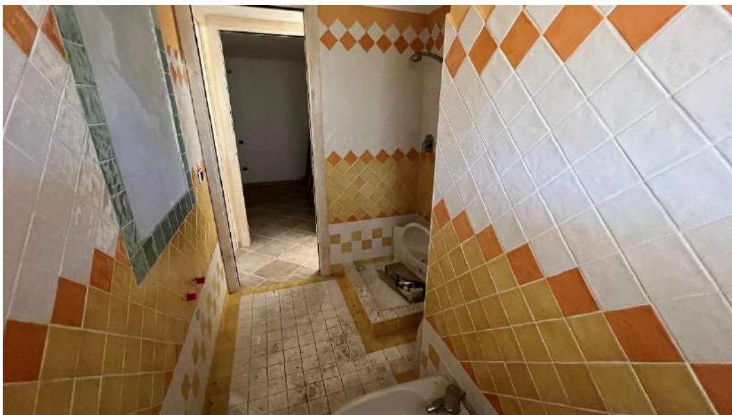
Figura 15 – Viste del subalterno 65