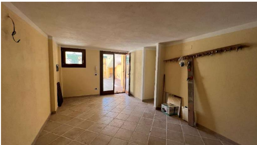
Figura 12 – Viste del subalterno 65