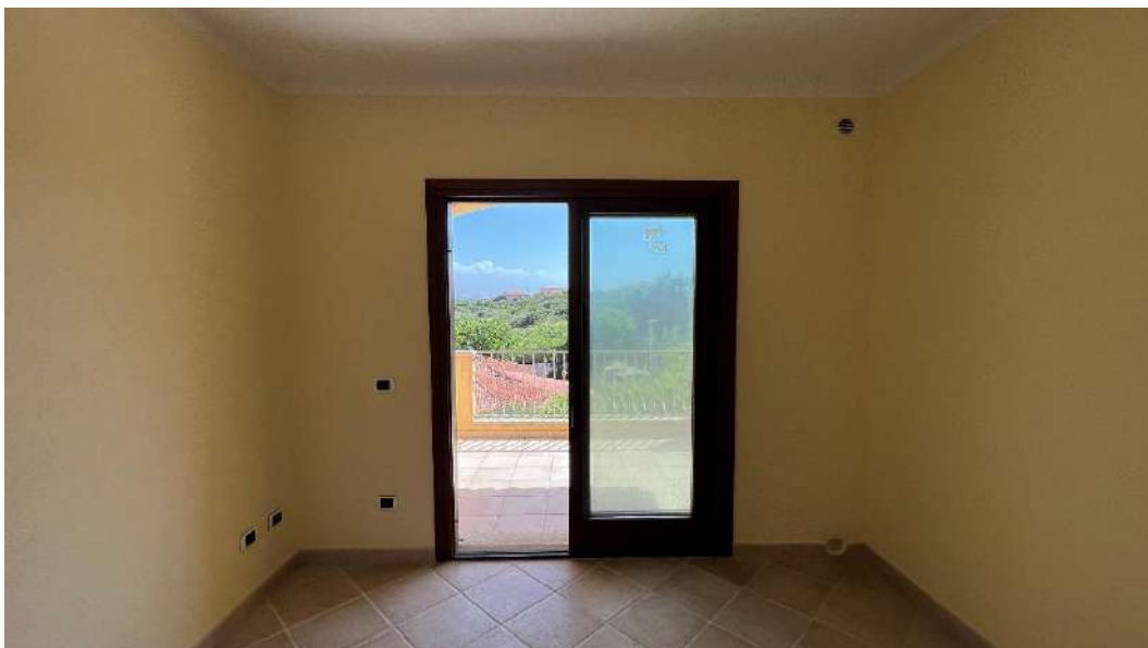
Figura 2 – Viste del subalterno 55