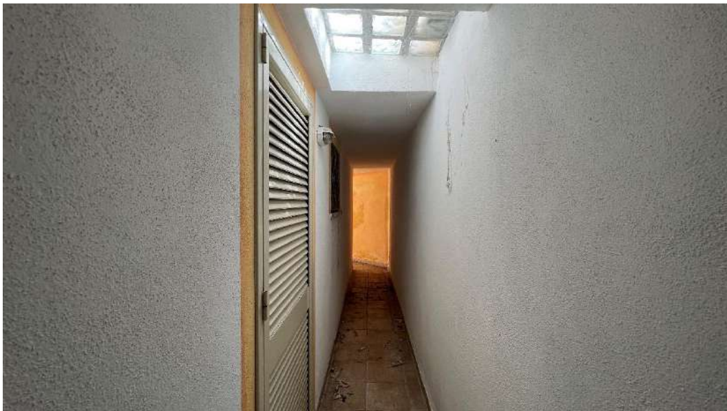
Figura 11 – Viste del subalterno 65