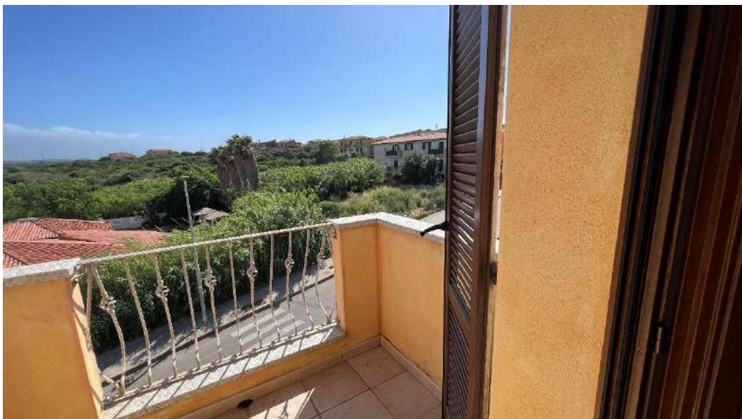
Figura 5 – Viste del subalterno 55