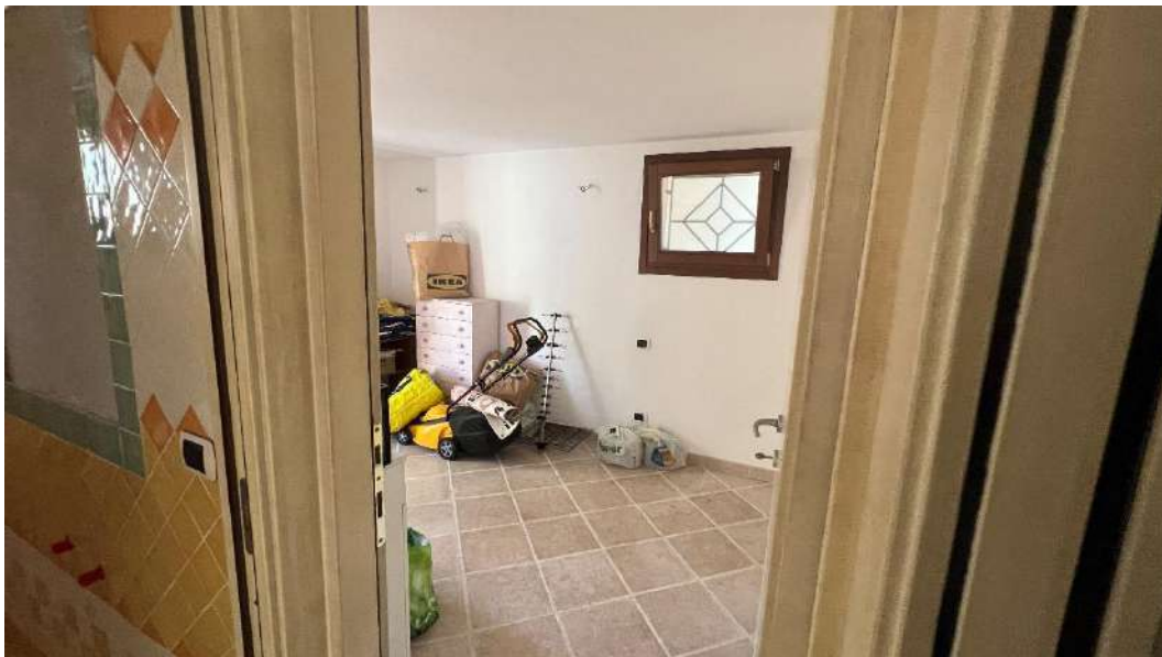
Figura 13 – Viste del subalterno 65