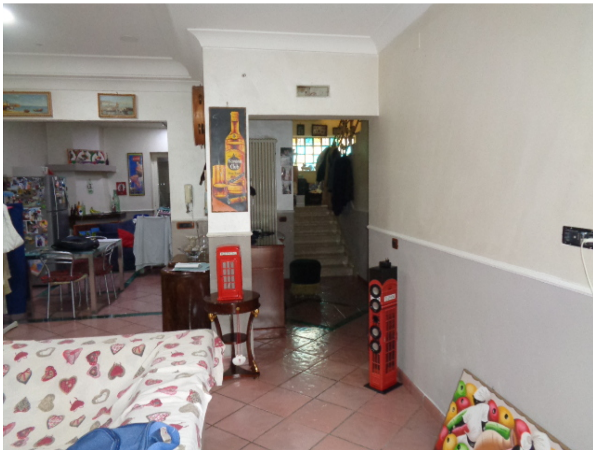
Foto n. 5: • Passetto d'ingresso (in fondo si scorge la scala interna che conduce al primo piano).