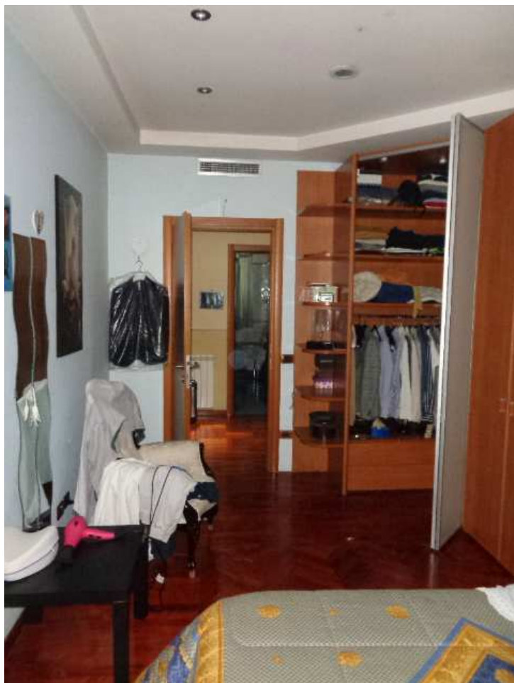
Foto n. 21: • Prima stanza a sinistra del disimpegno a primo piano.