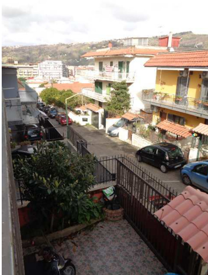
Foto n. 24: • Balcone a primo piano su prospetto principale e veduta su strada di accesso.