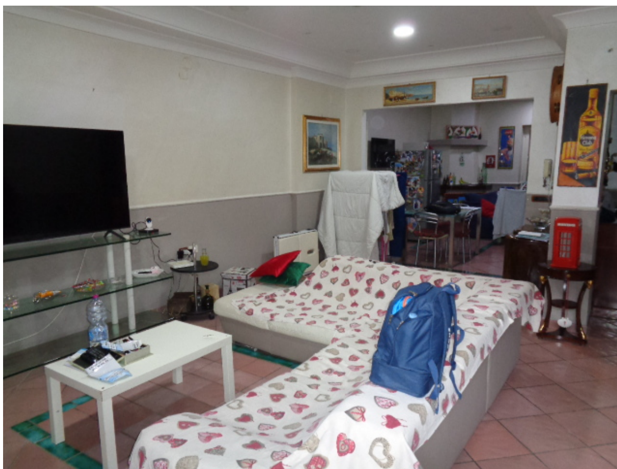
Foto n. 6: • Zona soggiorno a piano terra (in fondo s'intravede la cucina).