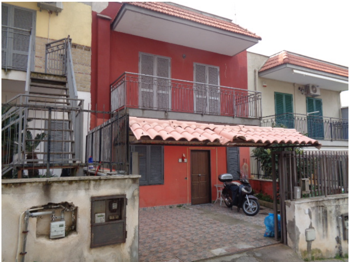
Foto n. 3: • Prospetto principale e varco di accesso (non meglio contrassegnato).