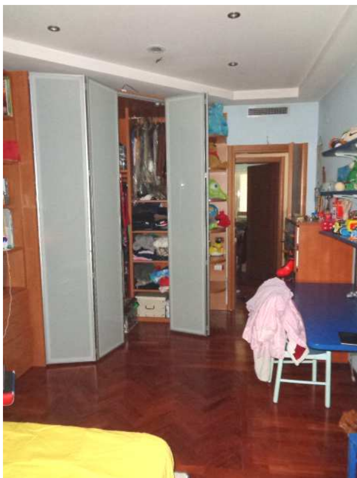
Foto n. 23: • Seconda stanza a sinistra del disimpegno a primo piano.