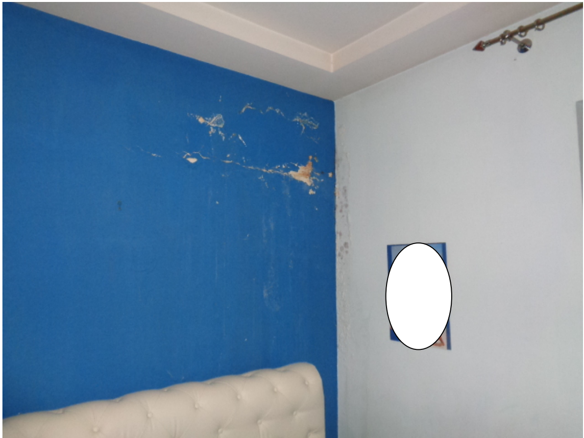
Foto n. 22: • Tracce d'infiltrazione nella stanza di cui alle foto precedenti.