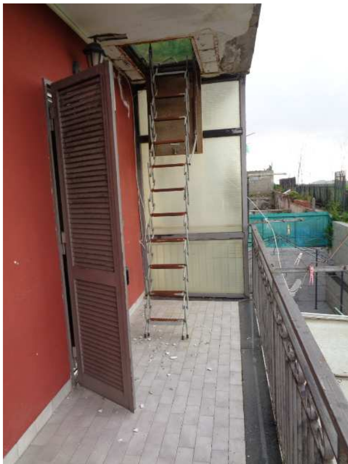
Foto n. 27: • Balcone a primo piano su prospetto posteriore. • Si vede la scala a pantografo di accesso alla copertura.