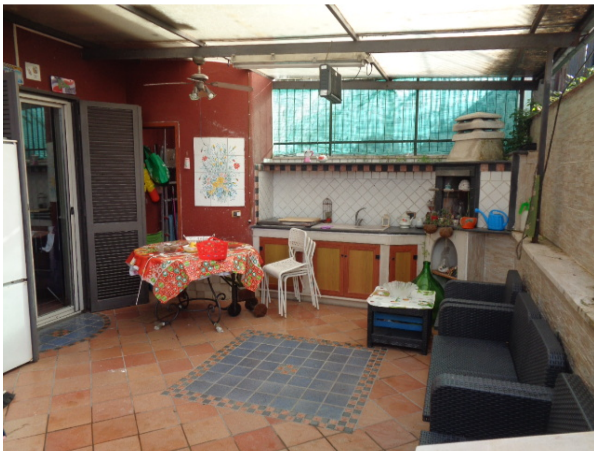
Foto n. 14: • Terrazzo avente accesso dalla cucina (di fronte si vedono il piccolo ripostiglio esterno e la zona attrezzata con cucina in muratura).