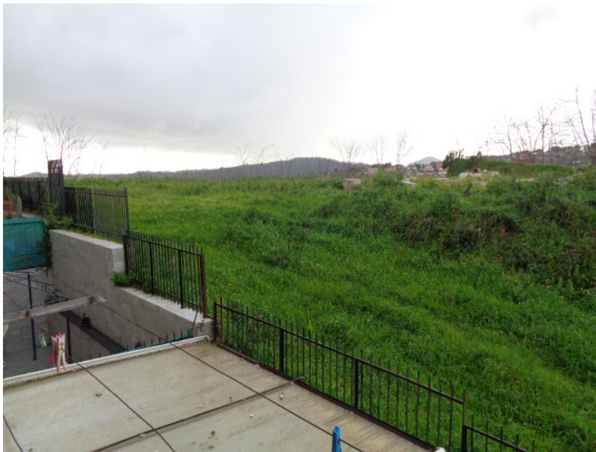
Foto n. 29: • Veduta dal balcone posteriore a primo piano su area a verde confinante.