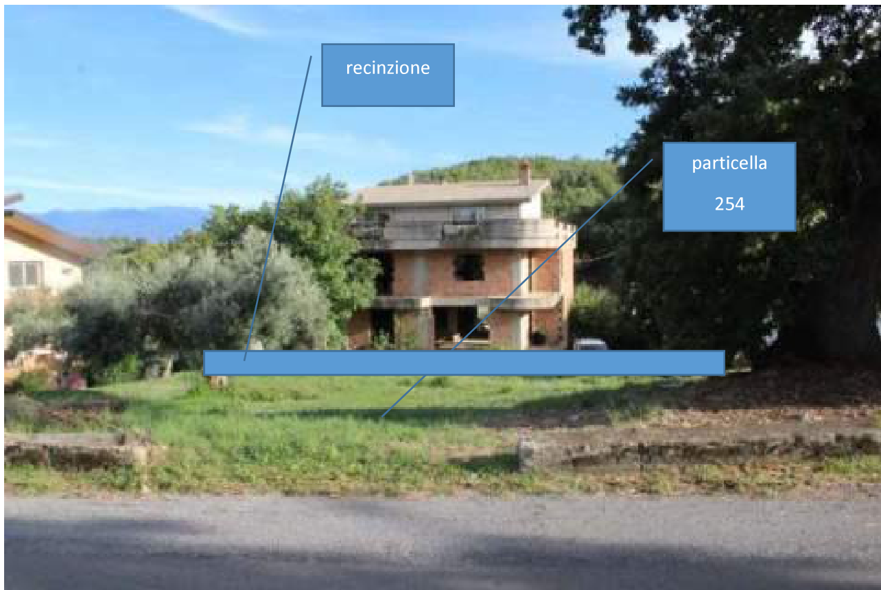
vista dalla strada comunale