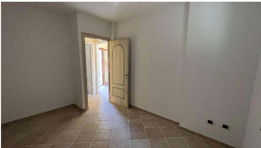
Figura 4 – Viste del subalterno 51