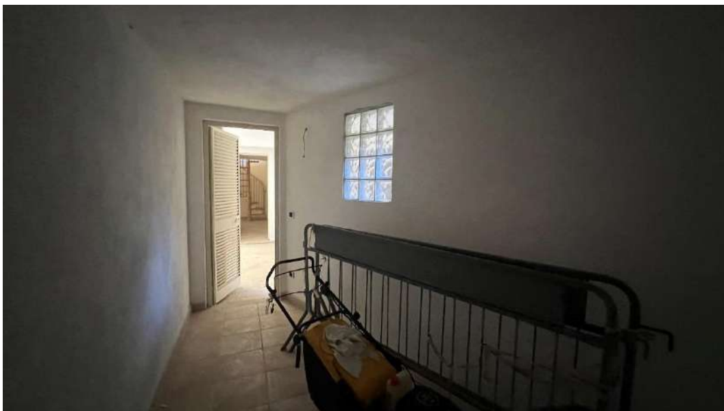
Figura 6 – Viste del subalterno 5