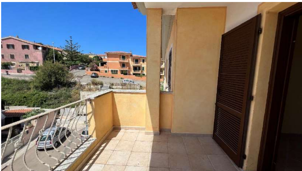
Figura 3 – Viste del subalterno 51