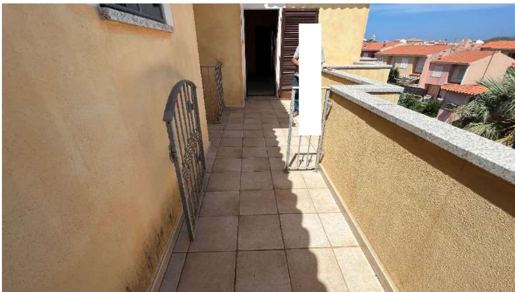
Figura 1 – Viste del subalterno 51