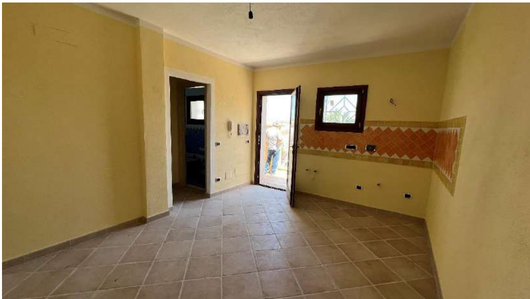
Figura 2 – Viste del subalterno 51