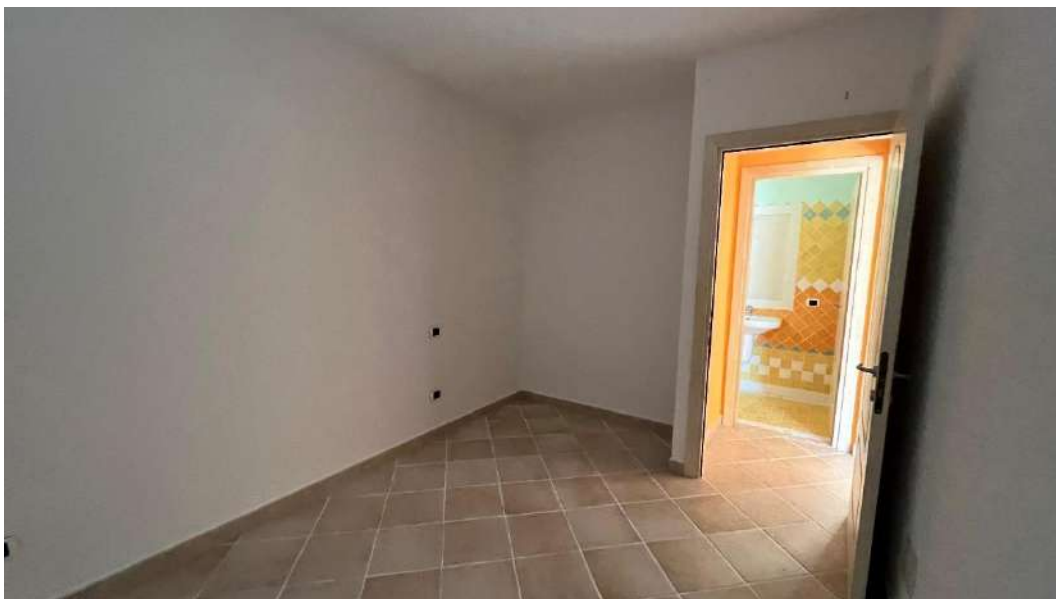
Figura 4 – Viste del subalterno 47