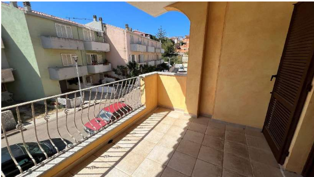
Figura 3 – Viste del subalterno 47