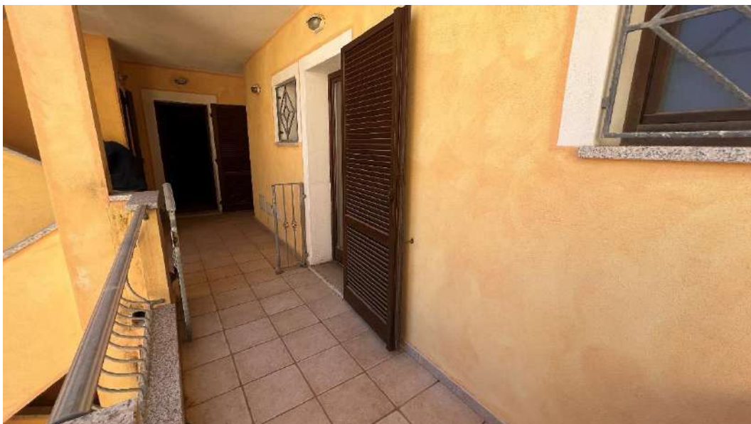
Figura 1 – Viste del subalterno 47