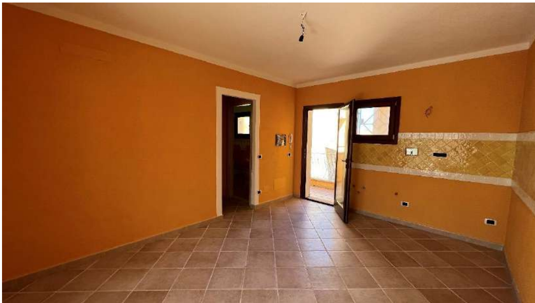
Figura 2 – Viste del subalterno 47