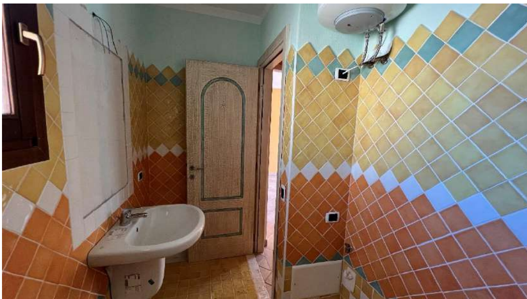
Figura 5 – Viste del subalterno 47