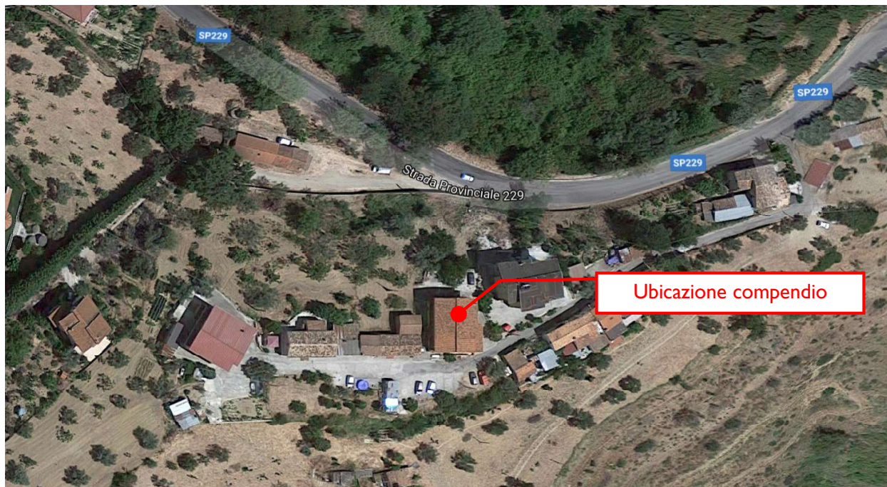
Immagine 1 - Ortofoto tratta da Google Maps con indicazione del compendio