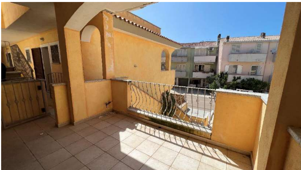
Figura 1 – Viste del subalterno 45