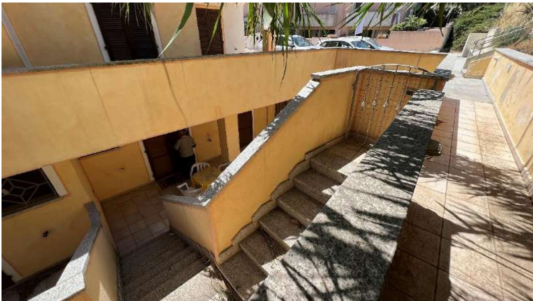
Figura 7 – Viste del subalterno 63