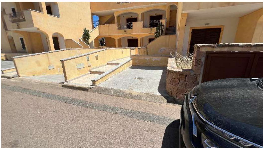
Figura 6 – Viste del subalterno 31