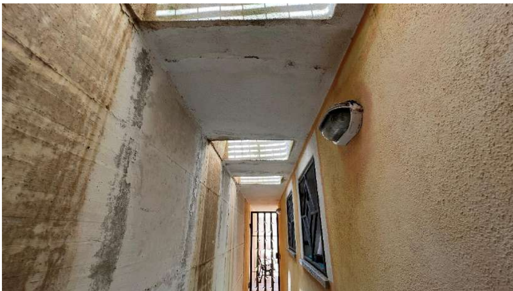
Figura 12 – Viste del subalterno 63