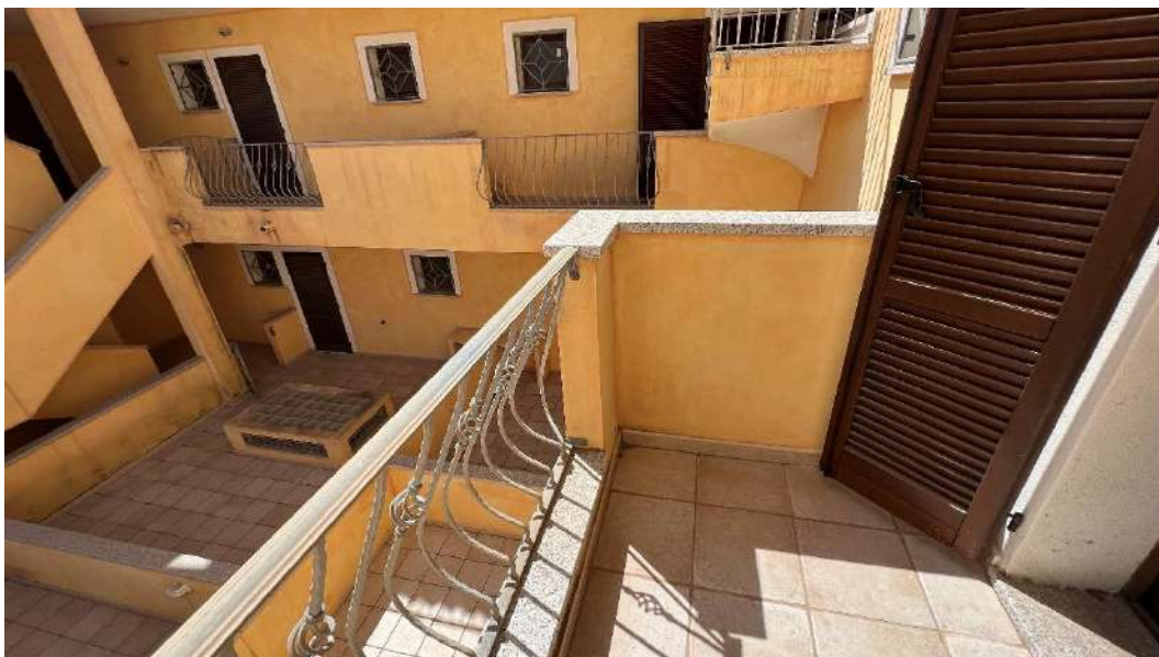
Figura 4 – Viste del subalterno 45