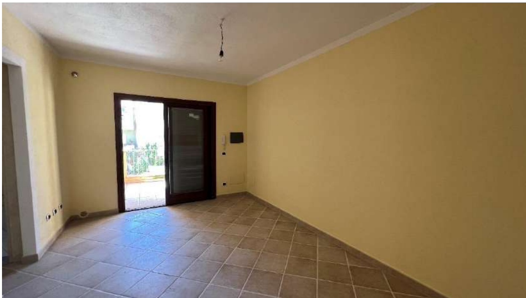
Figura 2 – Viste del subalterno 45