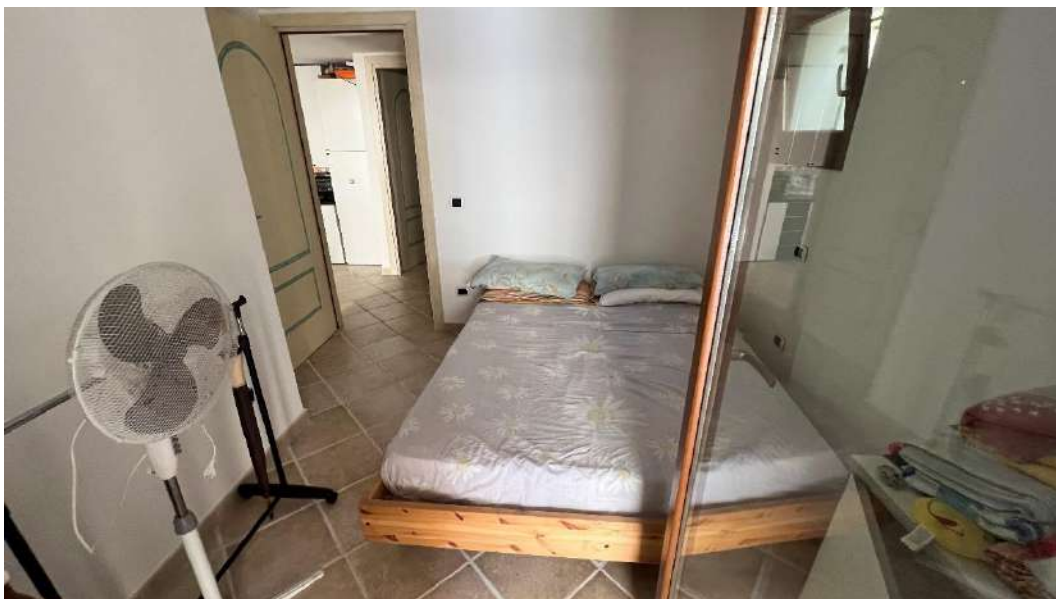
Figura 10 – Viste del subalterno 63