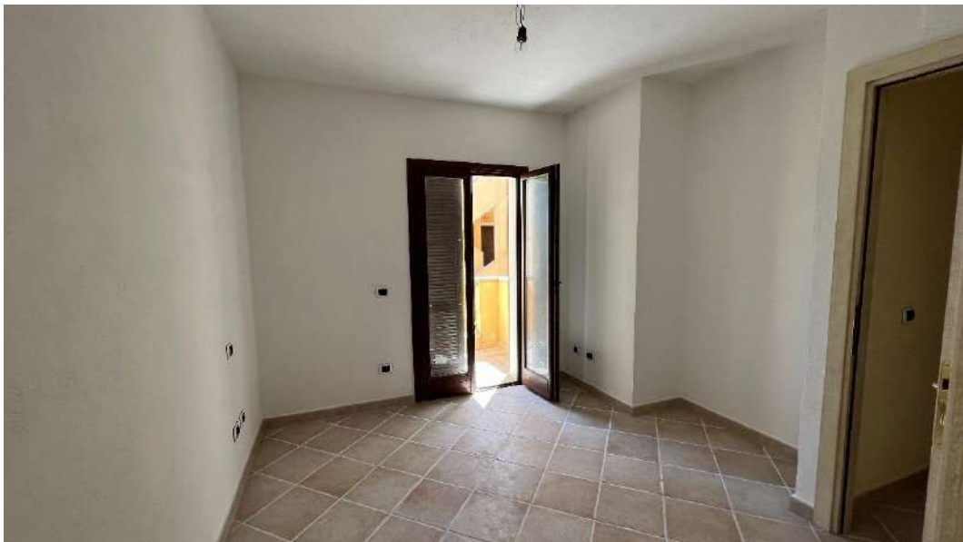
Figura 3 – Viste del subalterno 45