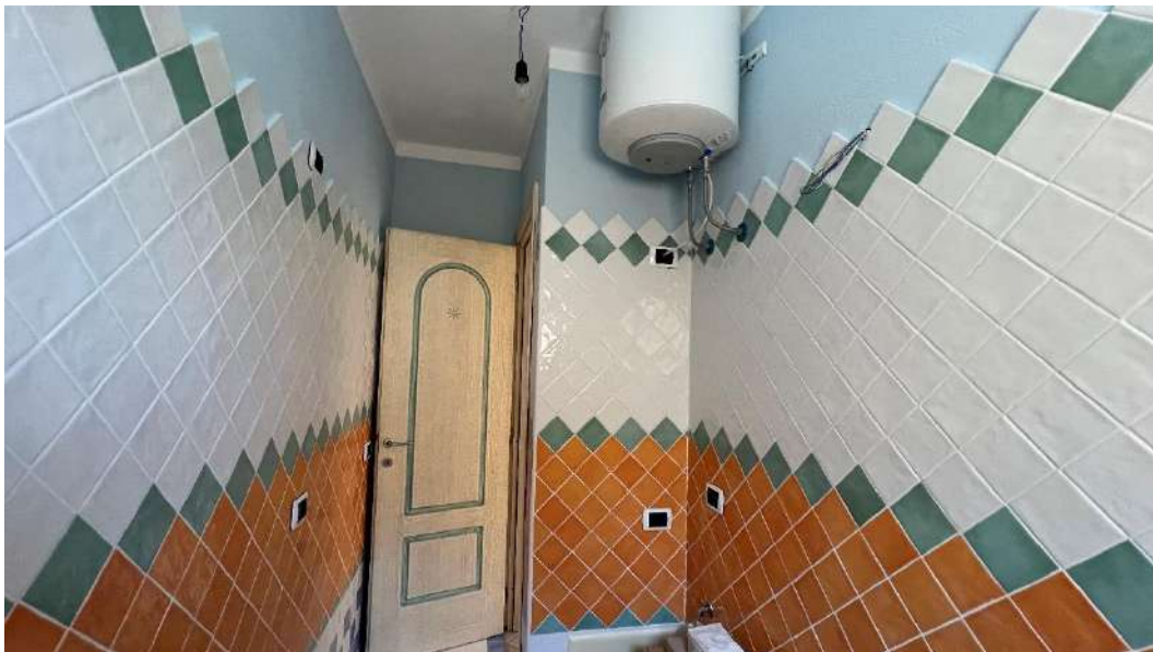
Figura 5 – Viste del subalterno 45