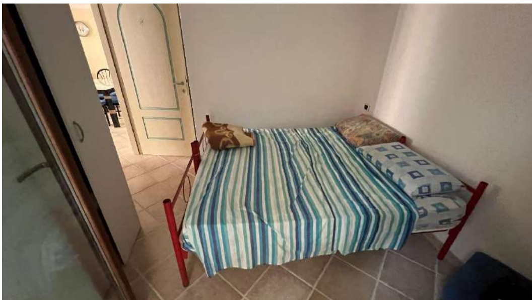
Figura 11 – Viste del subalterno 63