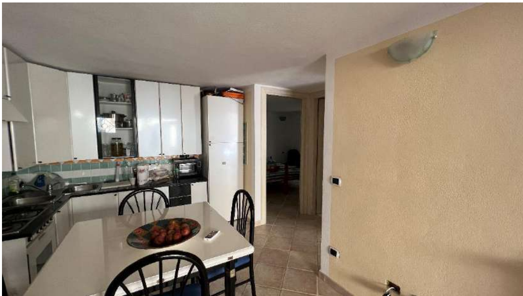
Figura 9 – Viste del subalterno 63