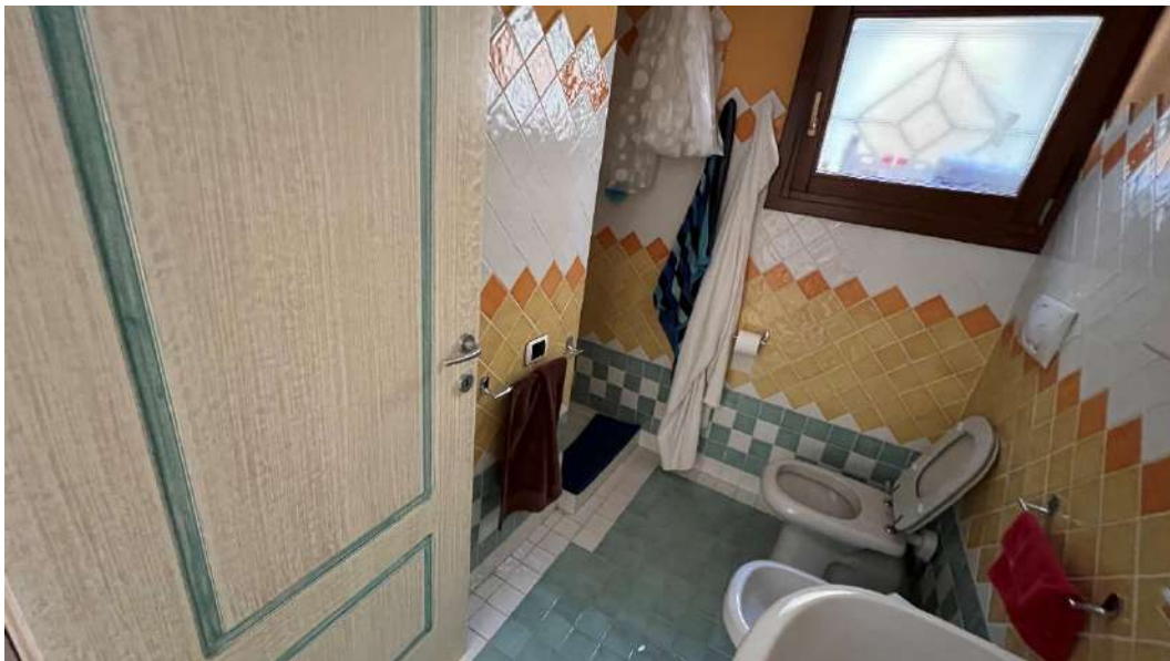
Figura 13 – Viste del subalterno 63