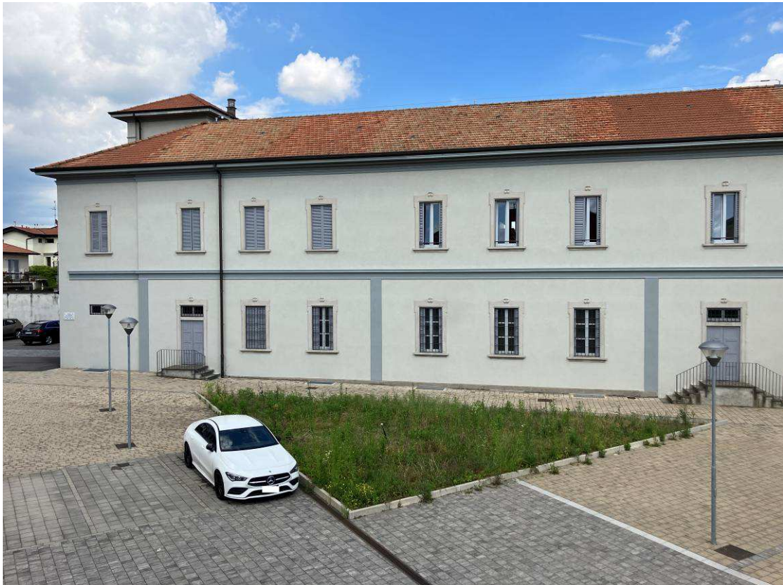
Vista ente comune (cortile interno)