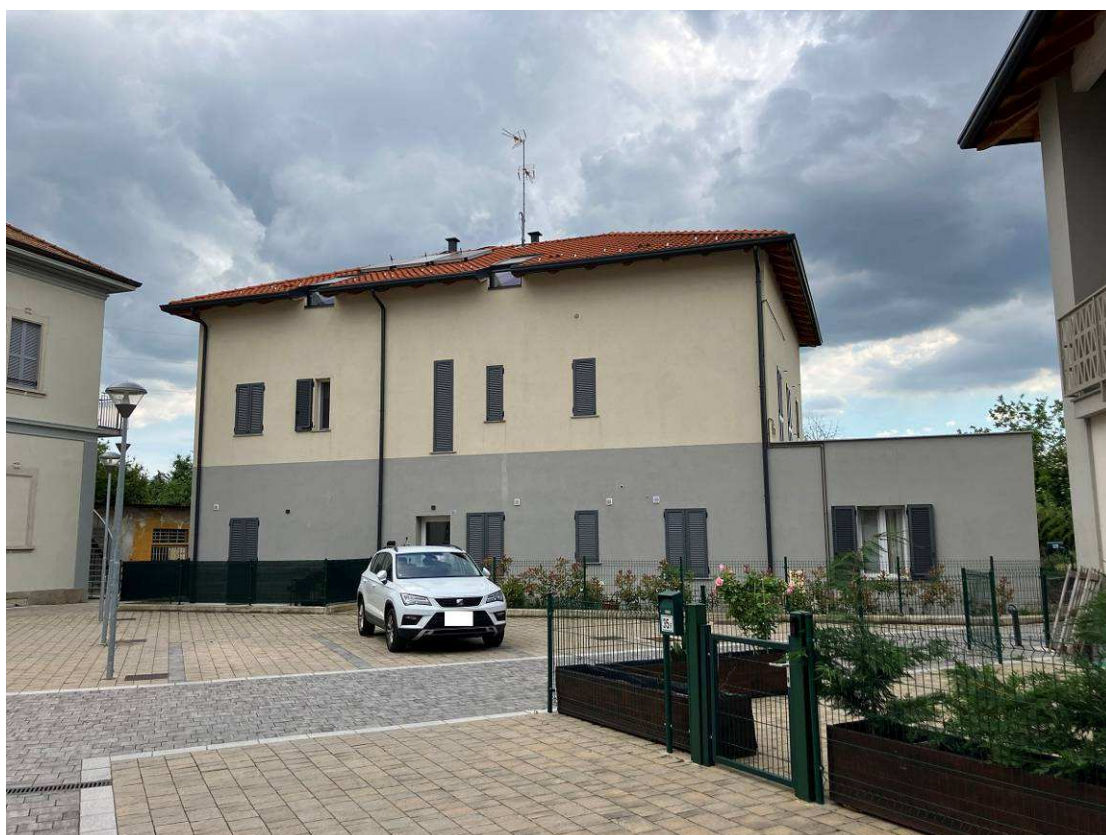
Vista MAPPALE 66