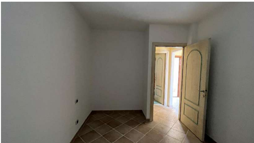
Figura 4 – Viste del subalterno 43