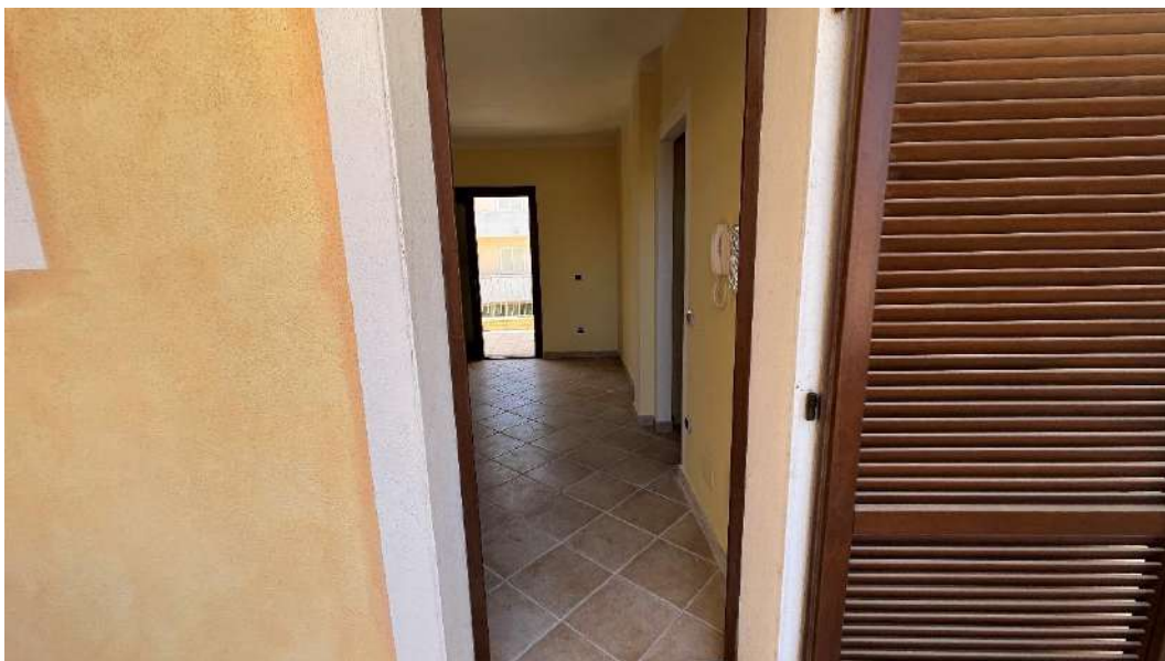
Figura 1 – Viste del subalterno 43