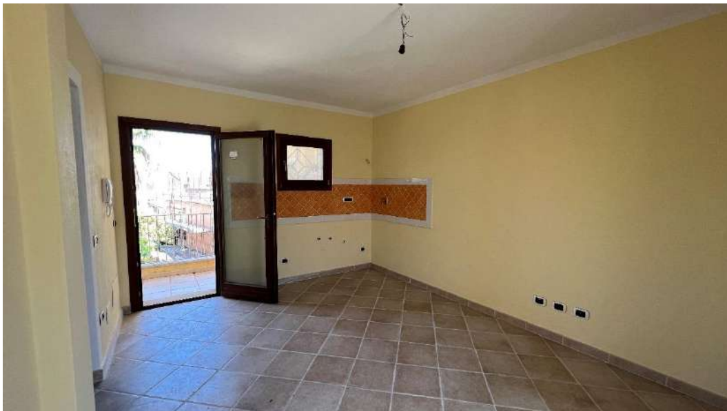
Figura 2 – Viste del subalterno 43