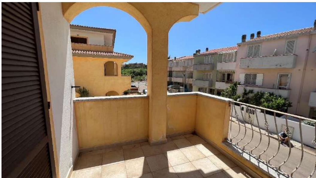
Figura 3 – Viste del subalterno 43