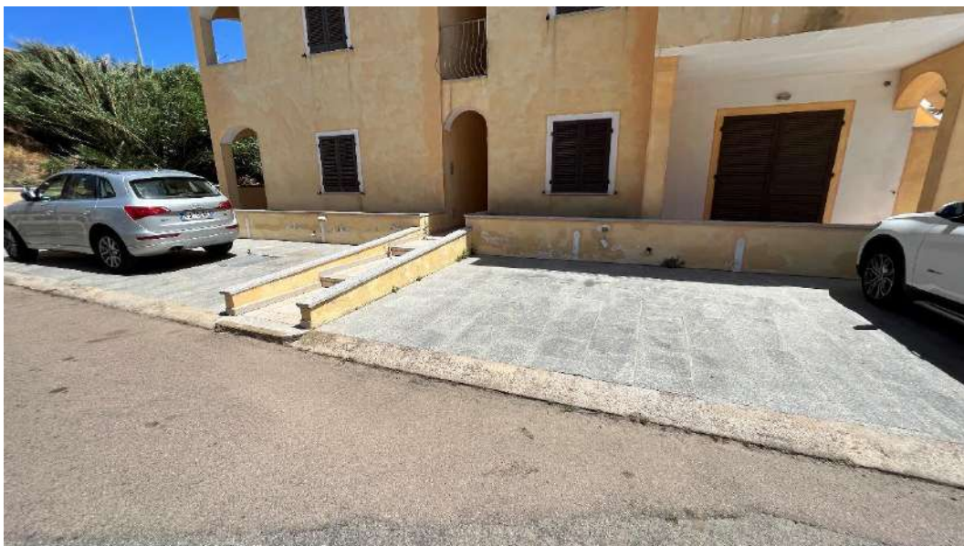
Figura 6 – Viste del subalterno 27