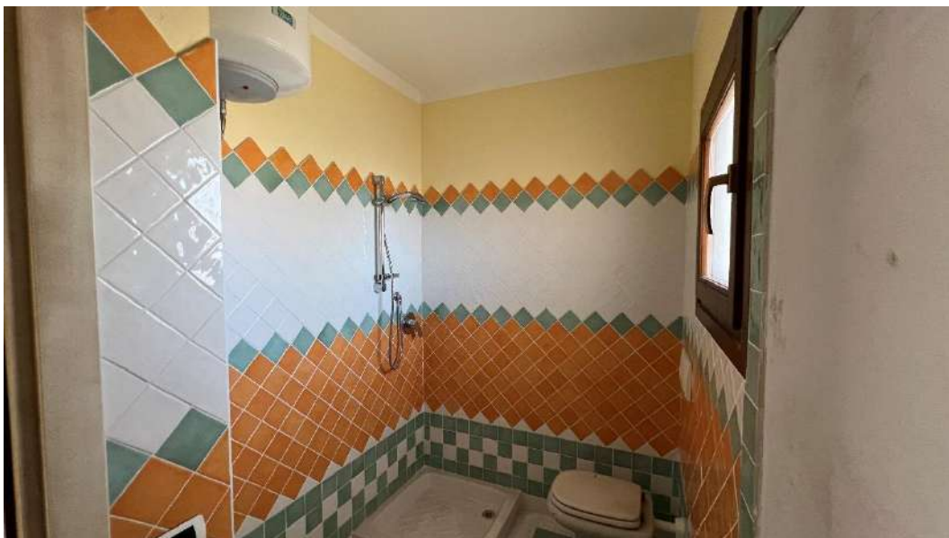
Figura 5 – Viste del subalterno 43