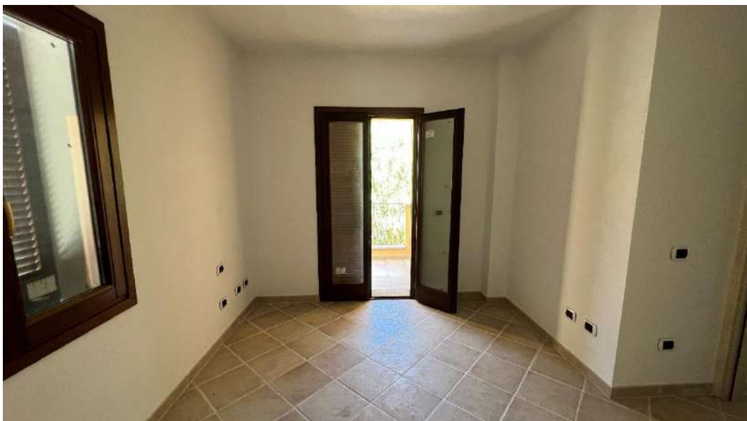
Figura 6 – Viste del subalterno 42