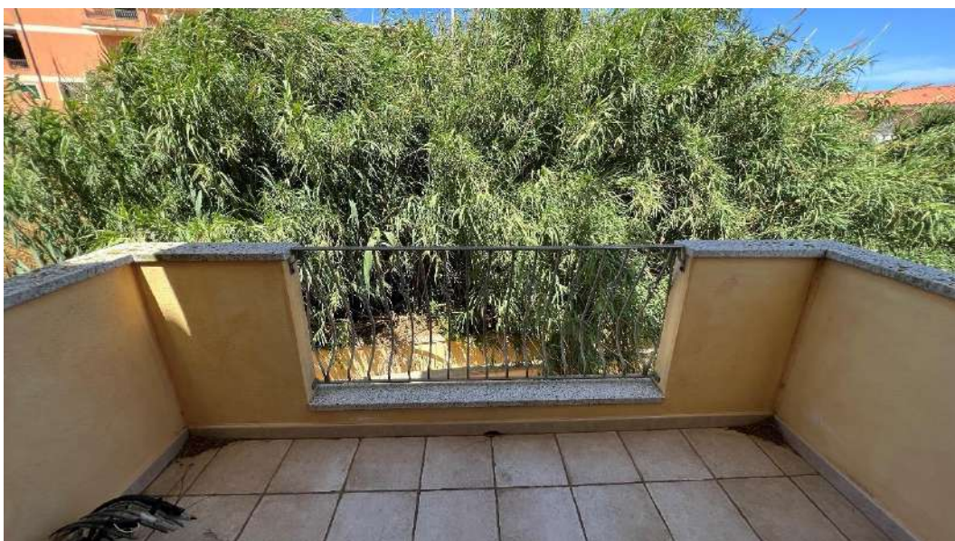
Figura 4 – Viste del subalterno 42