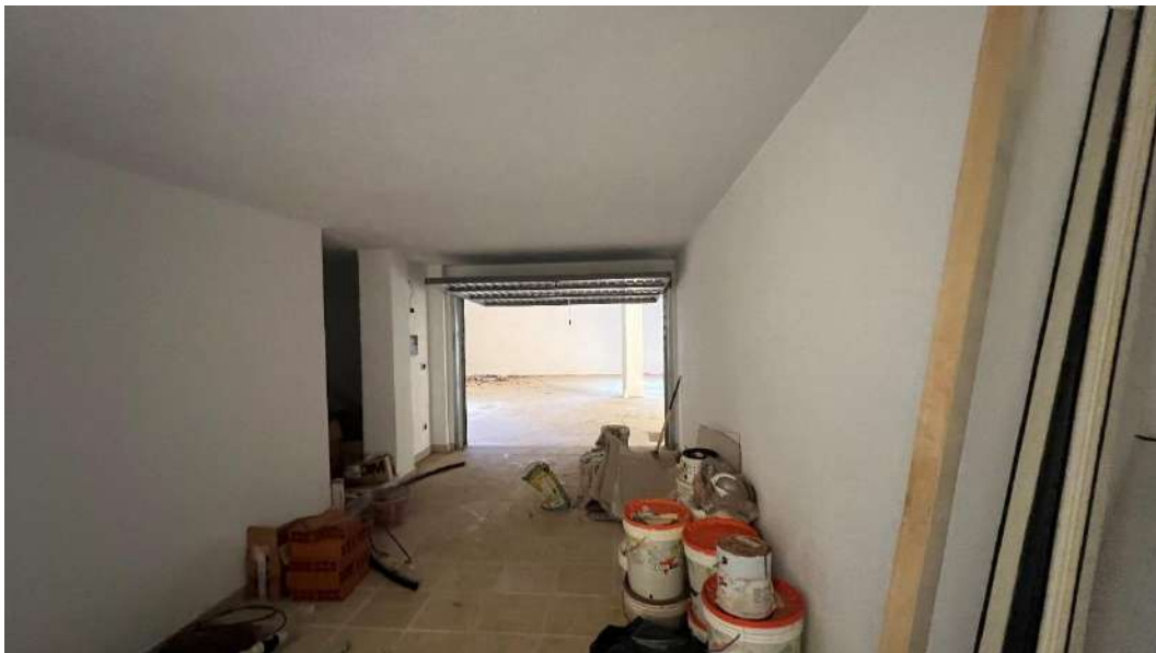
Figura 11 – Viste del subalterno 15