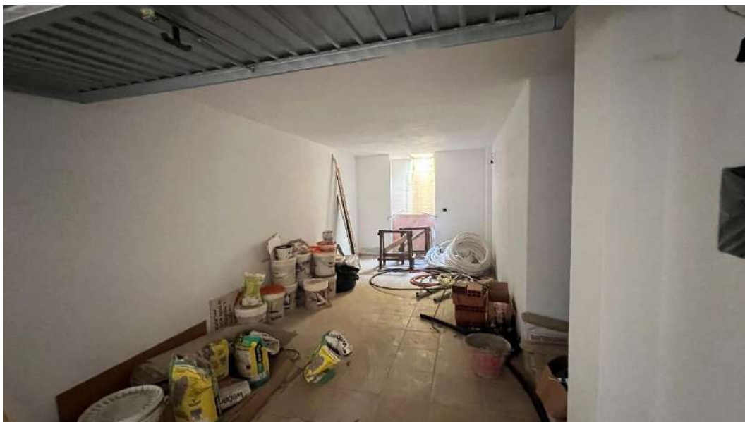
Figura 9 – Viste del subalterno 15