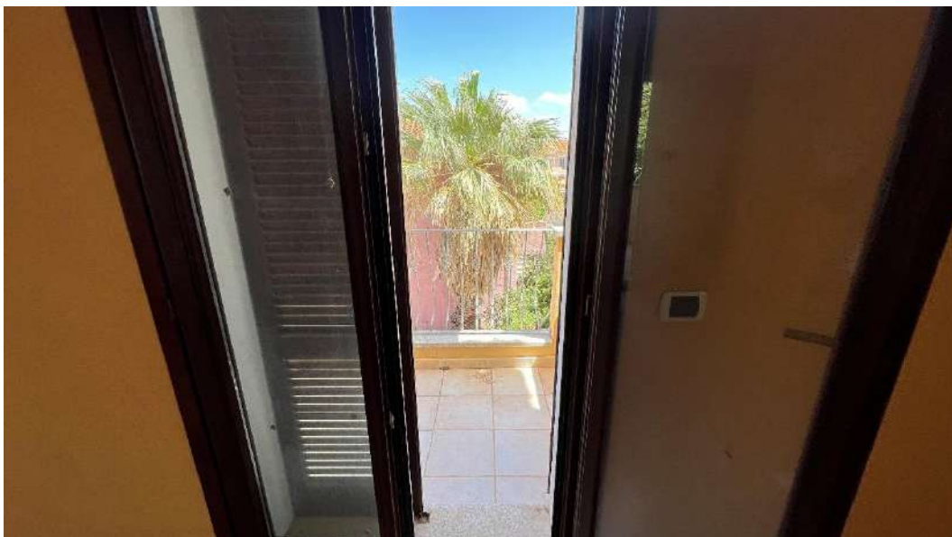
Figura 2 – Viste del subalterno 42