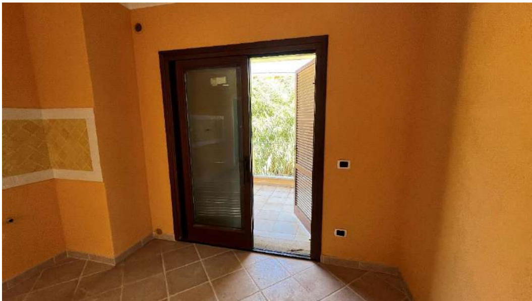
Figura 3 – Viste del subalterno 42