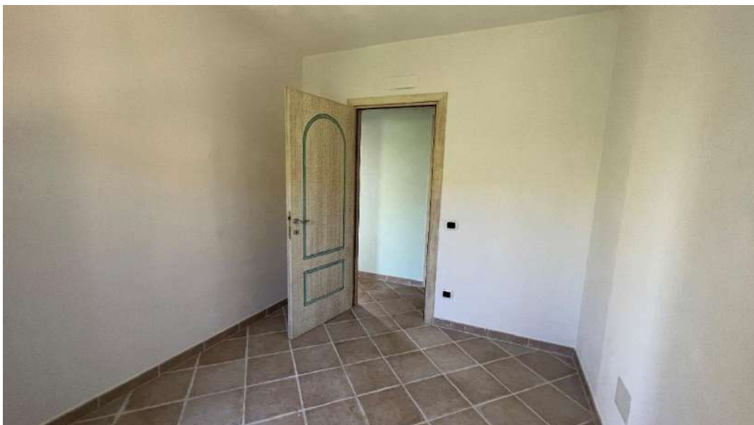
Figura 5 – Viste del subalterno 42