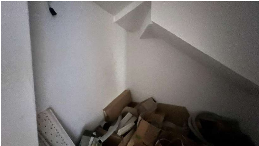
Figura 10 – Viste del subalterno 15