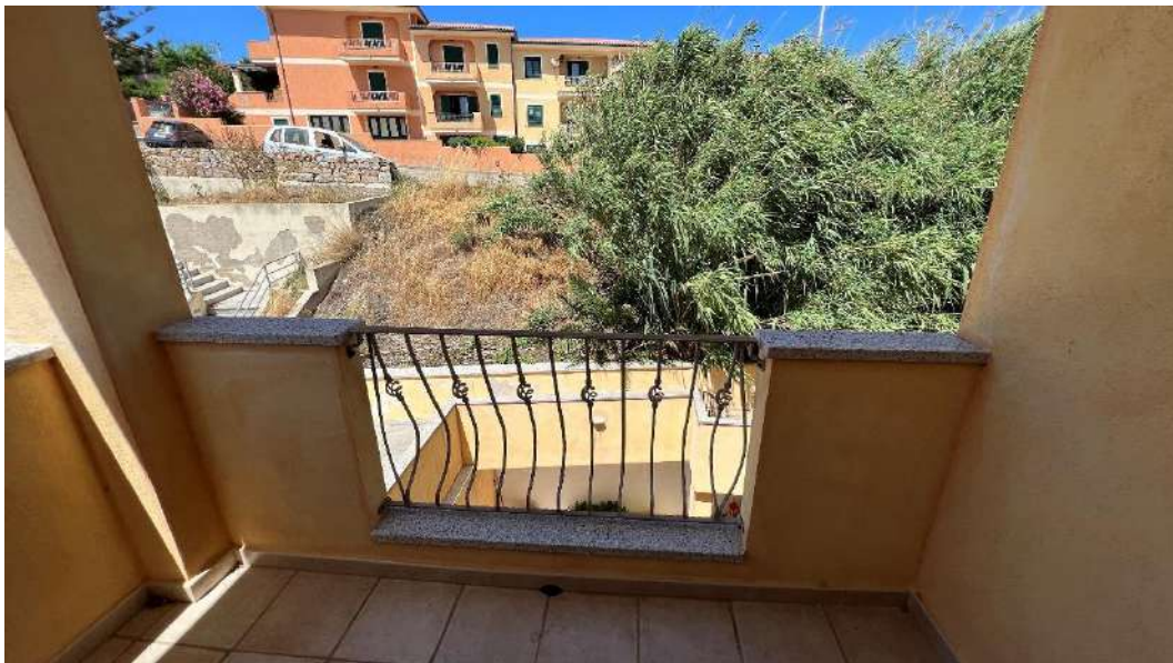
Figura 7 – Viste del subalterno 42