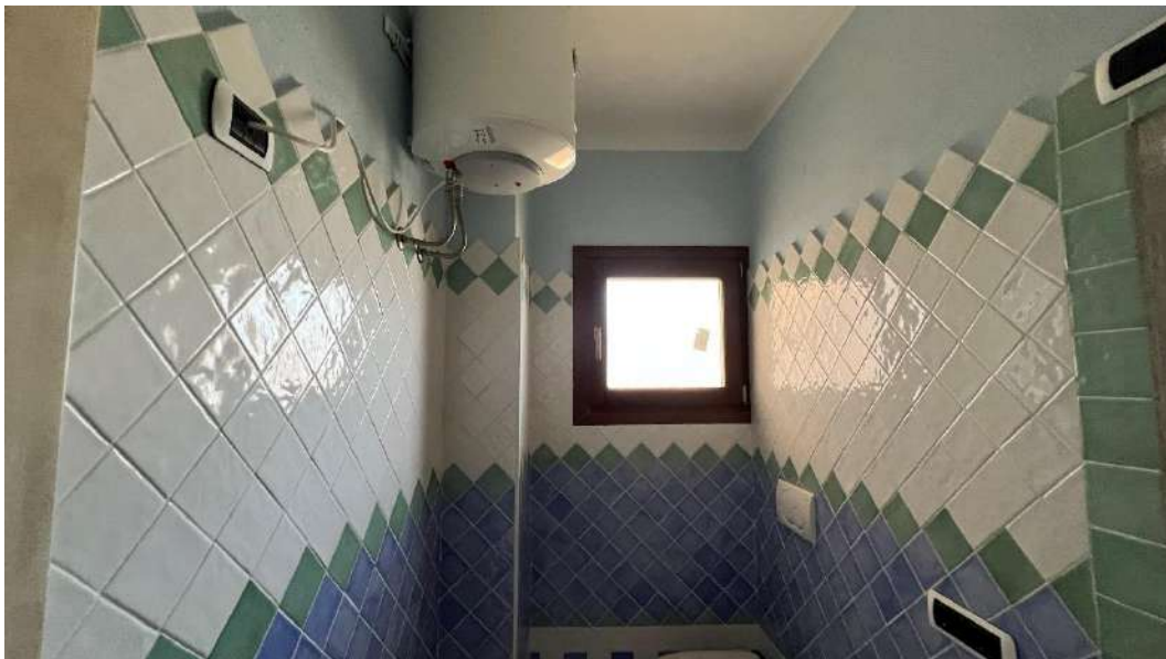
Figura 8 – Viste del subalterno 42