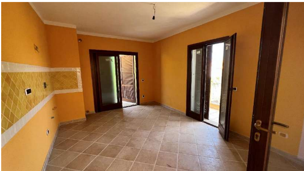
Figura 1 – Viste del subalterno 42