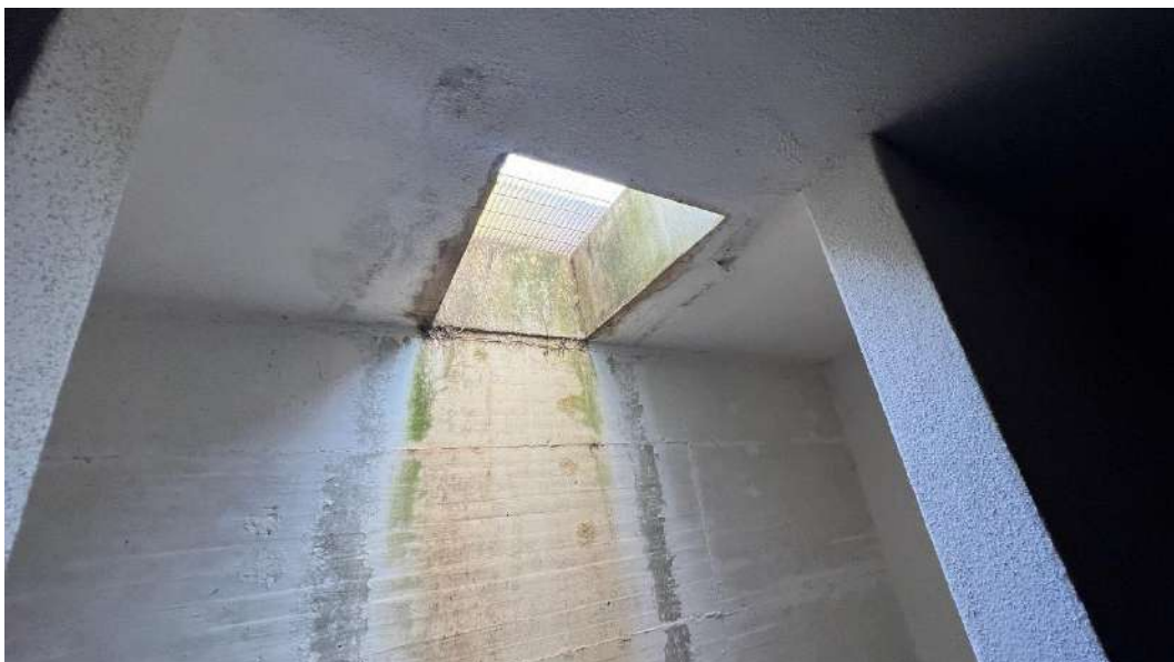
Figura 12 – Viste del subalterno 15