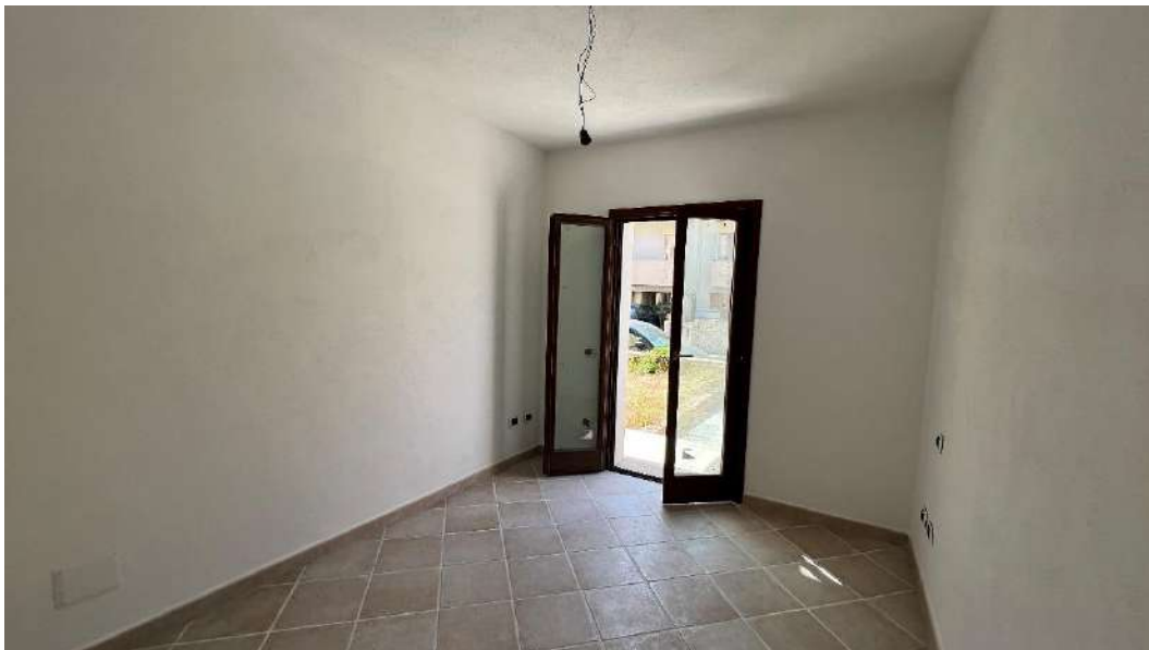
Figura 2 – Viste del subalterno 18