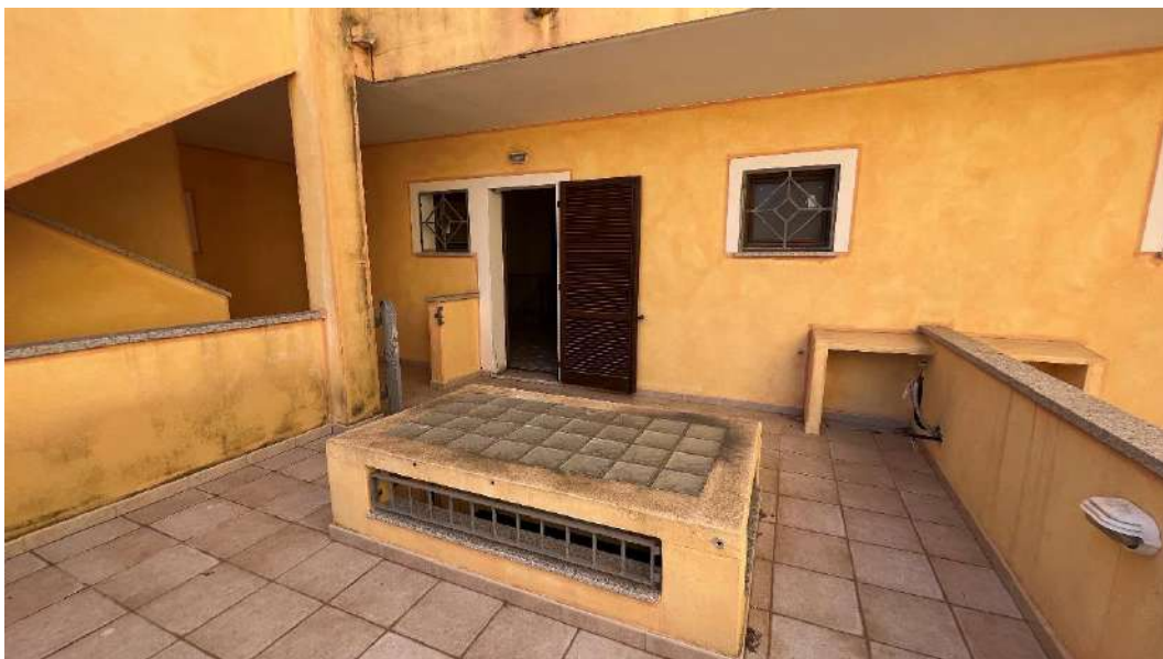
Figura 4 – Viste del subalterno 18