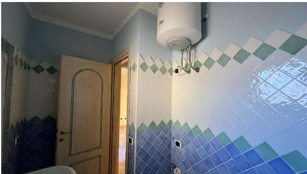
Figura 5 – Viste del subalterno 18