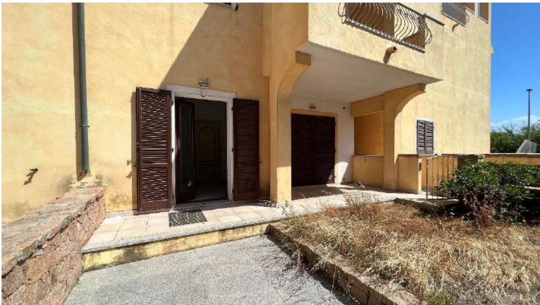
Figura 1 – Viste del subalterno 18