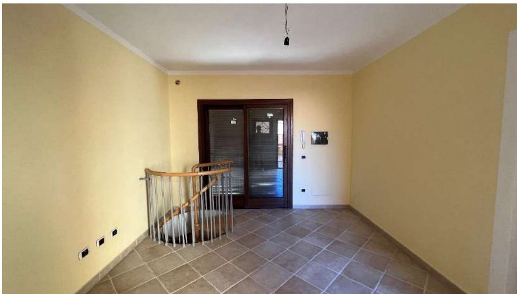
Figura 3 – Viste del subalterno 18