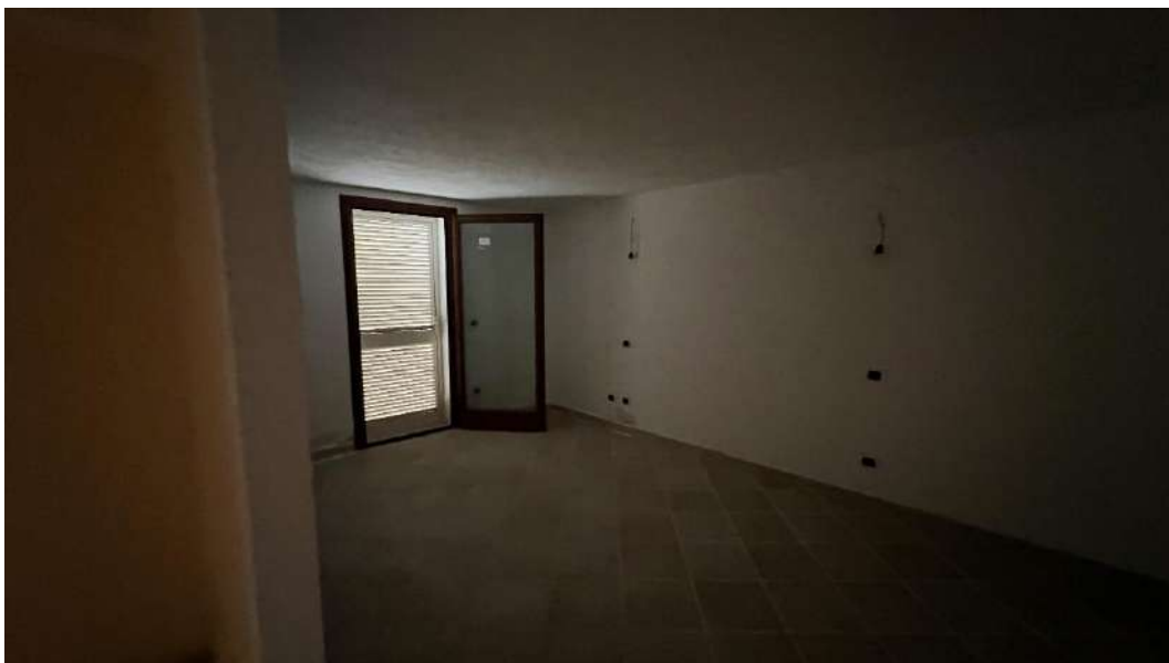
Figura 7 – Viste del subalterno 18