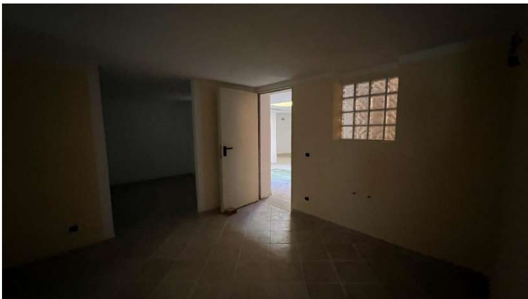
Figura 6 – Viste del subalterno 18