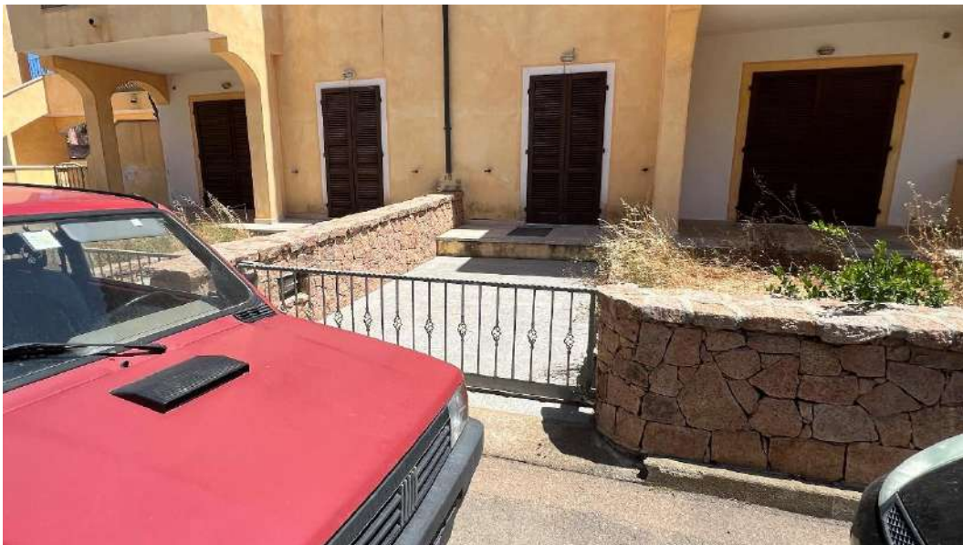
Figura 10 – Viste del subalterno 33