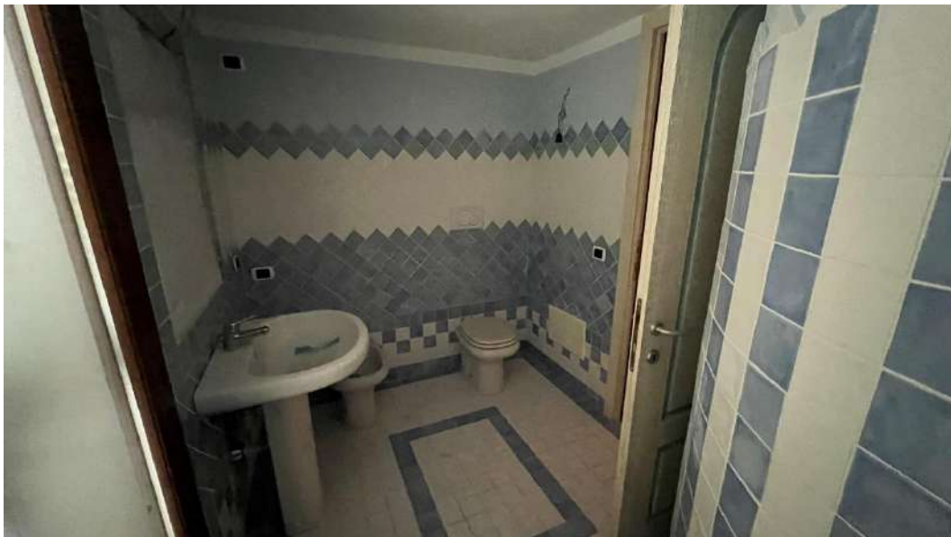
Figura 9 – Viste del subalterno 18