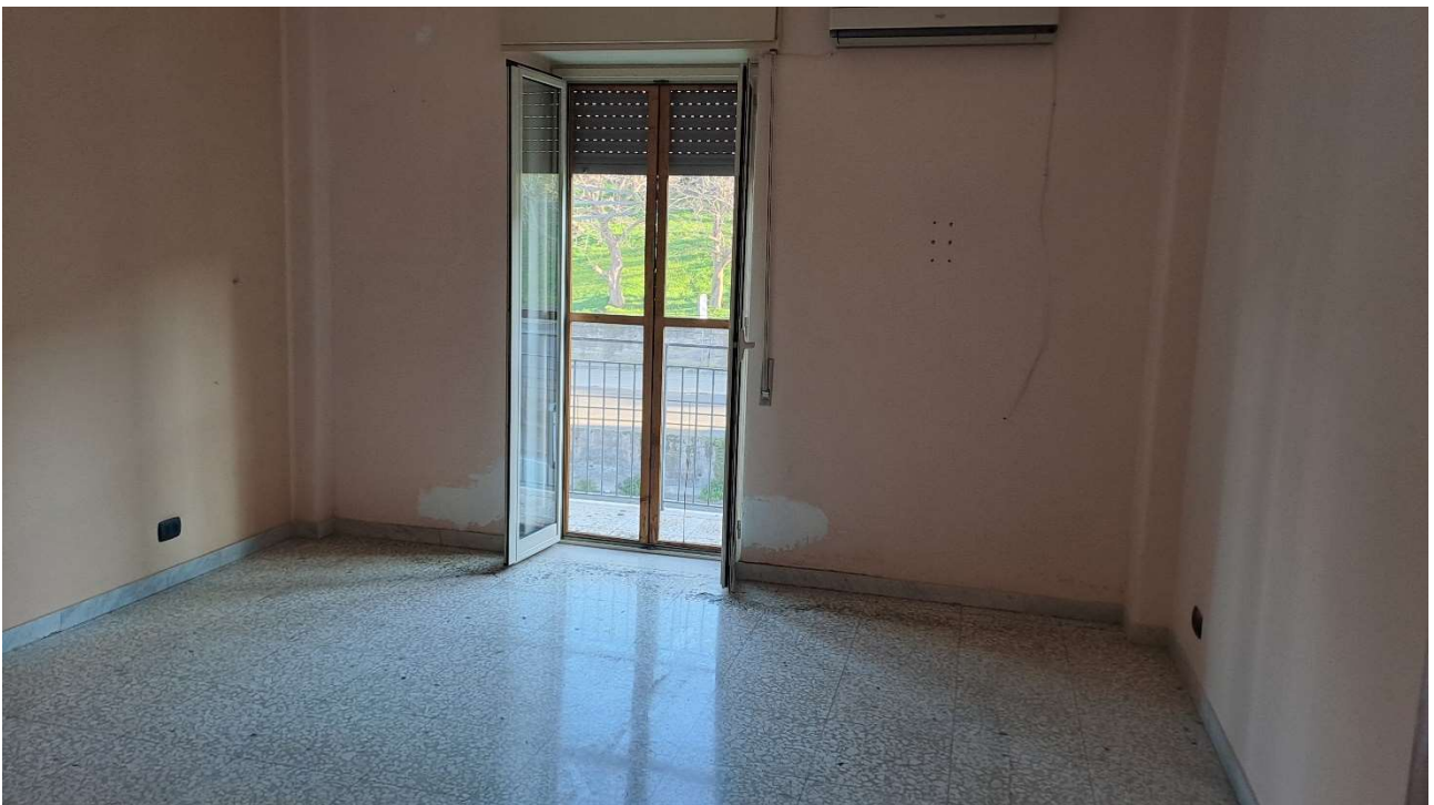
LOTTO 1 FO-L1-9 VANO LETTO LATO SUD