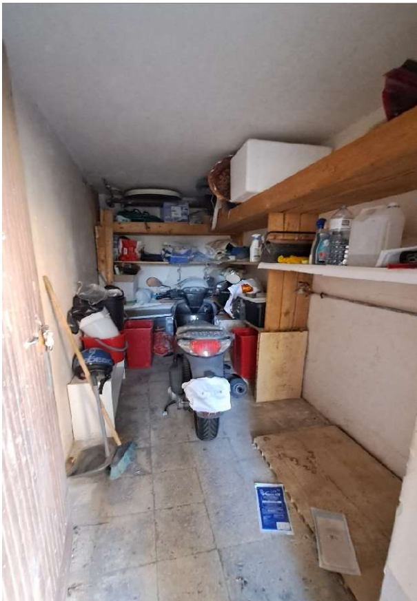
LOTTO 2 FO-L2-2 INTERNO CANTINA