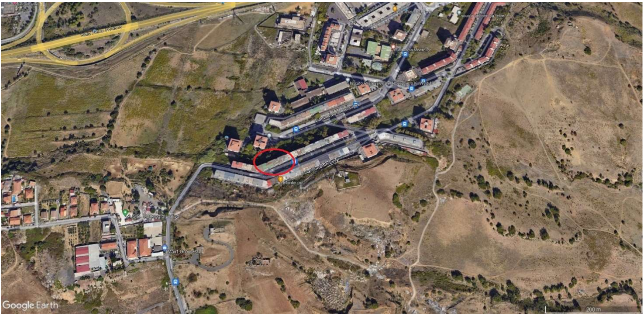
EMPIRICA RAPPRESENTAZIONE DEL COMPENDIO OGGETTO DI STIMA, SUL FOTOGRAMMA AEREO TRATTO DAL PORTALE GRATUITO GOOGLE EARTH