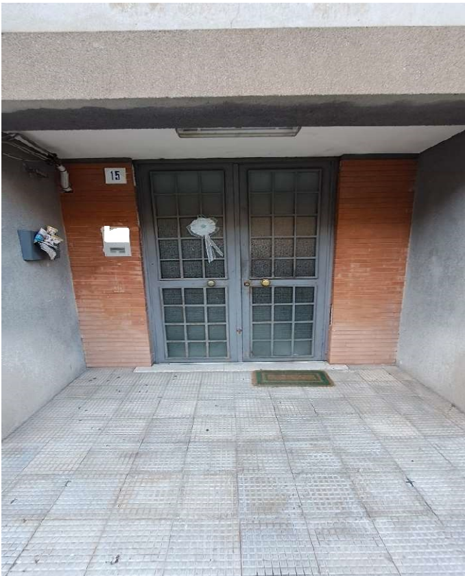
LOTTO 1 FO-L1-1-INGRESSO DAL CIVICO 15