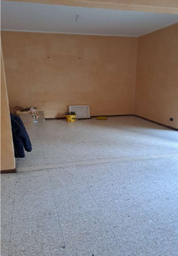
LOTTO 1 FO-L1-6 VANO SALONE "DOPPIO"