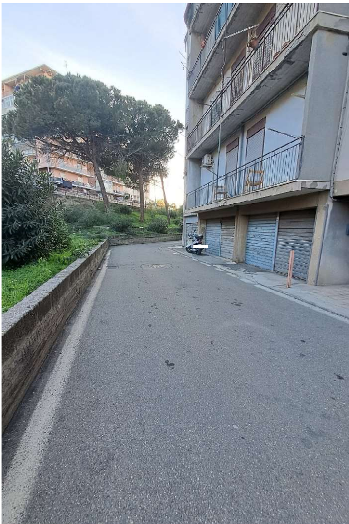
ESTERNO DEL CORPO DI FABBRICA CHE OSPITA GLI IMMOBILI, LATO SUD