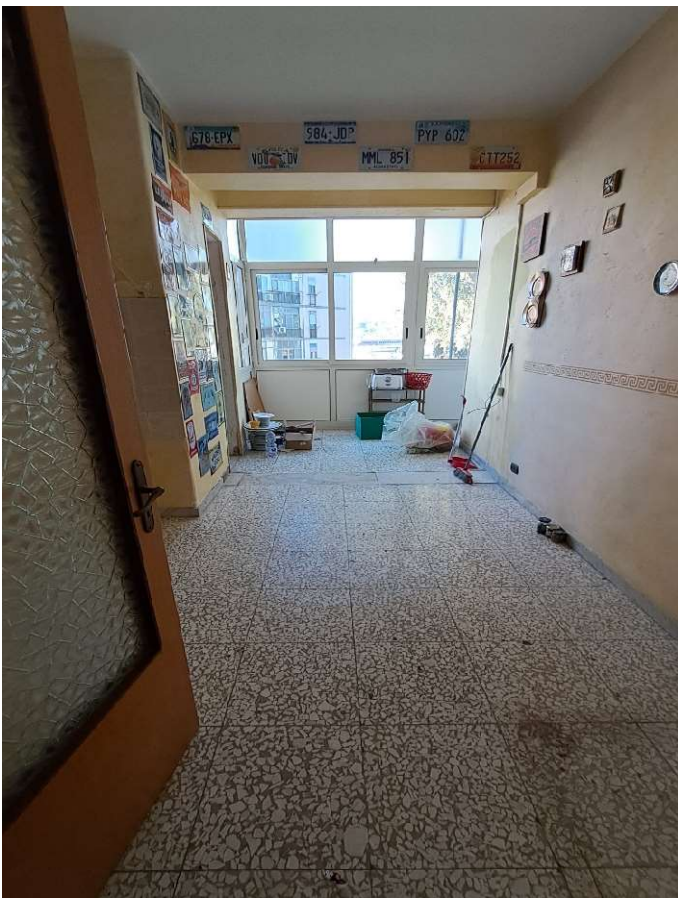
LOTTO 1 FO-L1-15 LOCALE CUCINA CON ESPOSIZIONE LATO NORD