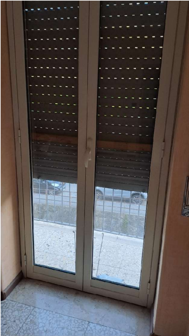
LOTTO 1 FO-L1-8 TIPOLOGIA DI INFISSI ESTERNI