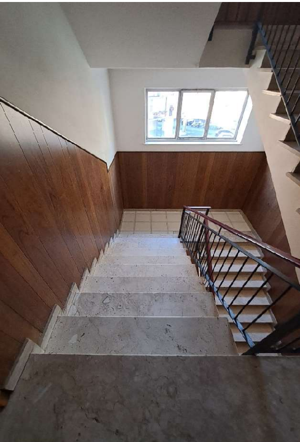
LOTTO 1 FO-L1-3-CORPO DI SCALE CONDOMINIALI