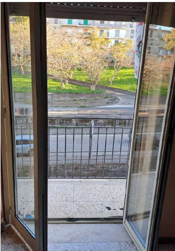
LOTTO 1 FO-L1-7 AFFACCIO LATO STRADA (SUD)