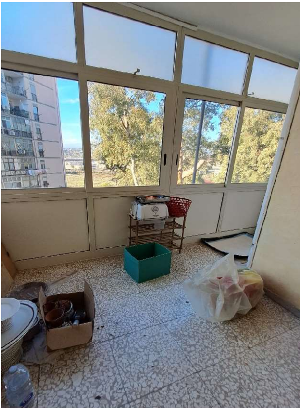
LOTTO 1 FO-L1-16 LOCALE CUCINA, PARTICOLARE VERANDA