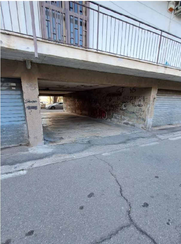
PORZIONE CONDOMINALE CHE PERMETTE L'ACCESSO AL LOTTO 2 (SOTTOPASSO)