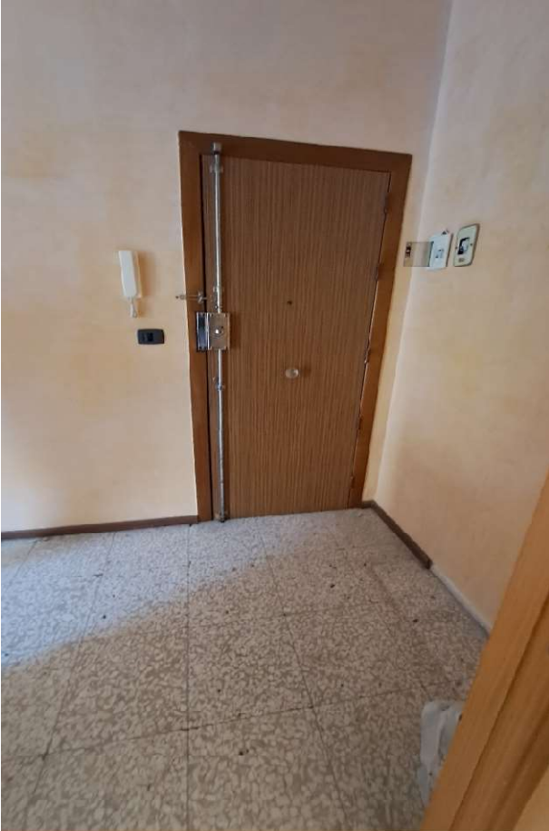
LOTTO 1 FO-L1-4-PORTA DI INGRESSO