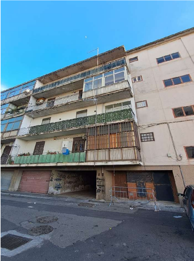
ESTERNO DEL CORPO DI FABBRICA CHE OSPITA GLI IMMOBILI, LATO NORD