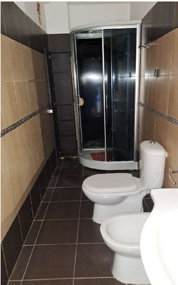
LOTTO 1 FO-L1-13 LOCALE WC