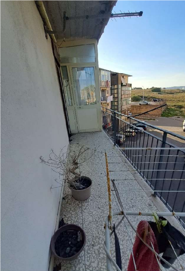
LOTTO 1 FO-L1-18 TERRAZZINO LATO NORD