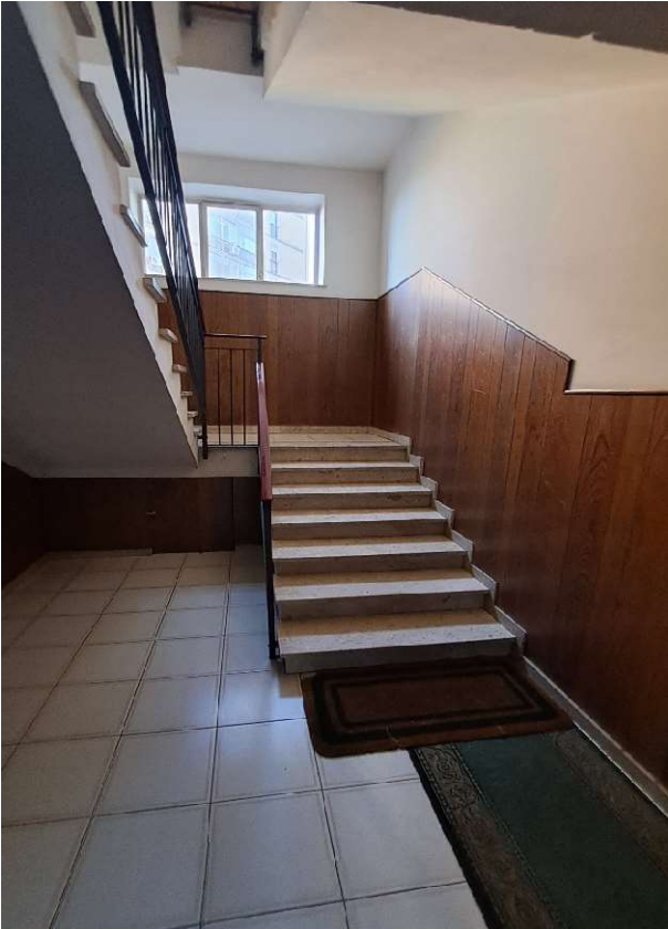
LOTTO 1 FO-L1-2-CORPO DI SCALE CONDOMINIALI