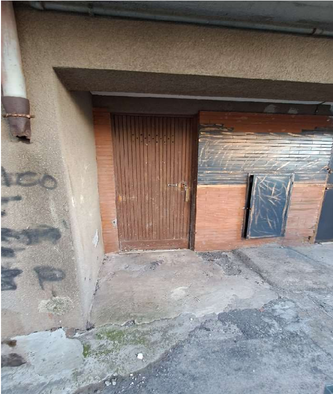
LOTTO 2 FO-L2-1 PORTA DI INGRESSO CANTINA