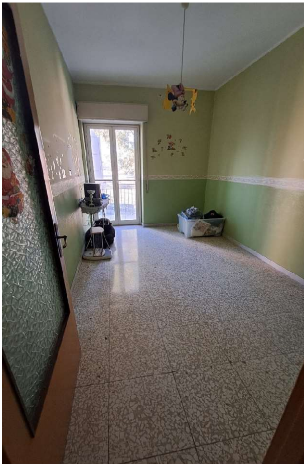
LOTTO 1 FO-L1-11 VANO LETTO LATO NORD