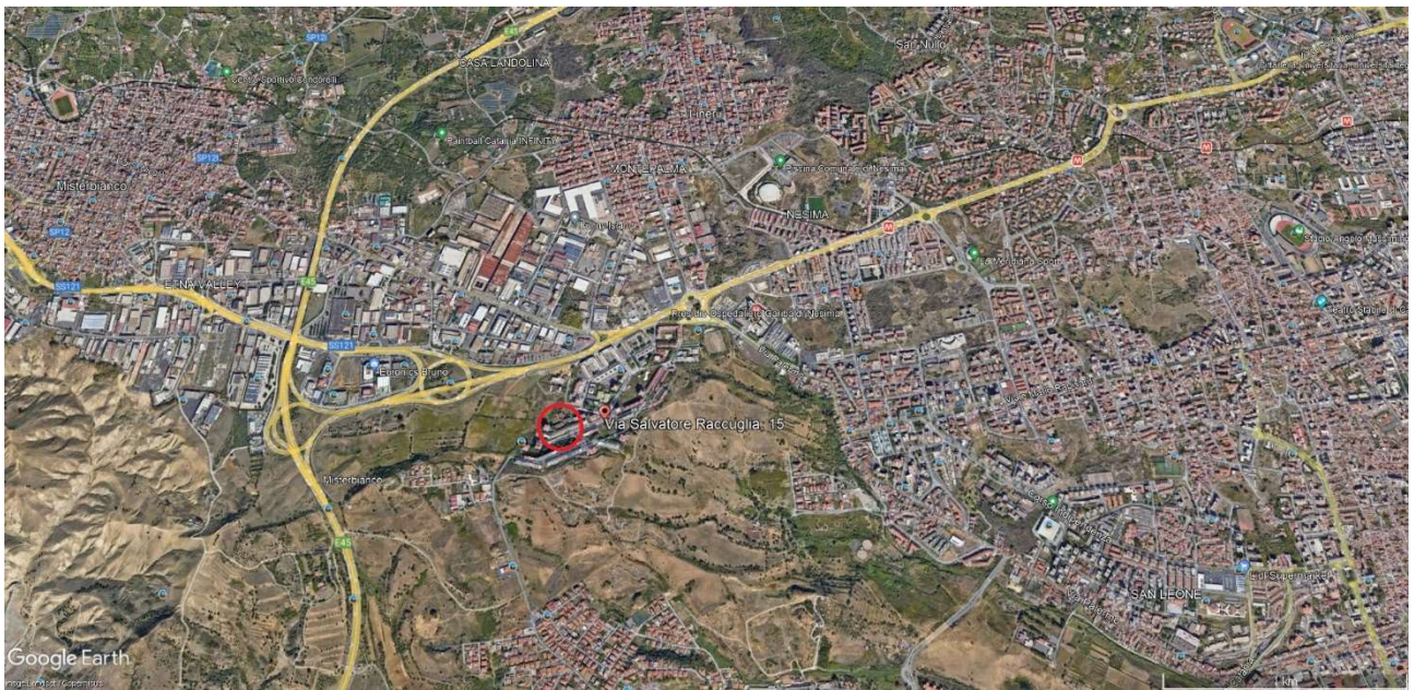
EMPIRICA RAPPRESENTAZIONE DEL COMPENDIO OGGETTO DI STIMA, SUL FOTOGRAMMA AEREO TRATTO DAL PORTALE GRATUITO GOOGLE EARTH