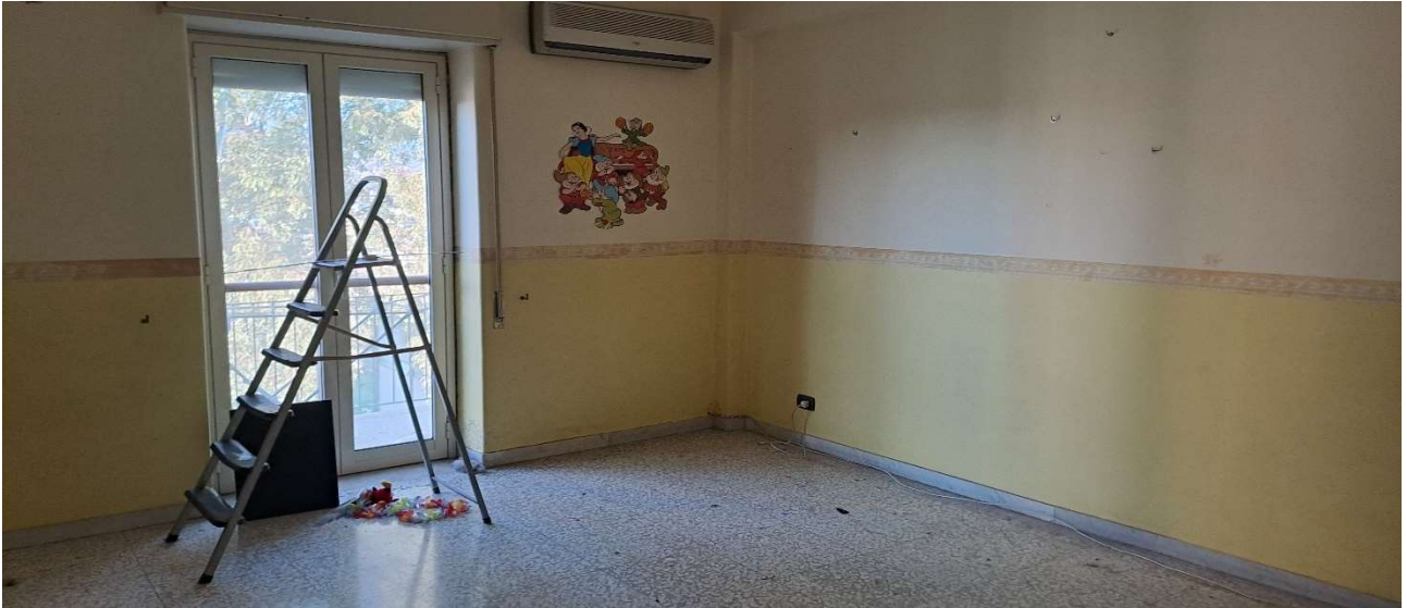
LOTTO 1 FO-L1-12 VANO LETTO LATO NORD