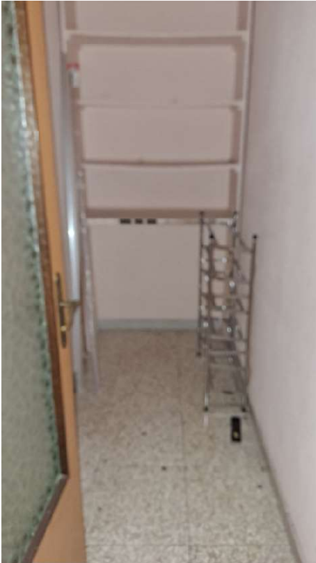
LOTTO 1 FO-L1-14 PICCOLO RIPOSTIGLIO CORRIDOIO