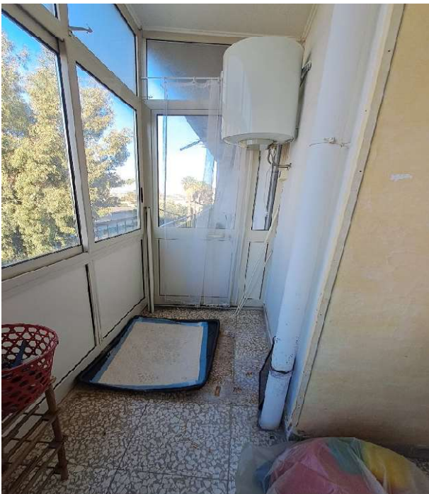
LOTTO 1 FO-L1-17 LOCALE CUCINA, PARTICOLARE VERANDA