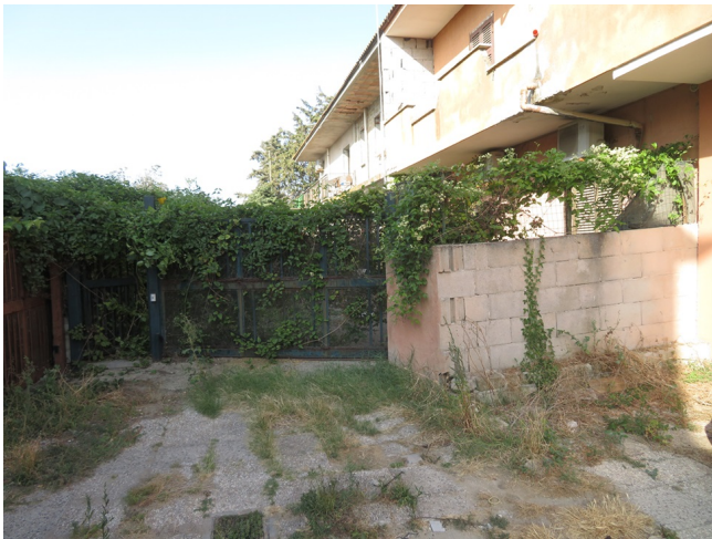
Foto n. 9_Esterna