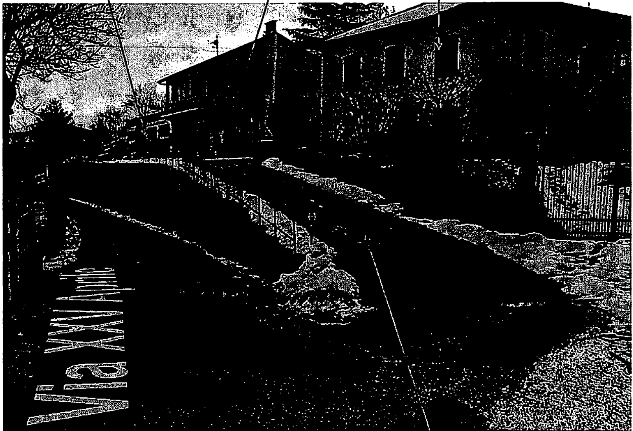
parte del mapp. 333 gravato da servitù di passaggio

1. Quota e tipologia del diritto 1/1 di Piena proprietà