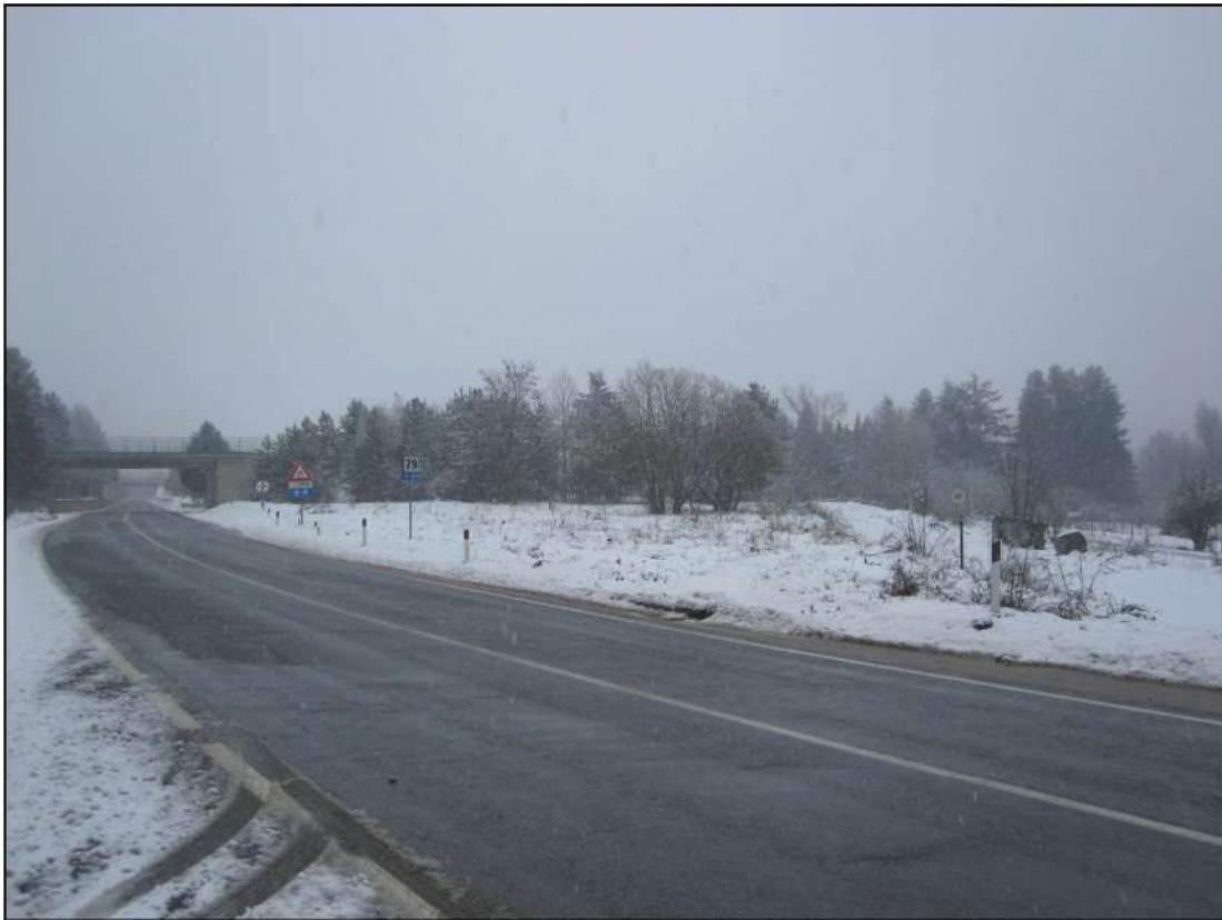
Foto 1: Vista lungo la SS 107 Silana- Crotonese in prossimità della località San Bernardo direzione San Giovanni in Fiore. La costante presenza di neve a causa delle ripetute nevicate protrattesi fino ad aprile 2012 hanno reso i terreni in oggetto non raggiungibili per un lungo periodo di tempo.