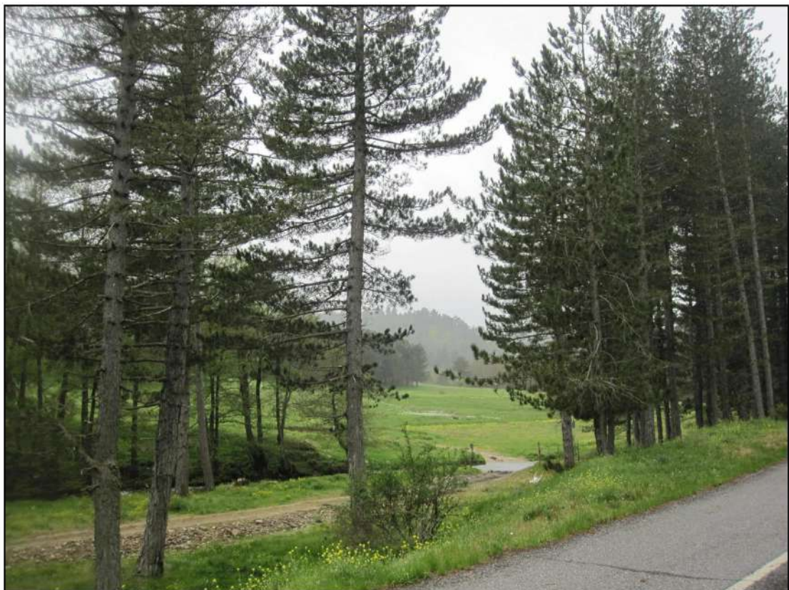
Foto 6: La strada sterrata, che attraversa il fiume Neto, si diparte dalla strada asfaltata a nord del fiume e attraversa anche i terreni oggetto di pignoramento.