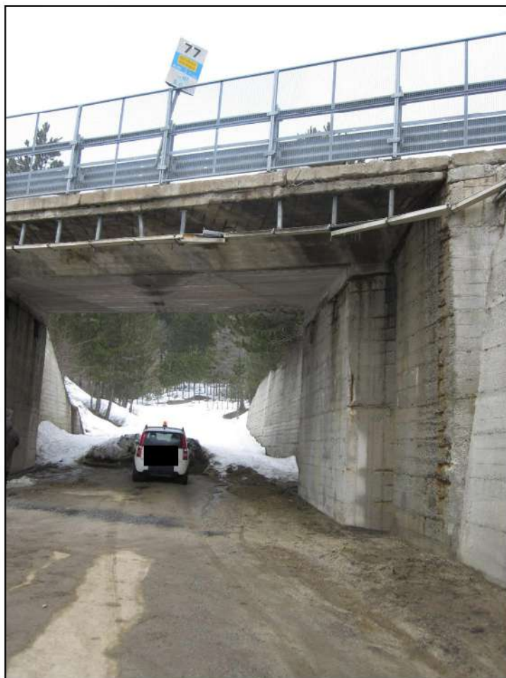
Foto 1: L'accesso ai terreni oggetto di pignoramento non è stato possibile in data 07.03.2012 a causa della presenza di ingenti quantità di neve. Nella foto si denota come la strada, dalla quale si dirama, anche se più all'interno, il sentiero d'accesso da sud ai luoghi, non è transitabile o comunque utilizzabile. Si è in corrispondenza del sottopassaggio 77- Silvana Mansio rispetto al tracciato della SS 107.