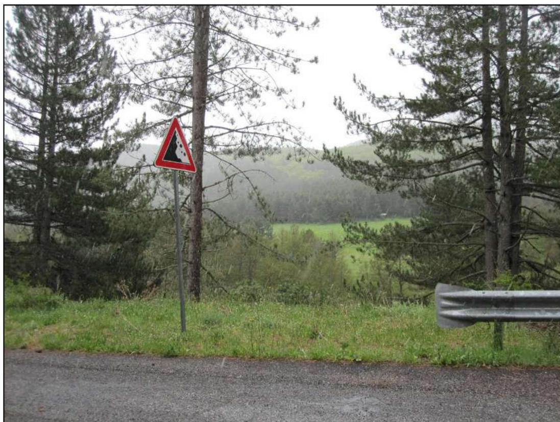
Foto 2: Vista dei luoghi (p.lle ricadenti nel foglio 4) da nord, dalla strada lungo il fiume Neto. Si evidenzia la presenza di un capanno in legno.