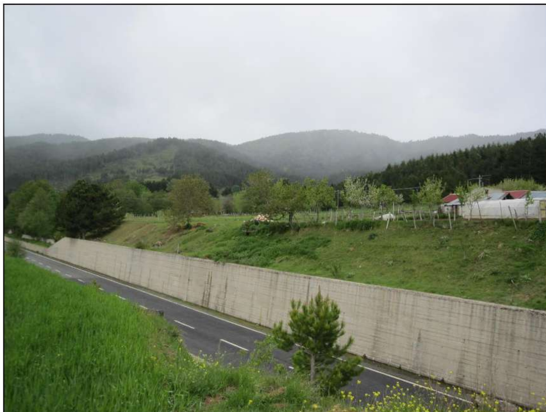
Foto 1: Vista dei luoghi, che si estendono lungo le pendici del Monte Volpintesta ed il località Macchia di Pietro, da un cavalcavia lungo la SS 107 Silana- Crotonese.