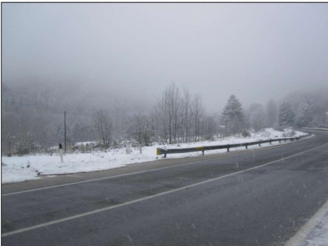
Foto 2: Vista lungo la SS 107 Silana- Crotonese in prossimità della località San Bernardo direzione Camigliatello Silano.