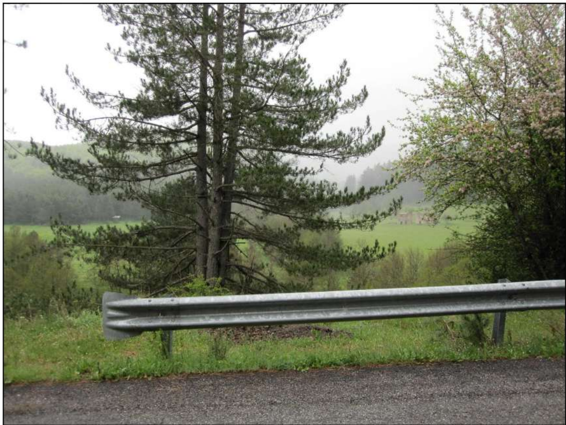
Foto 3: Vista dei luoghi (p.lle ricadenti nel foglio 4) da nord dalla strada lungo il fiume Neto. Si evidenzia la presenza di un capanno in legno a sinistra sui terreni oggetto di pignoramento e di 2 ruderi in muratura su un terreno ricadente nel Comune di Serra Pedace a destra.