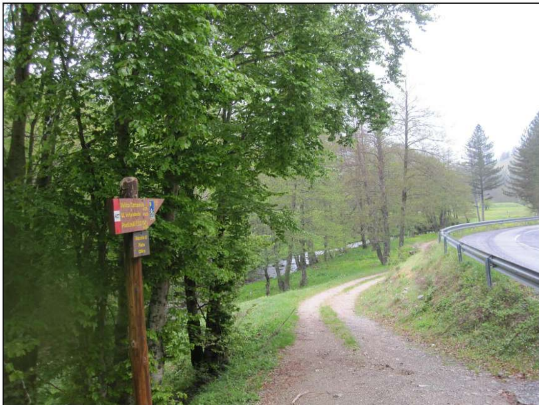
Foto 7: La strada sterrata corrisponde al sentiero n. 18 del Parco Nazionale della Sila.