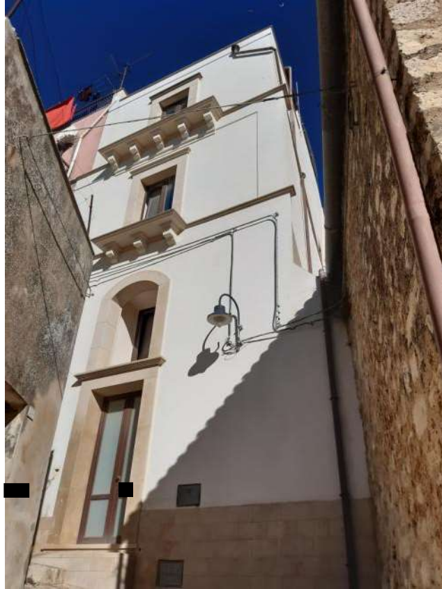
Vista n.4 – Porta d'ingresso via S. A. Guastella N.68 –