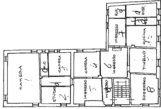
PIANO SECONDO H=mt. 3.00