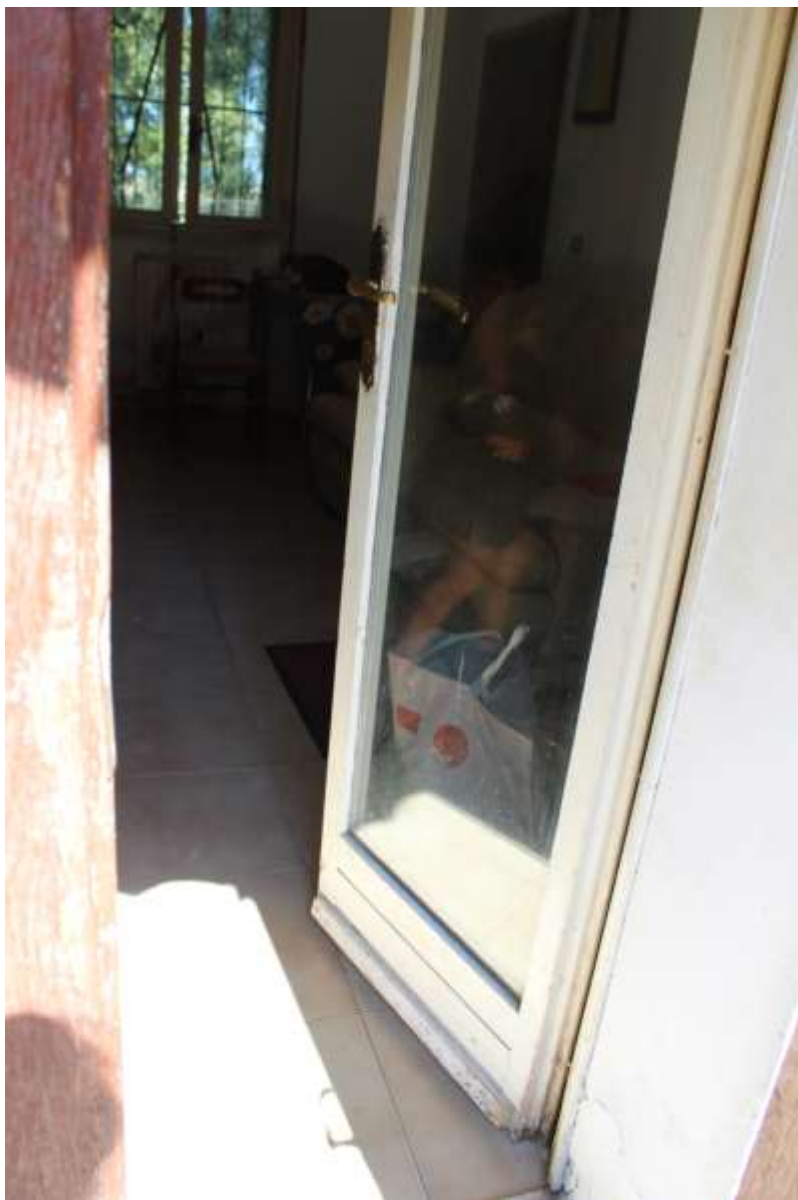
Ingresso su cucina