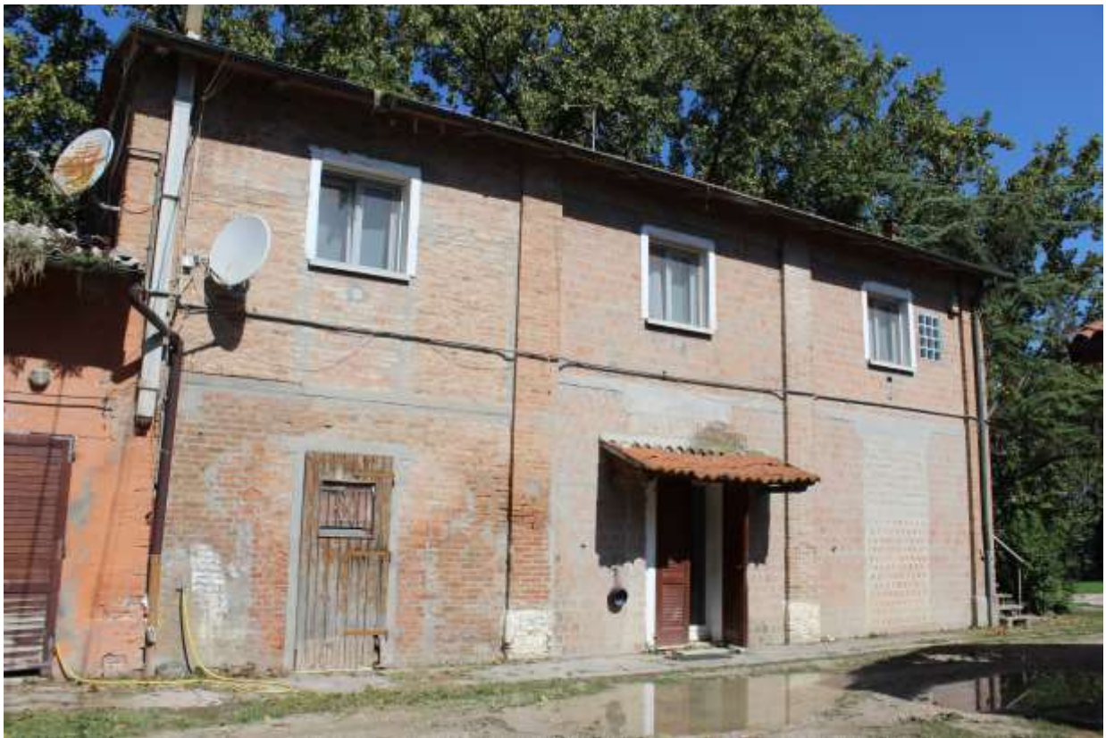
Fabbricato via Boschi n.53, edificio ex casella – Prospetto est