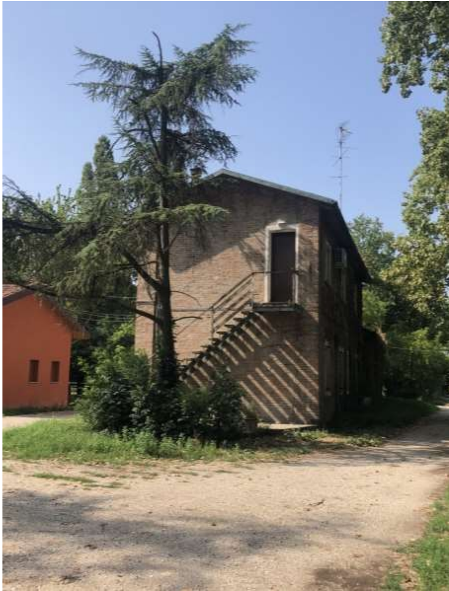
Prospetto nord e accesso all'unità abitativa