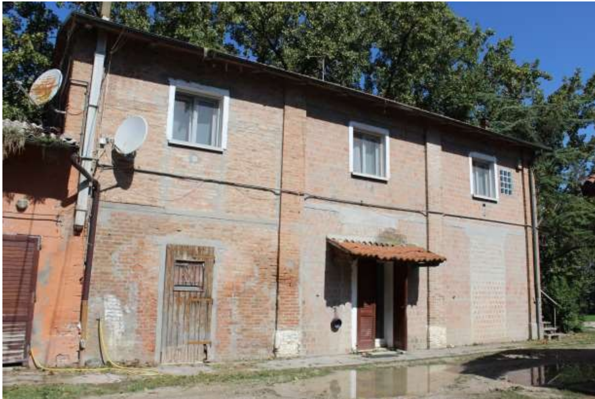
Fabbricato via Boschi n 53, edificio ex casella Prospetto est