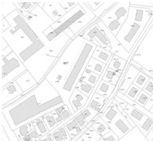
estratto zona catastale

L'intero edificio sviluppa 6 piani, 5 piani fuori terra, 1 piano interrato. Immobile costruito nel 2008 ristrutturato nel 2008.