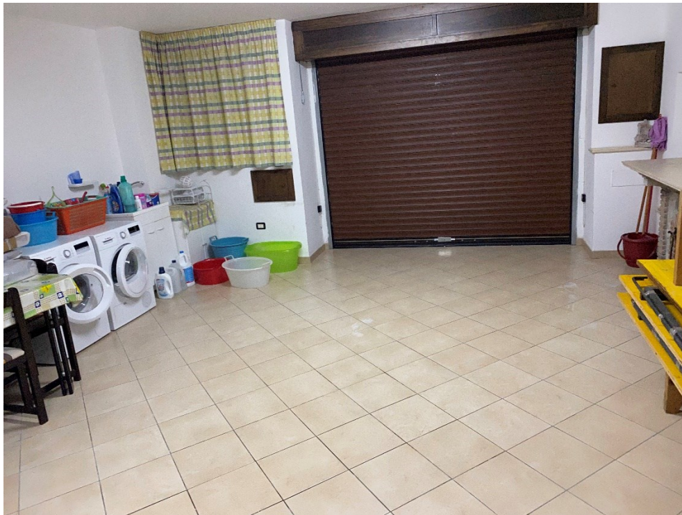
Garage FOTO N. 5