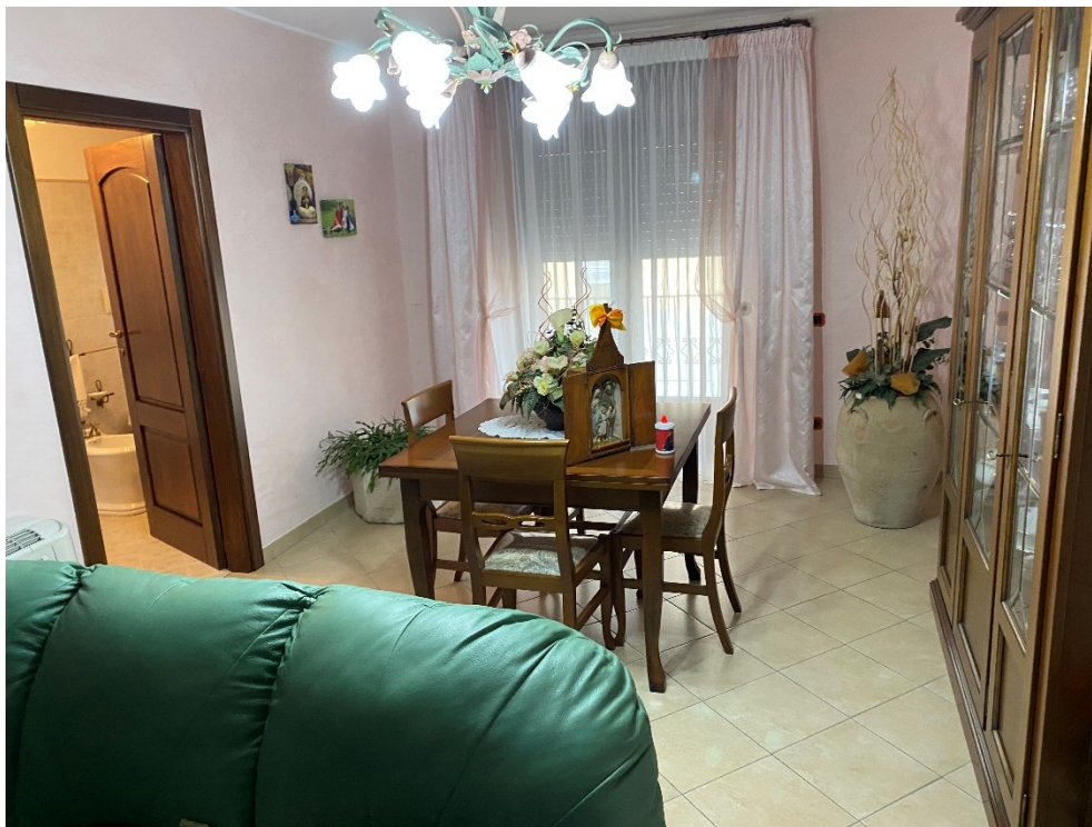
Soggiorno primo piano FOTO N. 10