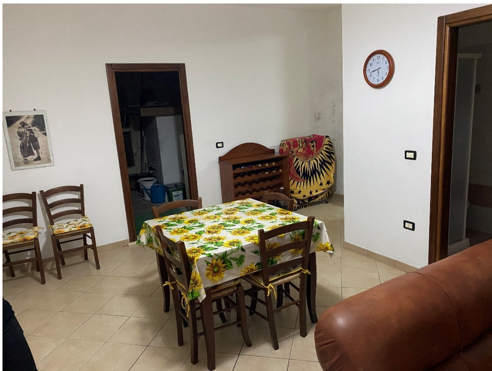
Tavernetta piano Terra FOTO N. 2