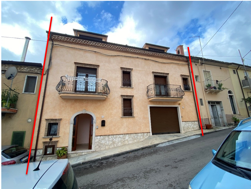
Fabbricato oggetto della procedura FOTO N. 1