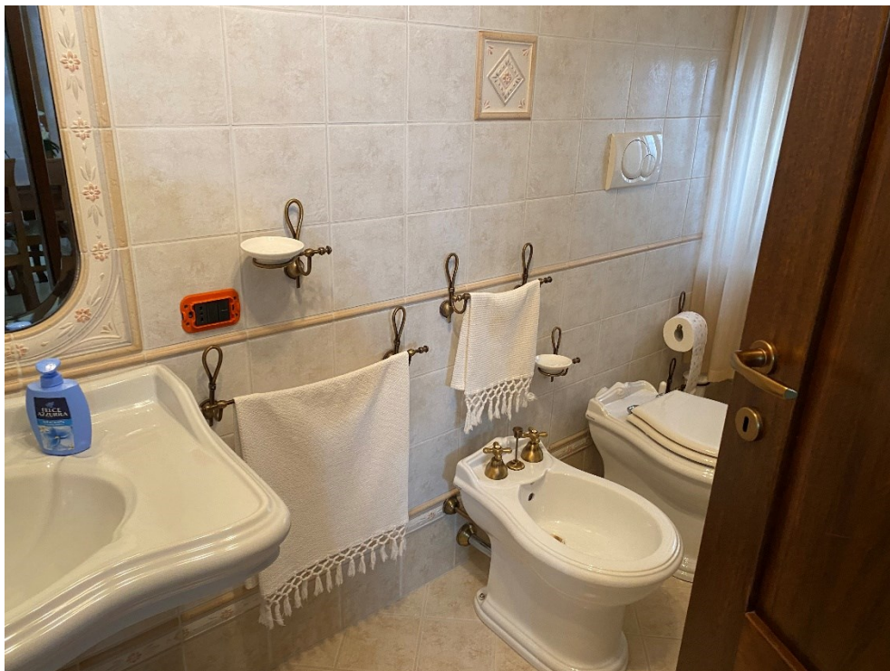
Bagno primo piano FOTO N. 12