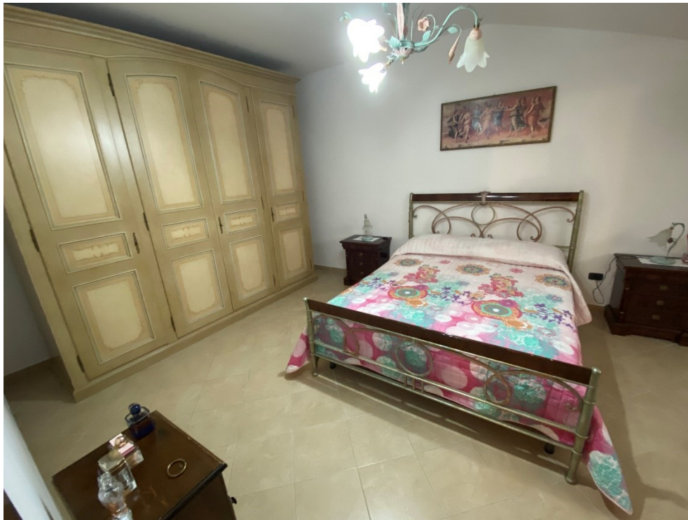
Camera secondo piano FOTO N.17