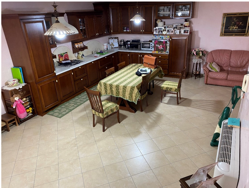
Cucina primo piano FOTO N. 8