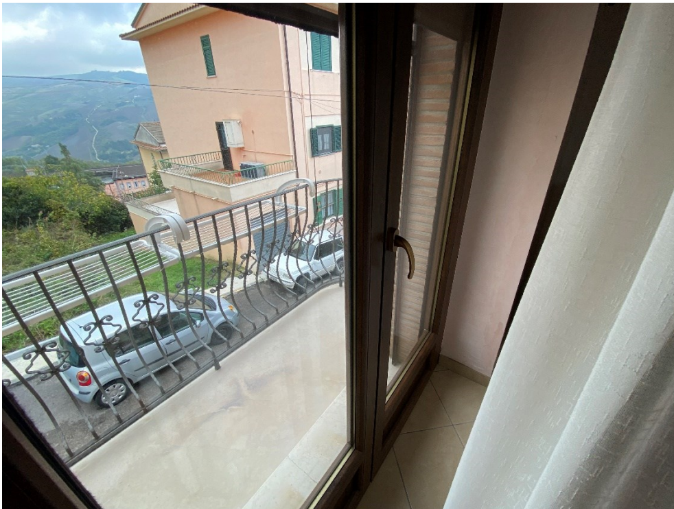
PARTICOLARE BALCONE E INFISSO FOTO N. 19