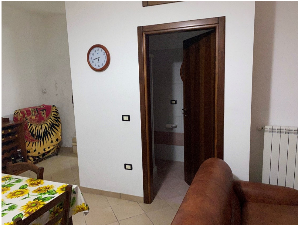
Bagno piano terra FOTO N. 3