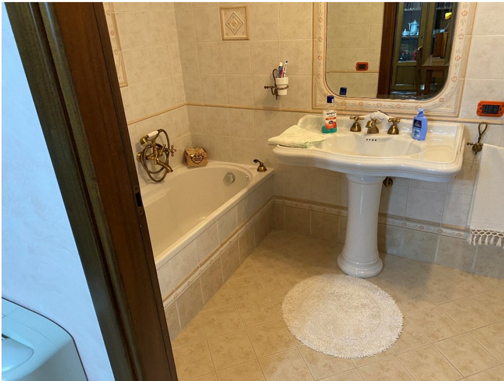
Bagno primo piano FOTO N. 13