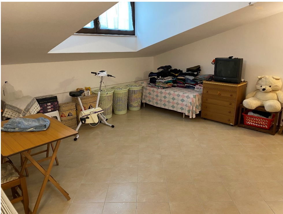
Camera secondo piano FOTO N. 14