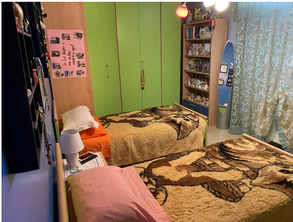
Camera secondo piano FOTO N.15