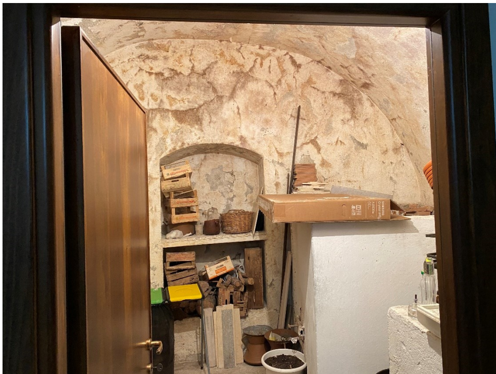
Cantina FOTO N. 4