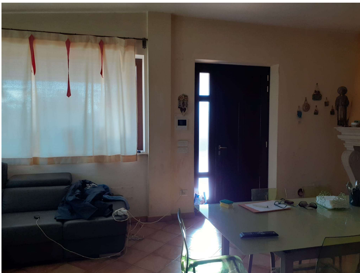
INGRESSO – SOGGIORNO