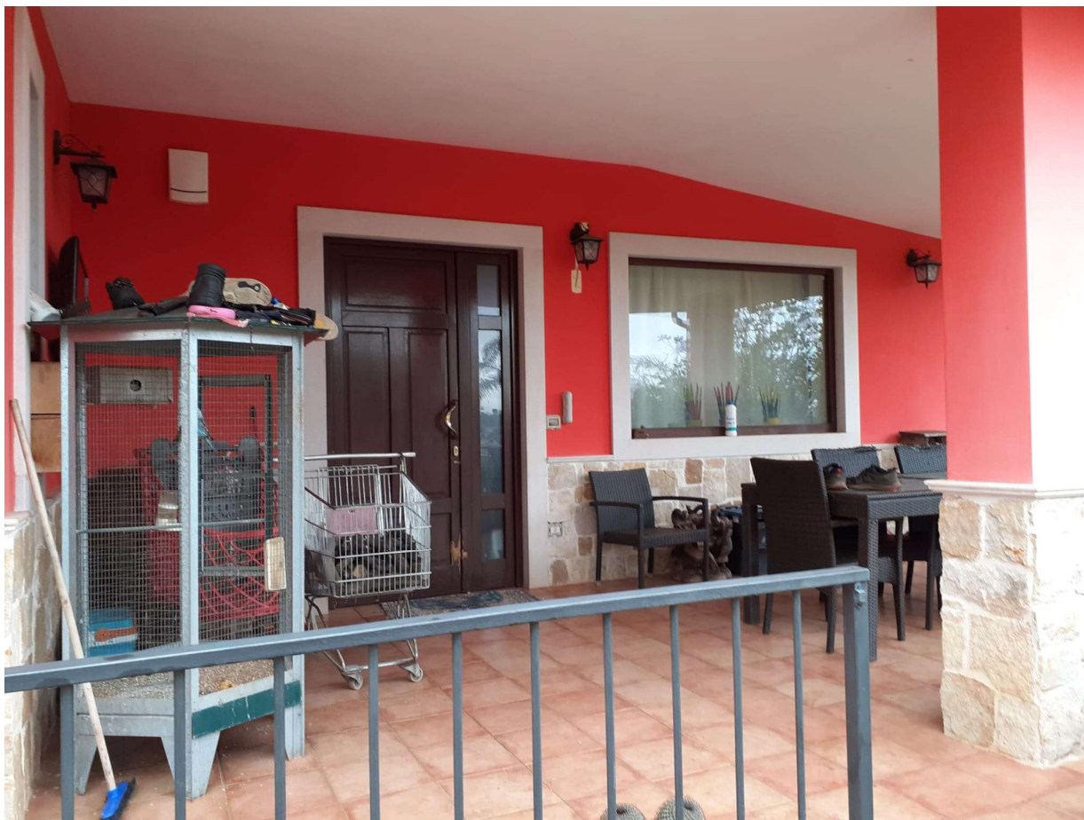
VISTA INGRESSO – PROSPETTO EST