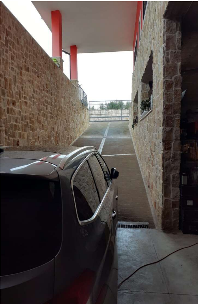
INGRESSO PIANO INTERRATO (CONTROCAMPO)