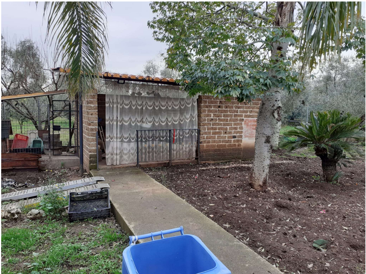
VISTA EST (CONTROCAMPO)