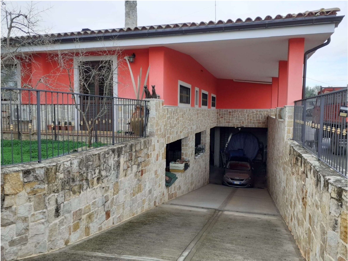
INGRESSO PIANO INTERRATO (LATO NORD)