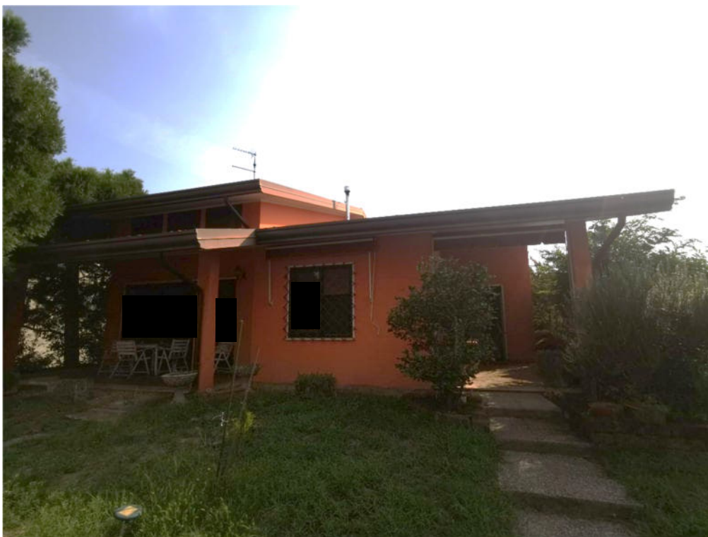
2. particolare prospetto principale