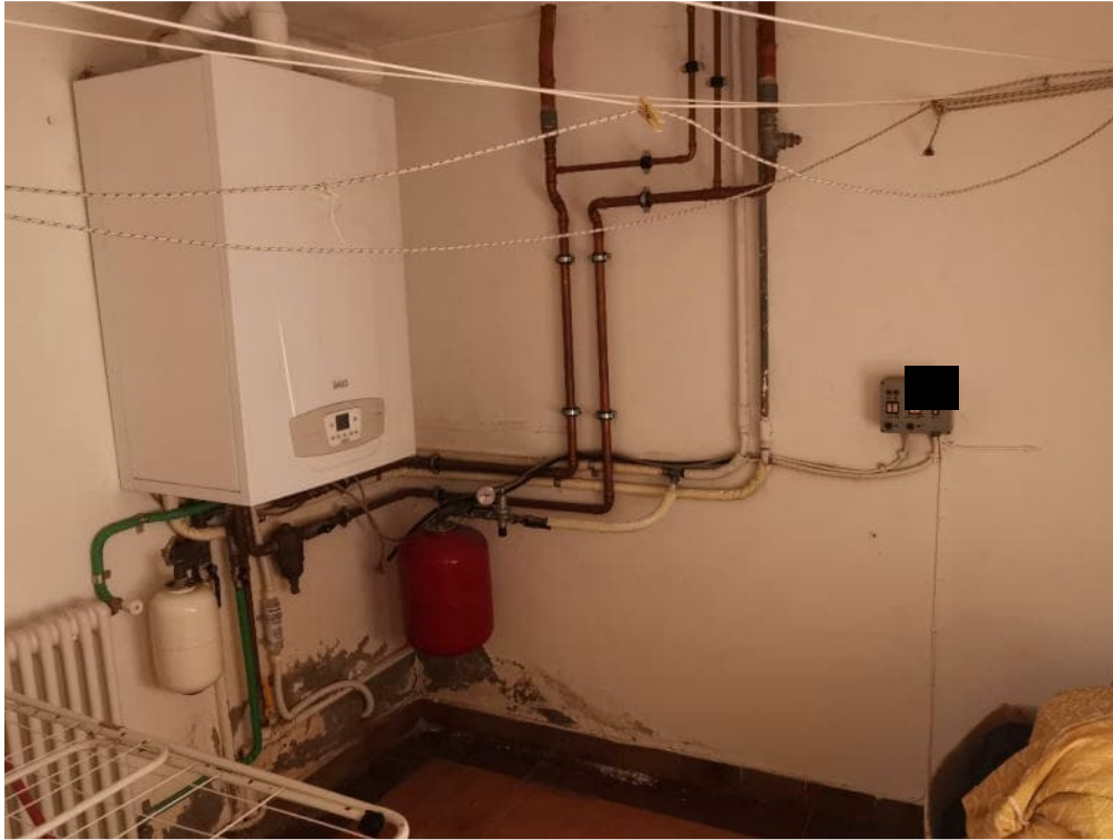
13 - particolare interno – piano terra