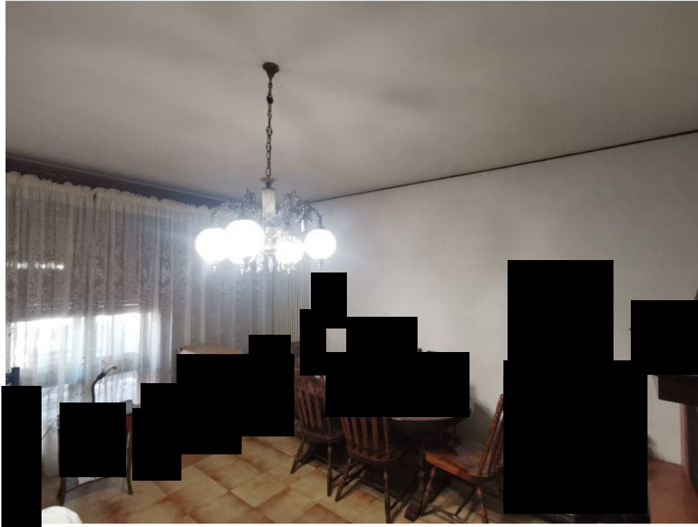
5 - particolare interno abitazione