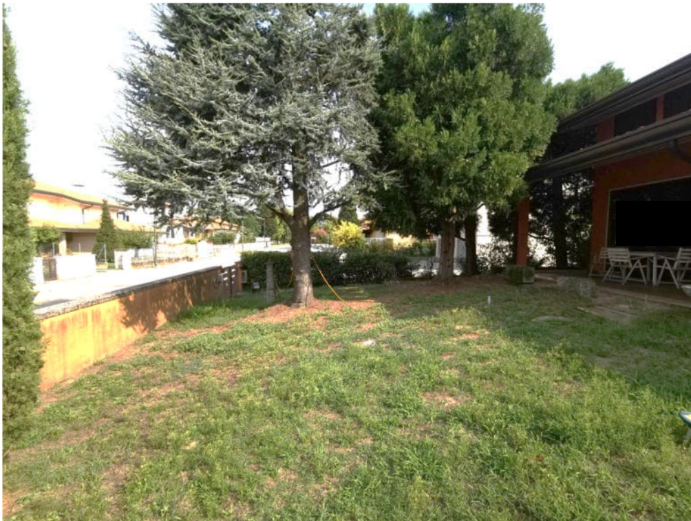
4. particolare prospetto est e giardino