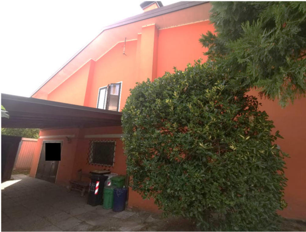
3. particolare prospetto nord