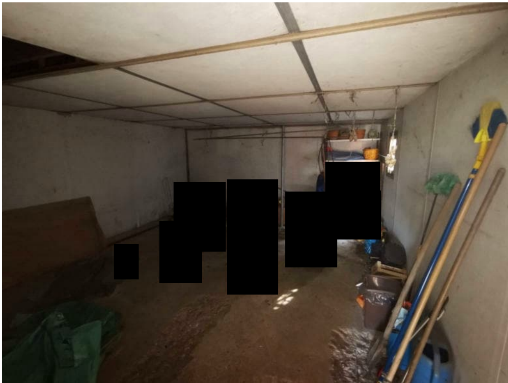
14 - particolare interno garage