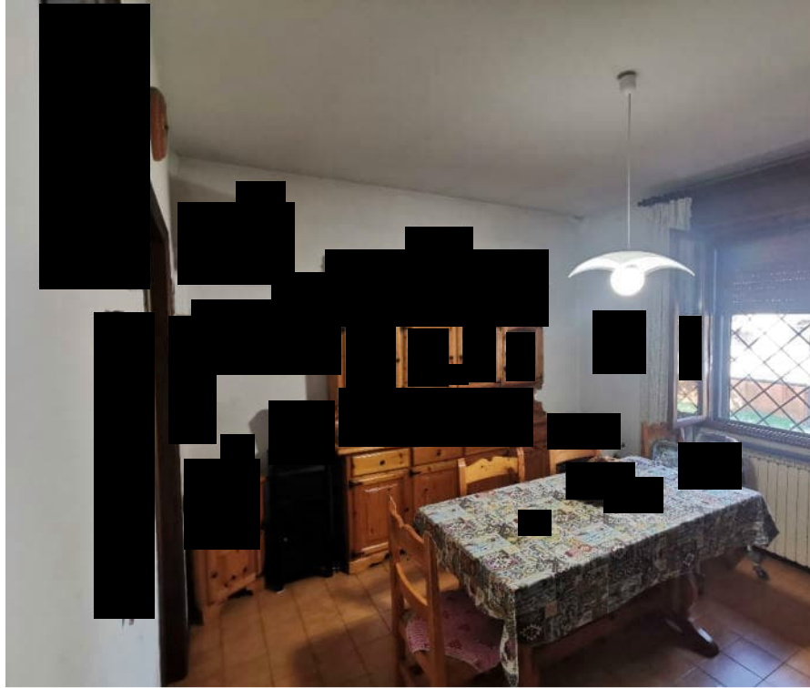
7 - particolare interno piano rialzato