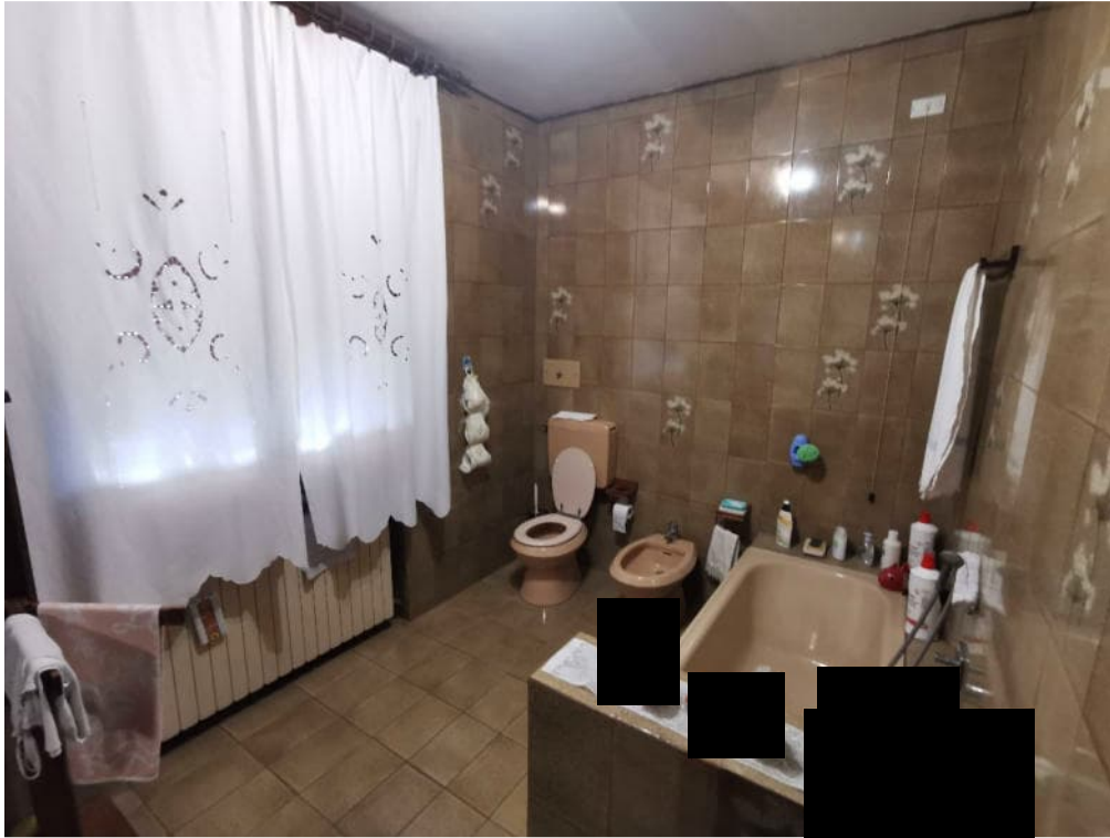
9 - particolare interno - bagno