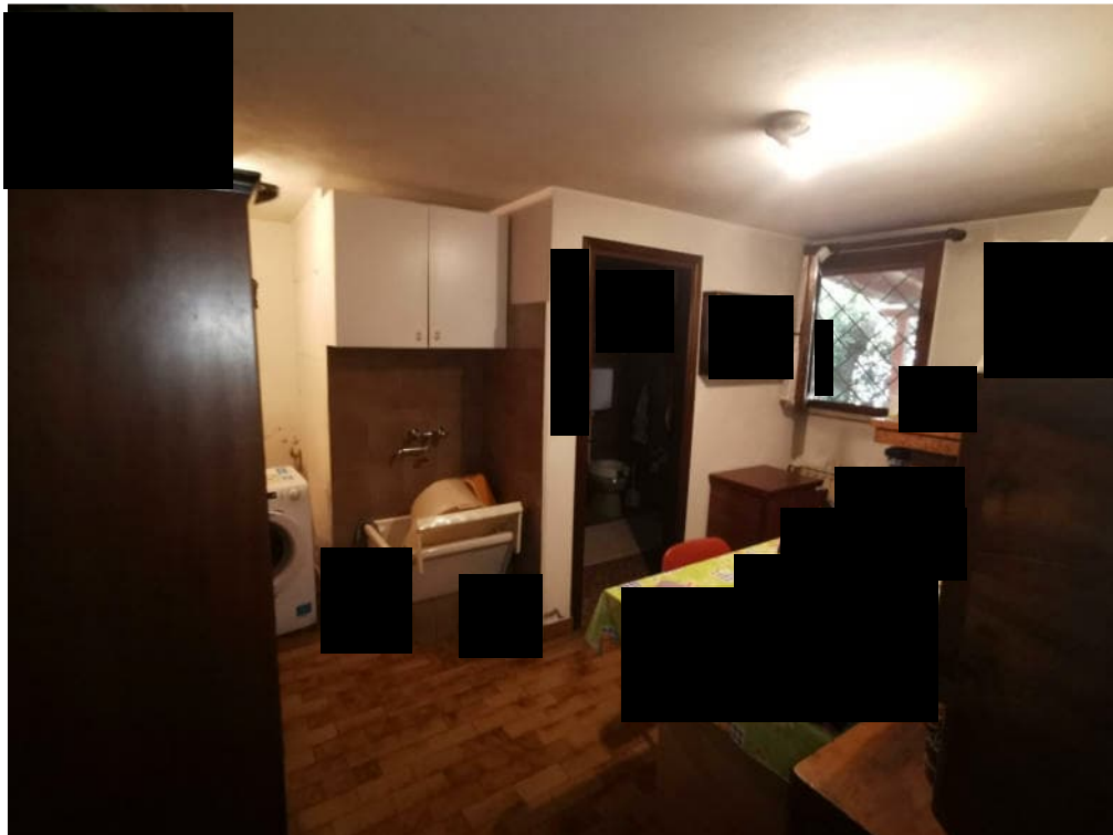
12 - particolare interno – piano terra