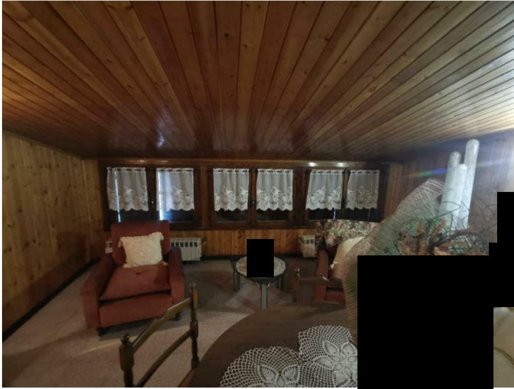
11 - particolare interno – sottotetto non autorizzato