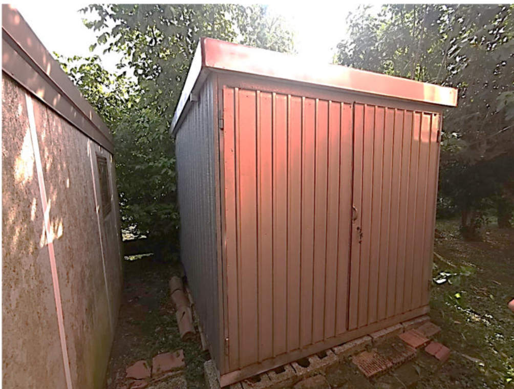
16 - manufatto non autorizzato