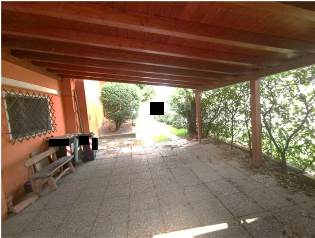
15 - pergolato non autorizzato