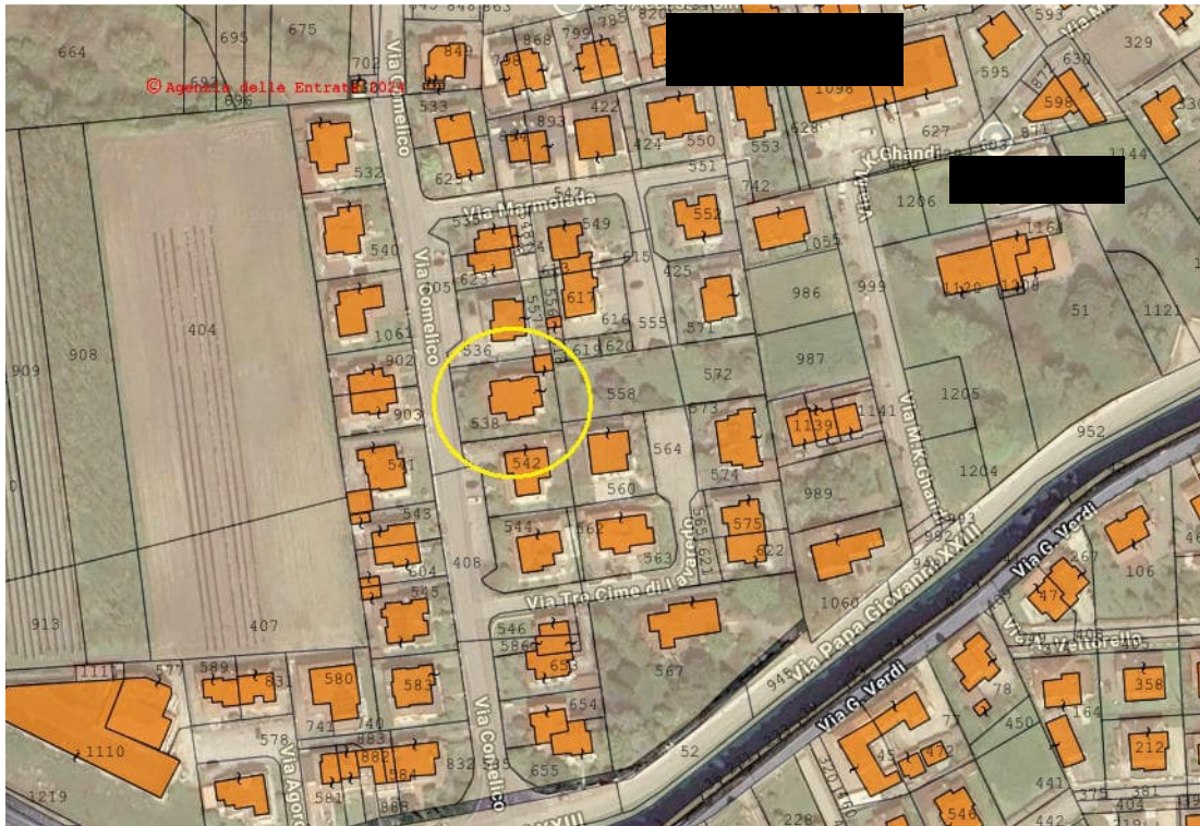
1. immagine estratta da forMaps