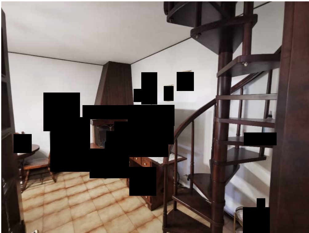
6 - particolare interno piano rialzato con scala accesso al sottotetto