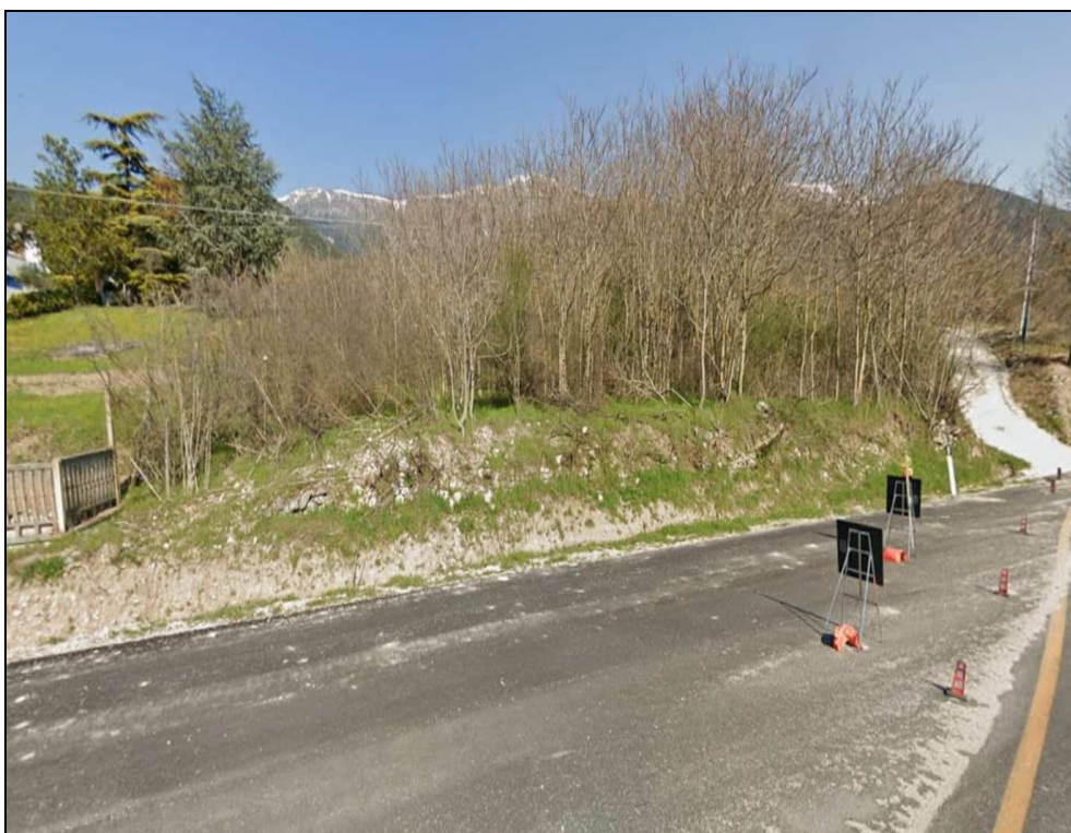
Veduta terreno dalla SS. 17

Prezzo base d'asta : € 94.769,00 (dicansi euro novantaquattromila settecentosessantannove/00).