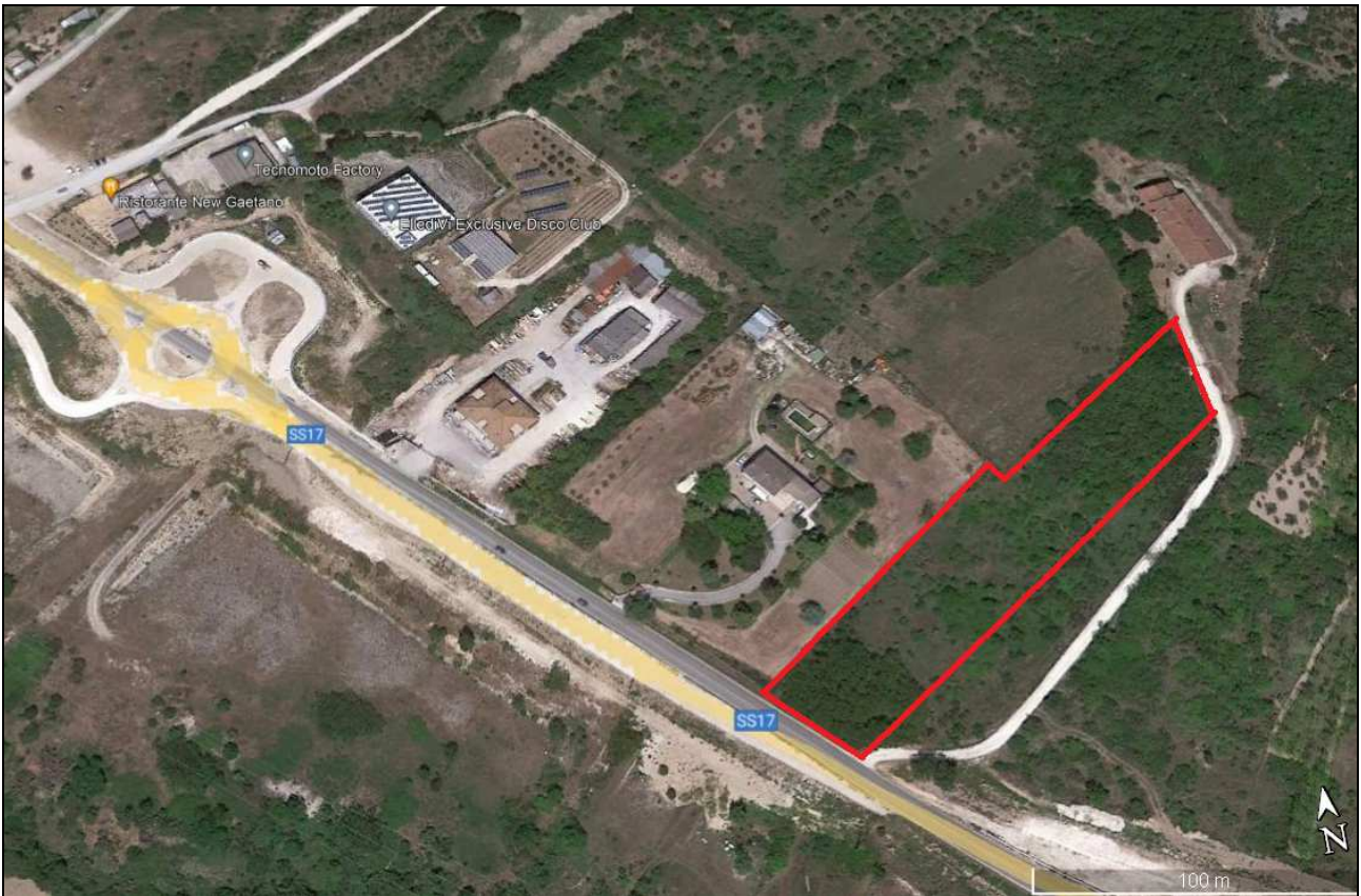
Stralcio da Google Earth – Terreno al Fg. 29 P.IIa 46 – In rosso il confine approssimativo della P.IIa 46

Come dichiarato a verbale del 04/11/2022 (vedere allegato n° 2) dal Sig. ████████ socio della fallita, detto terreno non è stato mai dato in affitto o conduzione.