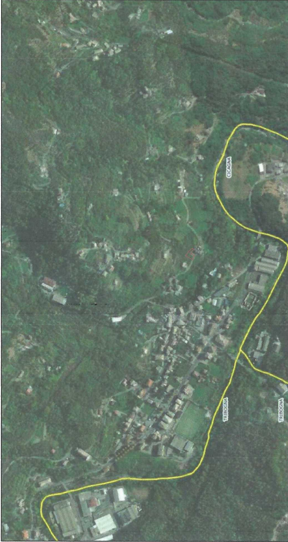
TAVOLA DI LOCALIZZAZIONE MOCONESI