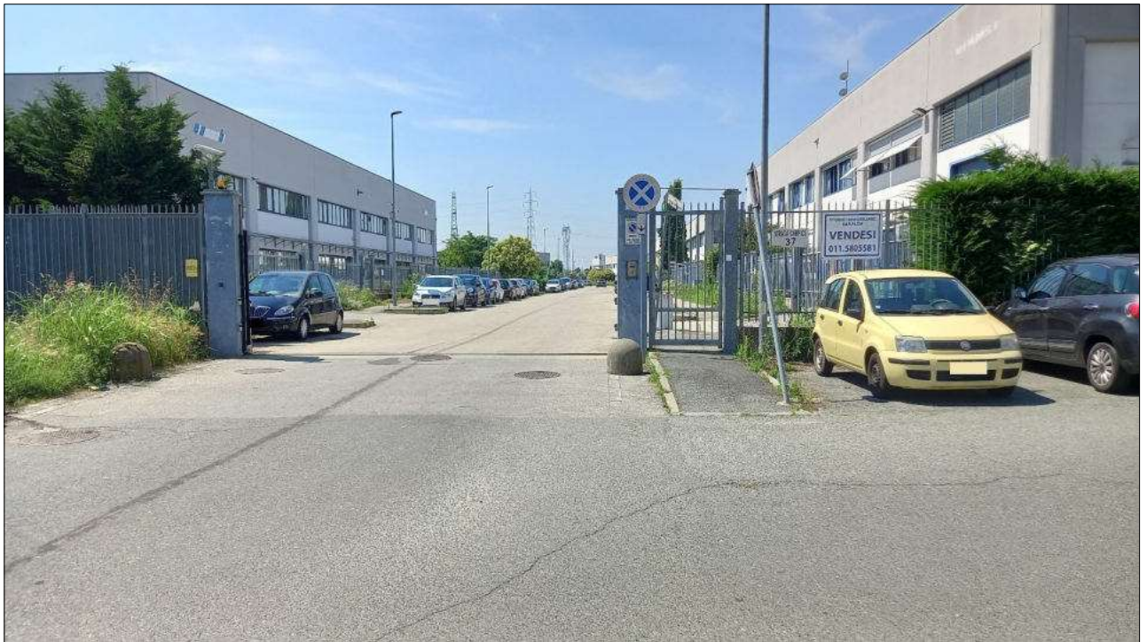
Foto n. 1 – Ingresso all'area industriale da via Strada Carpice n. 37