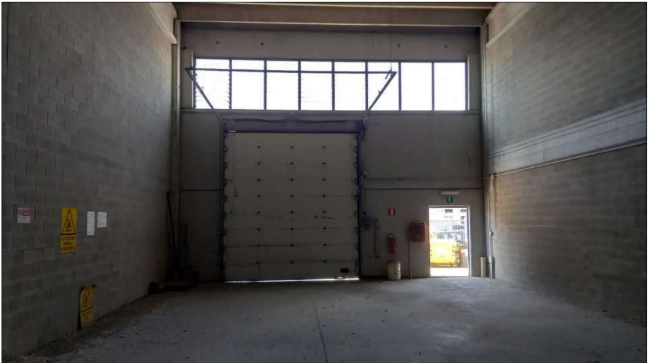
Foto n. 10 – Particolare interno con accesso carrabile e pedonale