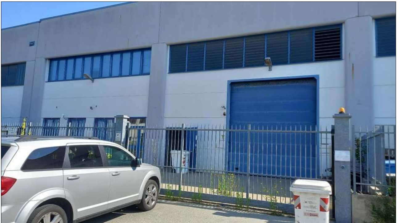
Foto n. 6 – Particolare ingresso carrabile da Via dell'Ottone n. 4