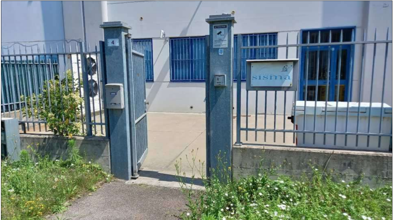
Foto n. 5 – Particolare ingresso pedonale da Via dell'Ottone n. 4