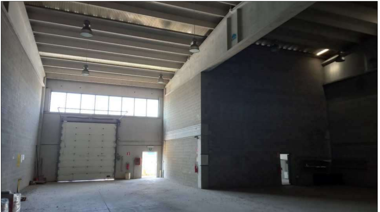
Foto n. 11 – Particolare interno con accesso carrabile/pedonale e blocco uffici