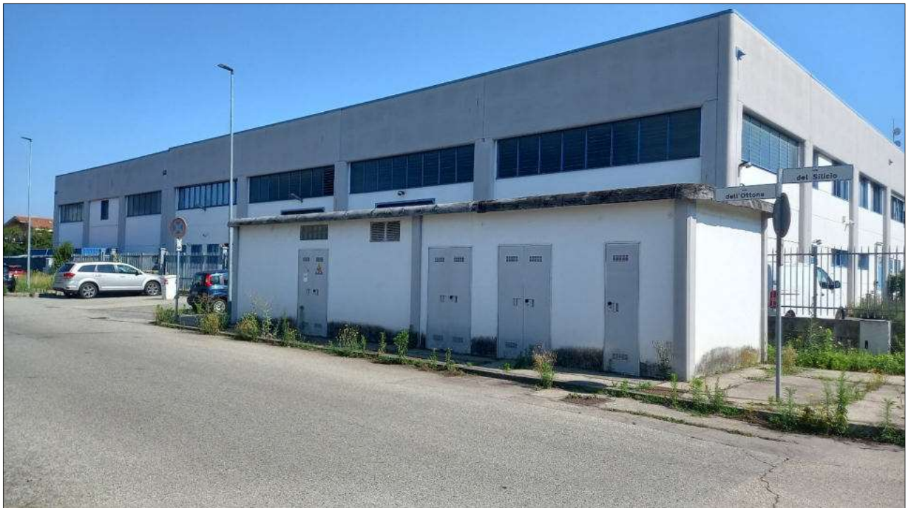
Foto n. 2 – Vista generale di Via dell'Ottone (trav. interna di Strada Carpice n. 37 con intero blocco edilizio e cabine Enel)