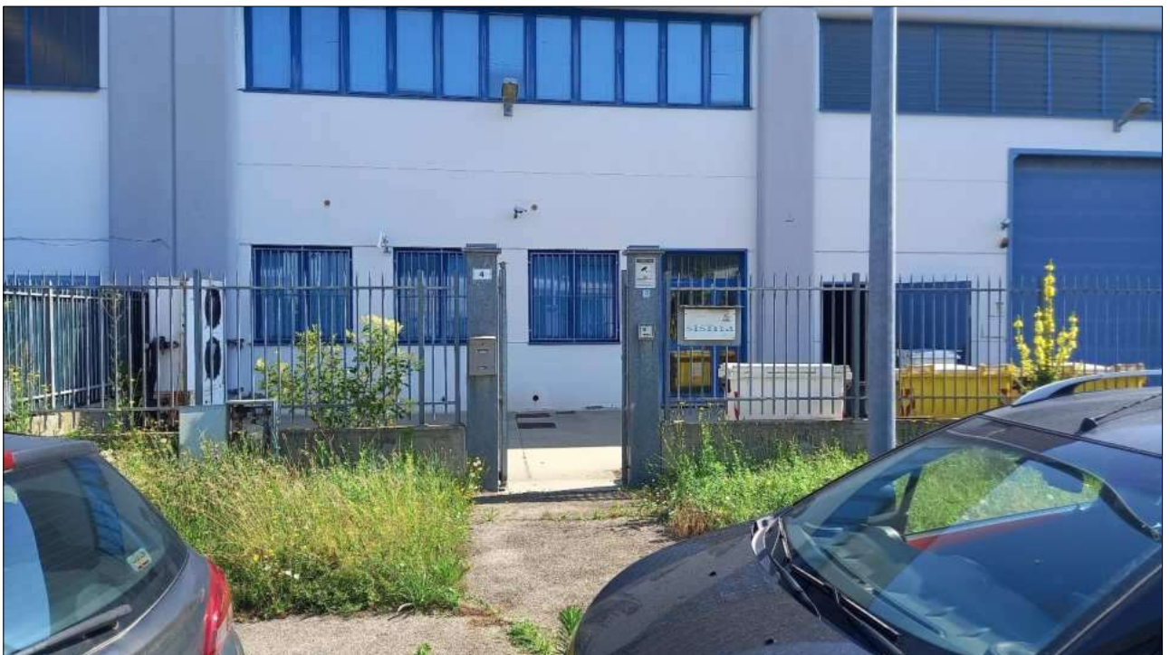
Foto n. 4 – Prospetto sud con ingresso pedonale da Via dell'Ottone n. 4