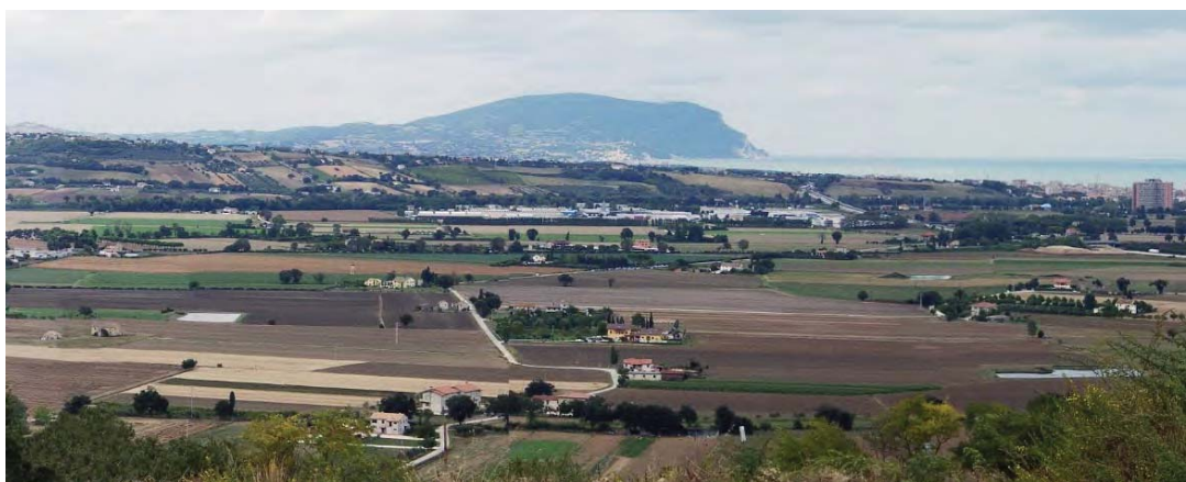
VISTA PANORAMICA DA LOTTIZZAZIONE MARE