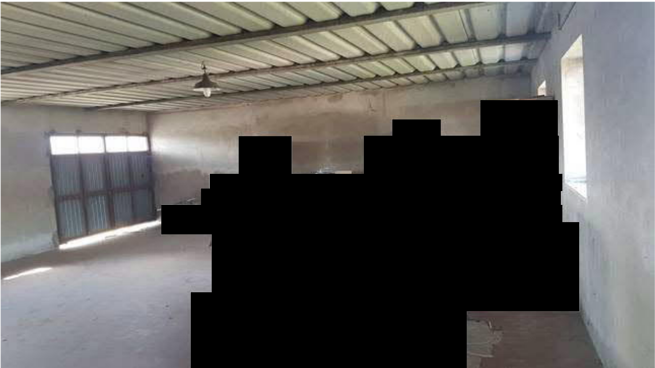
10- INTERNO PIANO PRIMO