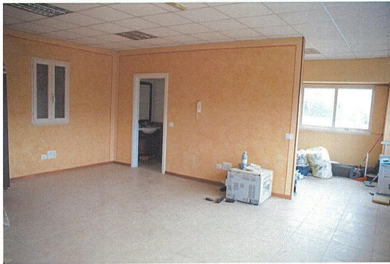
Foto n°15: altro particolare del piano primo avente destinazione d'uso "ufficio".