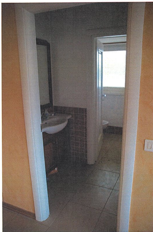
Foto n°16: particolare del bagno con antibagno posto al piano primo.