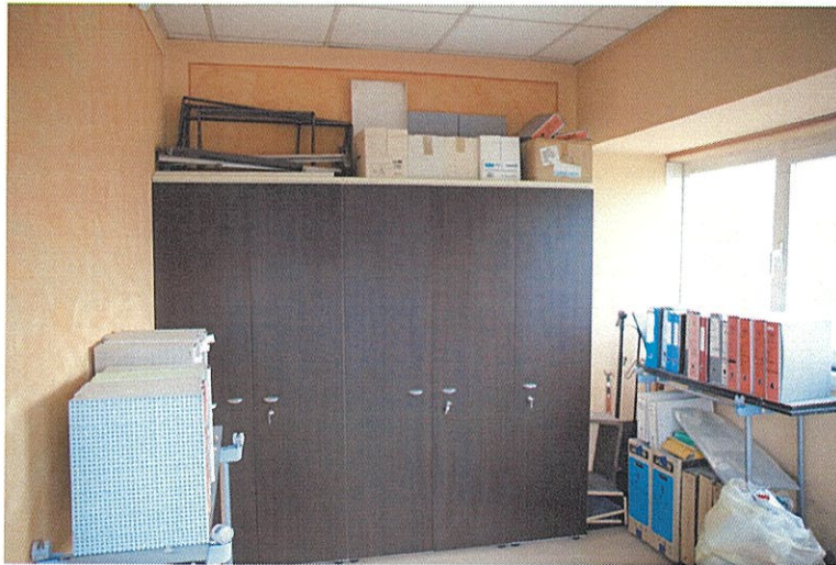
Foto n°17: altro particolare del locale avente destinazione d'uso "ufficio" posto in adiacenza al bagno del piano primo.