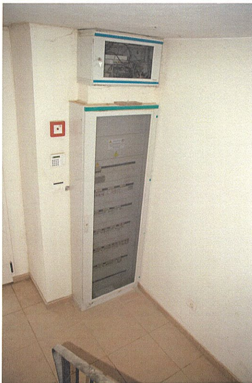
Foto n°18: particolare del quadro generale della luce posto all'ingresso.