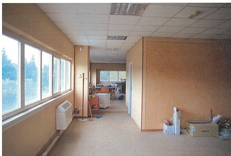
Foto n°14: particolare del piano primo avente destinazione d'uso "ufficio".