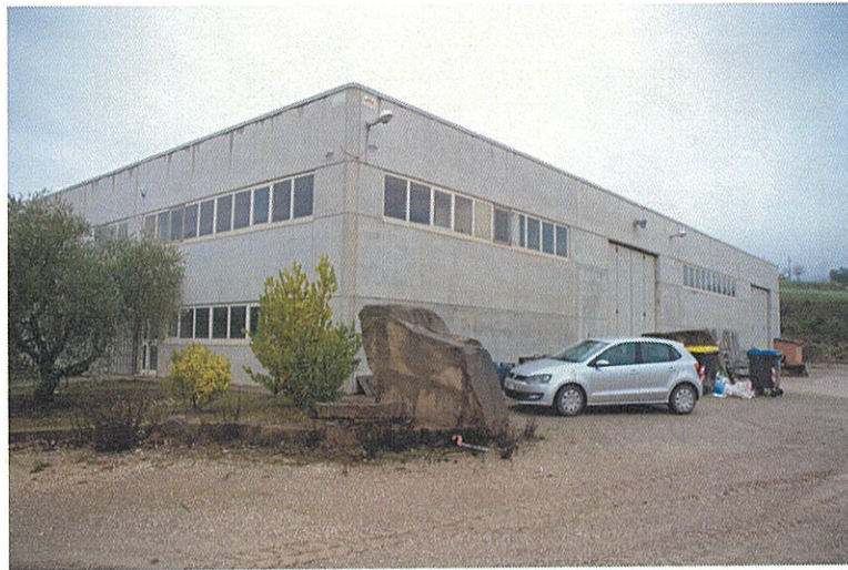
Foto n°4: vista lato Sud-Est del fabbricato che insiste sulla particella n. 559.