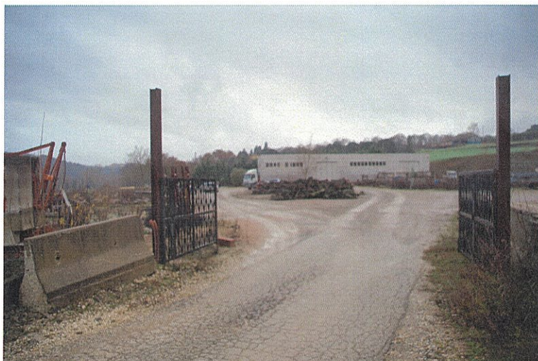
Foto n°1: vista lato Nord-Est del fabbricato e delle particelle n. 559, 574 e 577, si noti l'ingresso carrabile con cancello elettrico.