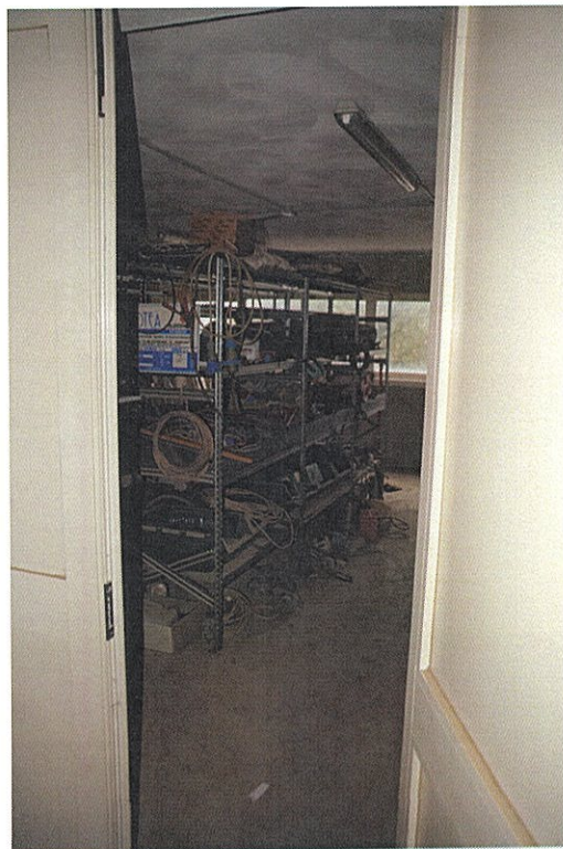
Foto n°10: particolare del locale avente destinazione d'uso "sala riposo" attualmente adibito a magazzino.