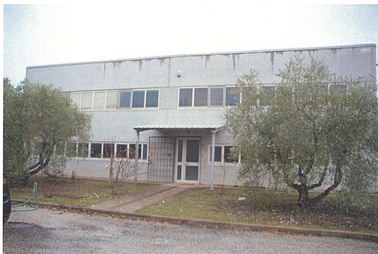
Foto n°5: particolare della porta d'ingresso posta lungo il lato Sud dell'edificio.