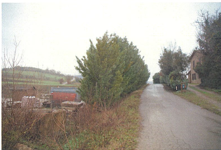
Foto n°2: vista lato Sud-Est della particella n. 576 adiacente alla strada.