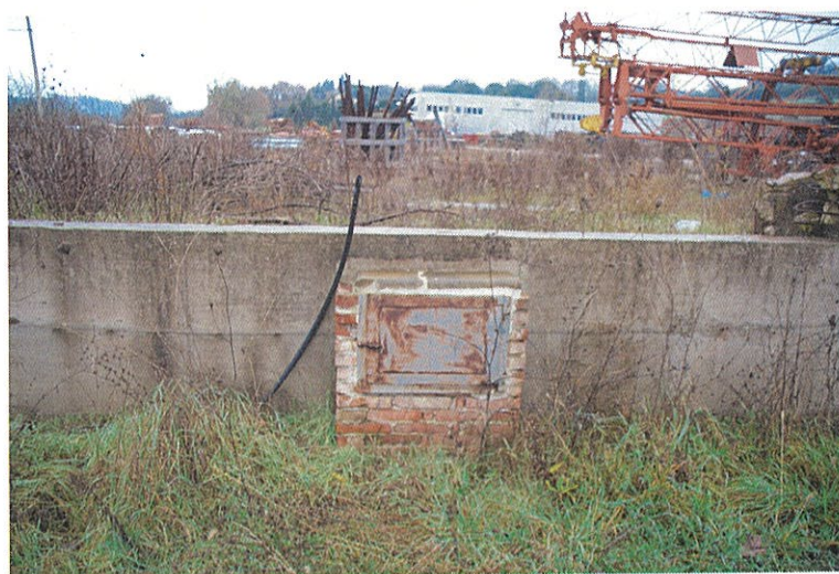
Foto n°20: particolare dell'alloggiamento del contatore dell'acqua posto all'esterno lungo la strada che interseca la strada regionale 220, si noti sullo sfondo la proprietà.