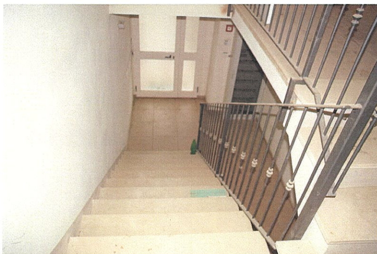
Foto n°13: particolare interno dell'ingresso e del vano scala che conduce al piano primo.