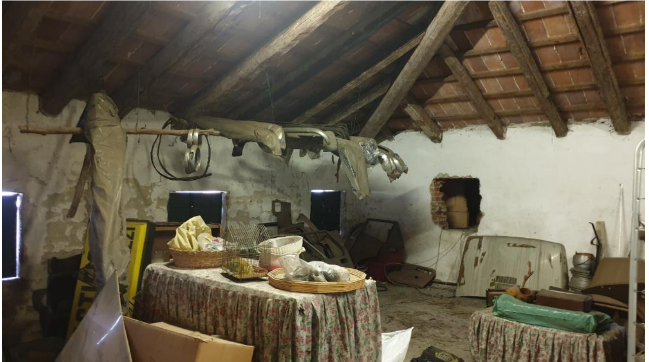
FOTO N. 17 - SOTTOTETTO