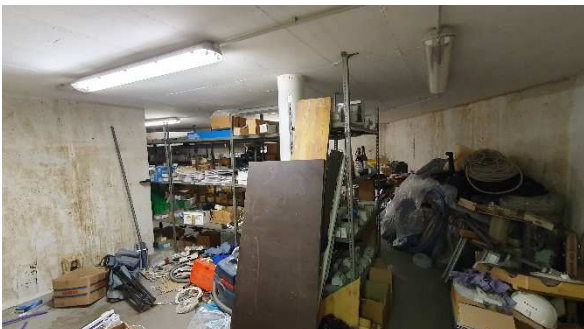
Foto 5: Ansicht hinteres Magazin (im Hintergrund nicht genehmigter zusätzlicher Raum)