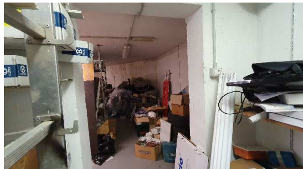
Foto 4: Tür zwischen vorderer und hinterer Raum (im Hintergrund nicht genehmigter zusätzlicher Raum)