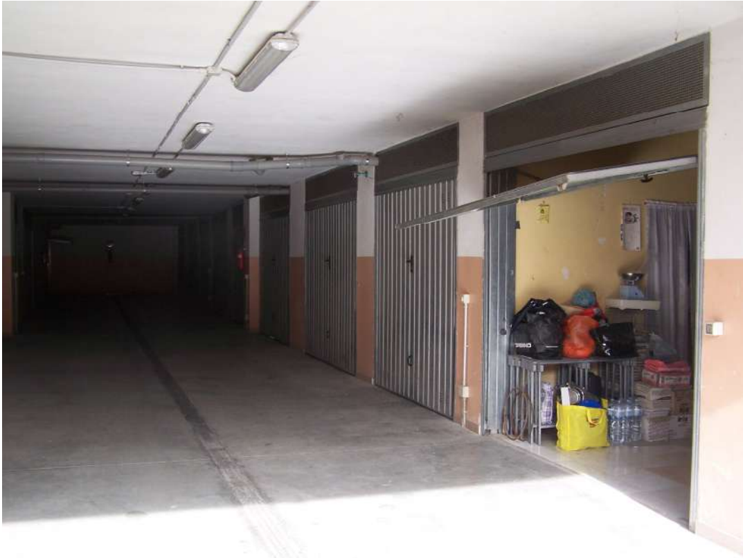
Foto n. 19 Area di manovra ed accessi agli immobili NCEU Trinitapoli Foglio 26 P.Ila 1033 sub.11-12