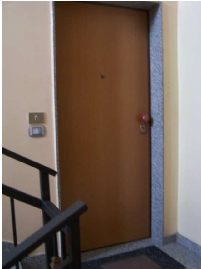
Foto n. 8 Ingresso immobile NCEU Trinitapoli Foglio 26 P.Ila 1033 sub.27