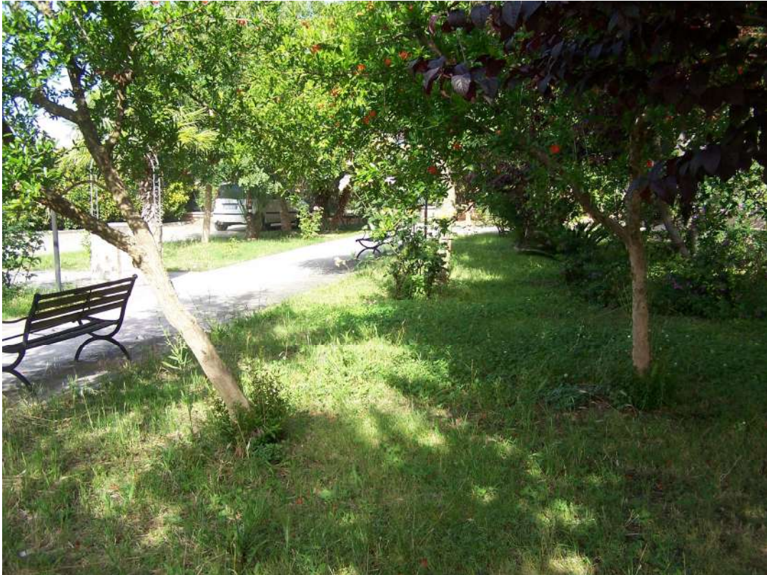
Foto n. 5 Cortile condominiale immobile NCEU Trinitapoli Foglio 26 P.Ila 1033