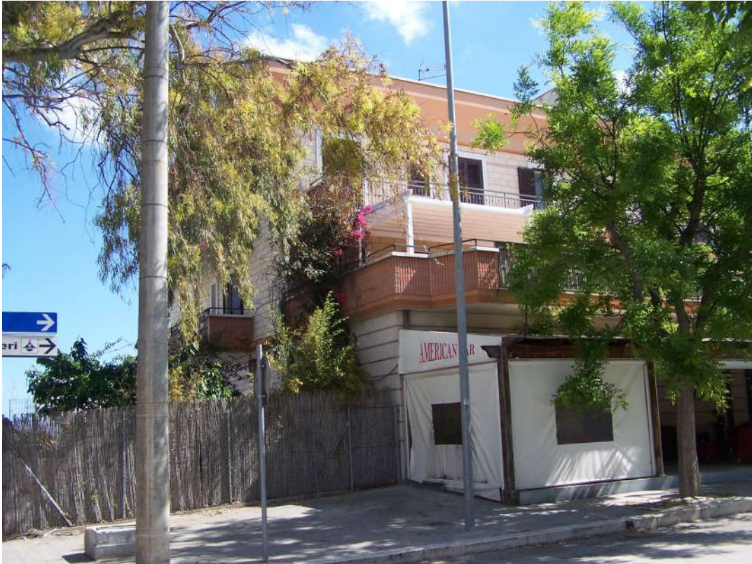
Foto n. 3 Vista immobile NCEU Trinitapoli Foglio 26 P.IIa 1033 da via Mandriglia