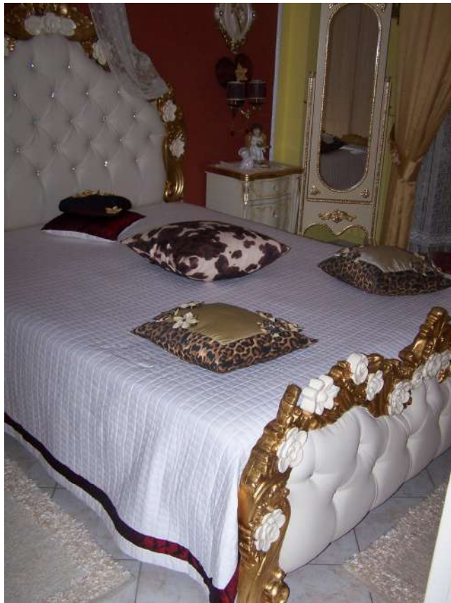
Foto n. 10 Camera letto immobile NCEU Trinitapoli Foglio 26 P.IIa 1033 sub.27