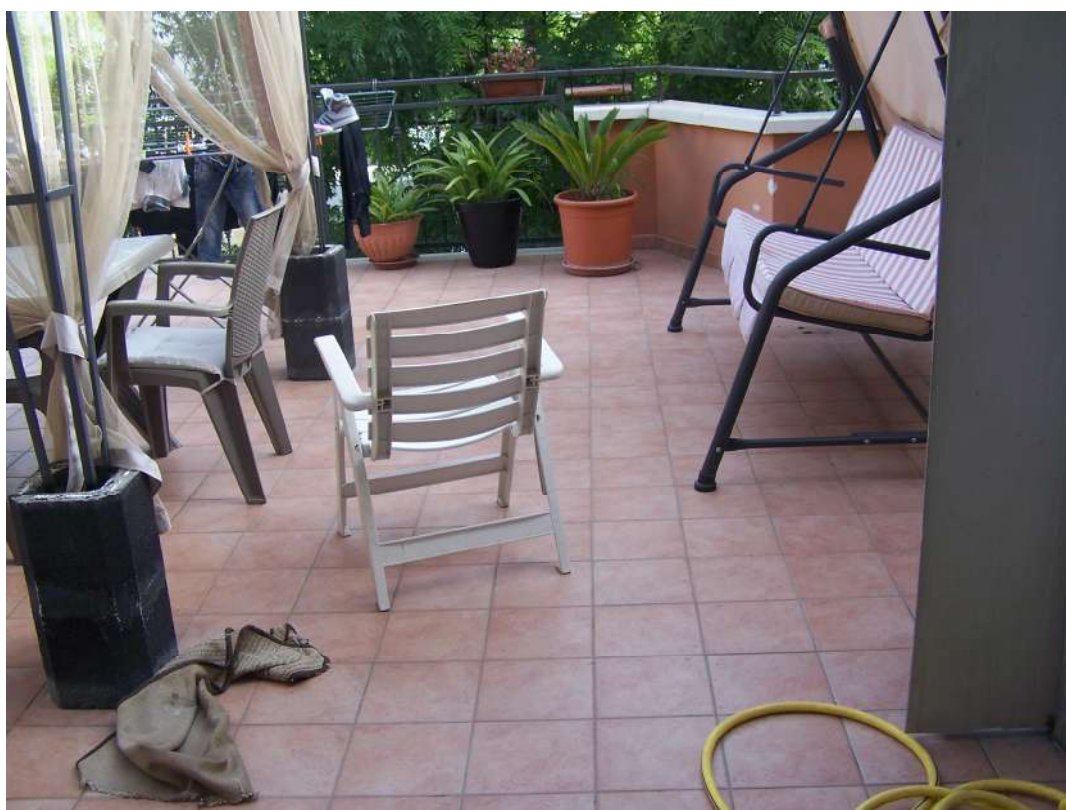
Foto n. 16 Terrazzo aggettante via Mandriglia immobile NCEU Trinitapoli Foglio 26 P.IIa 1033 sub.27