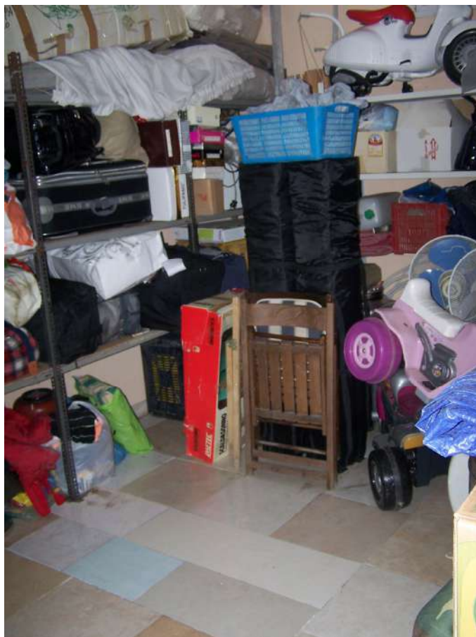
Foto n. 20 Particolare immobile NCEU Trinitapoli Foglio 26 P.Ila 1033 sub.12