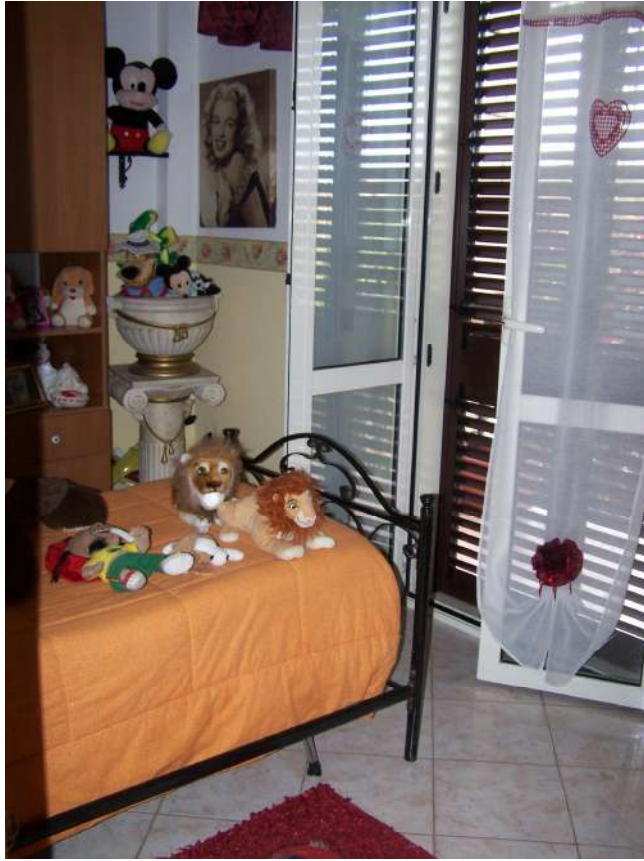
Foto n. 11 Camera letto immobile NCEU Trinitapoli Foglio 26 P.Ila 1033 sub.27