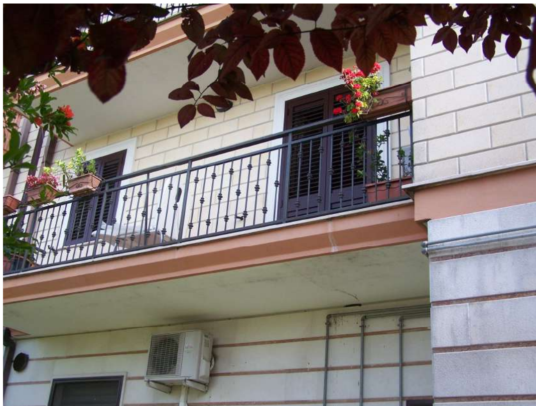
Foto n. 14 Balcone aggettante cortile interno immobile NCEU Trinitapoli Foglio 26 P.IIa 1033 sub.27