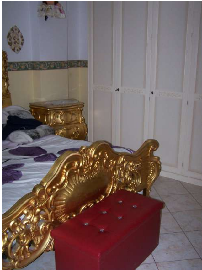
Foto n. 12 Camera letto immobile NCEU Trinitapoli Foglio 26 P.Ila 1033 sub.27