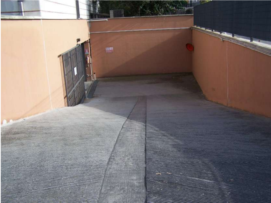
Foto n. 17 Rampa di accesso agli immobili NCEU Trinitapoli Foglio 26 P.IIa 1033 sub.11-12