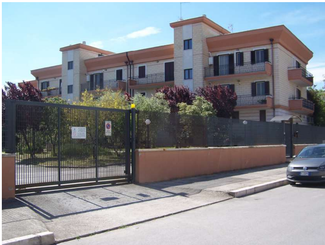
Foto n. 2 Vista immobile NCEU Trinitapoli Foglio 26 P.Ila 1033 da via Mulini