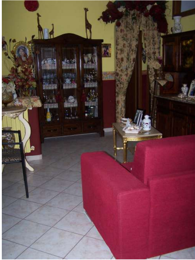
Foto n. 9 Ingresso soggiorno cucina immobile NCEU Trinitapoli Foglio 26 P.IIa 1033 sub.27