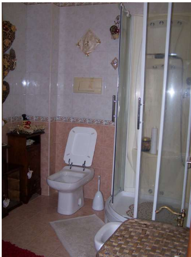
Foto n. 13 Bagno immobile NCEU Trinitapoli Foglio 26 P.IIa 1033 sub.27