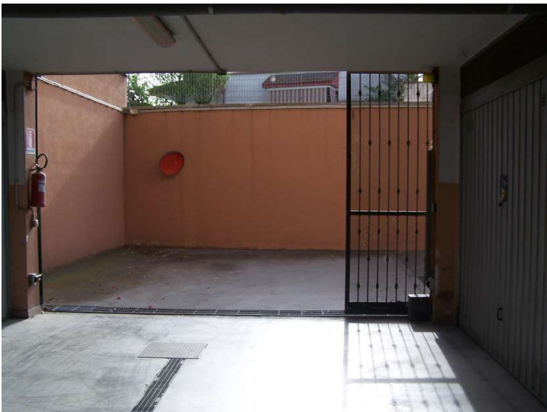
Foto n. 18 Cancello di accesso agli immobili NCEU Trinitapoli Foglio 26 P.IIa 1033 sub.11-12