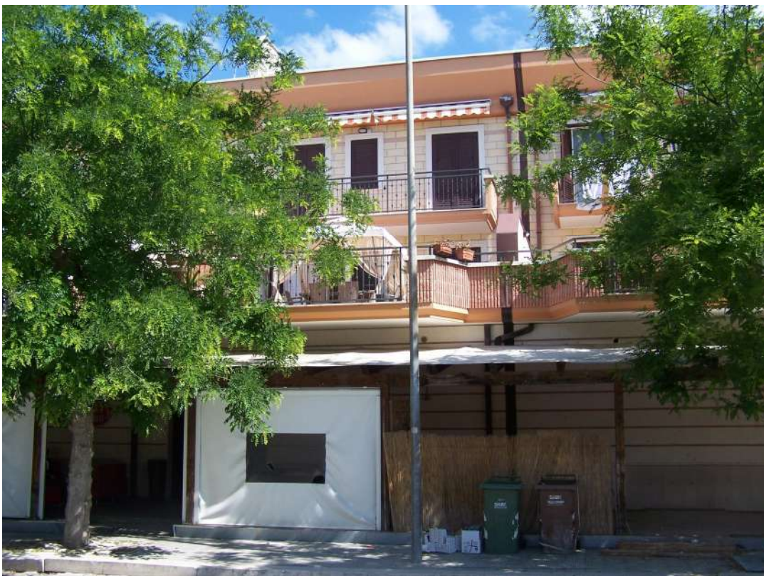
Foto n. 4 Vista immobile NCEU Trinitapoli Foglio 26 P.IIa 1033 da via Mandriglia