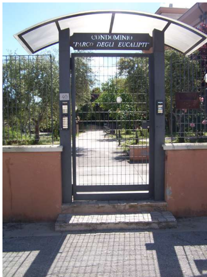
Foto n. 1 Ingresso immobile NCEU Trinitapoli Foglio 26 P.Ila 1033