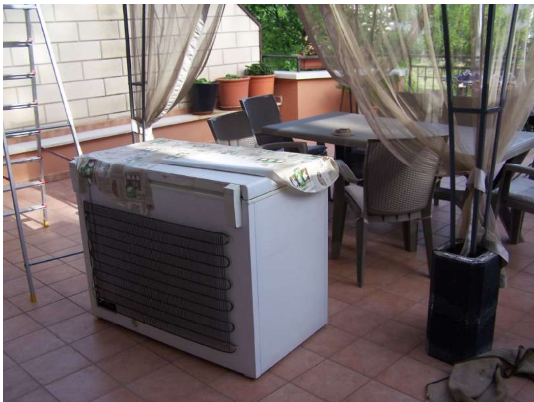
Foto n. 15 Terrazzo aggettante via Mandriglia immobile NCEU Trinitapoli Foglio 26 P.IIa 1033 sub.27