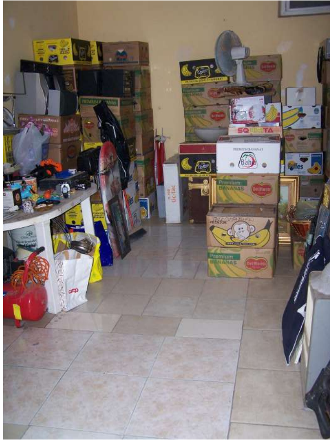
Foto n. 21 Particolare immobile NCEU Trinitapoli Foglio 26 P.IIa 1033 sub.11