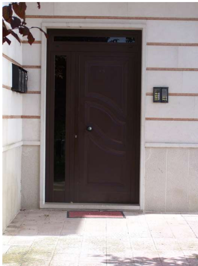
Foto n. 6 Ingresso immobile NCEU Trinitapoli Foglio 26 P.Ila 1033