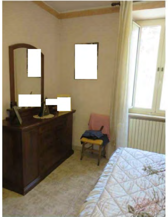
Camera da letto matrimoniale