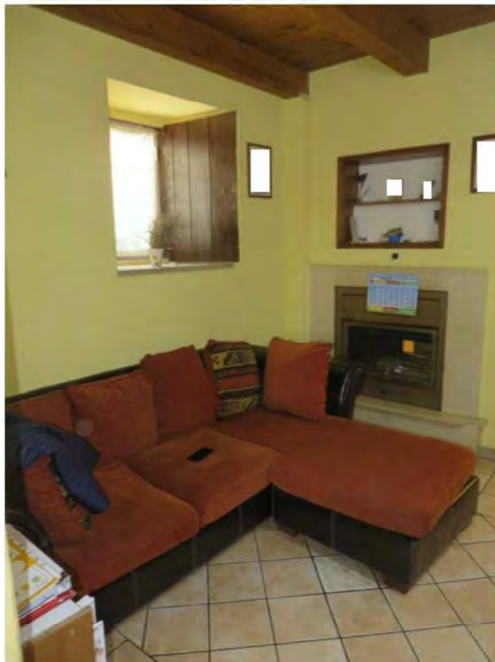
Zona salotto - camino