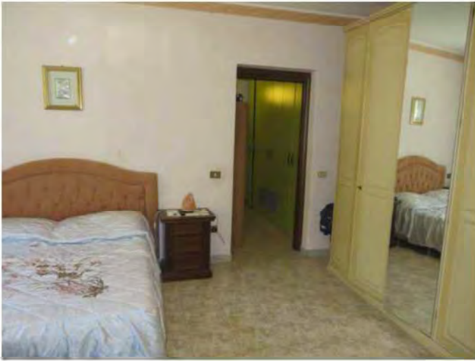
Camera da letto matrimoniale