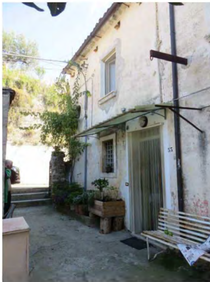
Particolare Ingresso Immobile