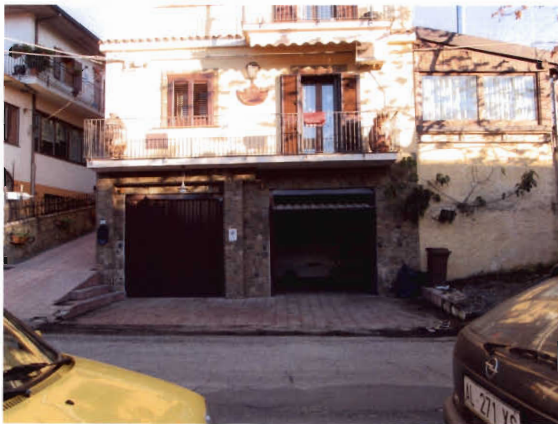
Foto n.2 vani garage