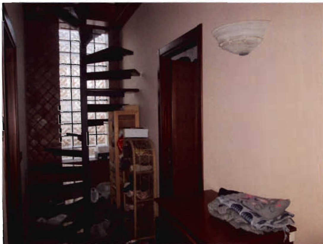
Foto n. 17 scala interna che dal piano primo conduce alla mansarda