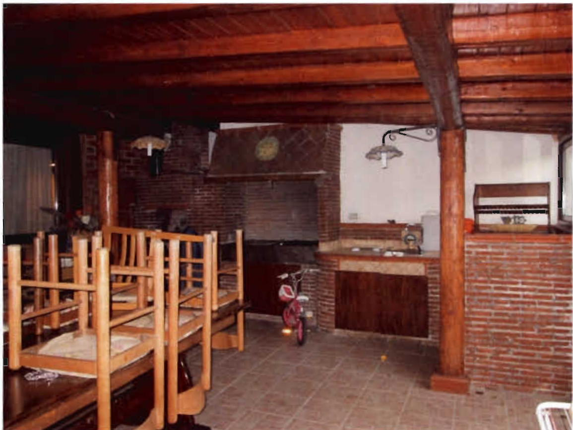
Foto n.11 Area esterna inglobata nell'abitazione ,con cucina in muratura, direttamente collegata al giardino.