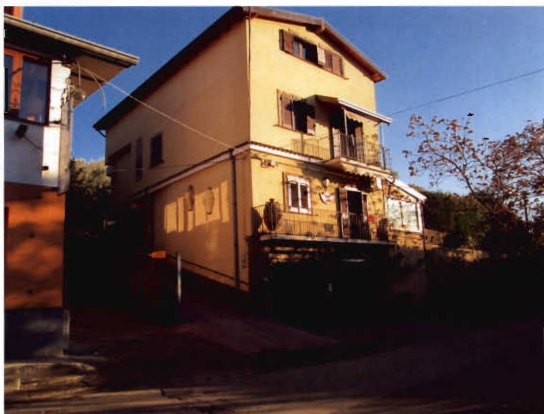
Foto n.4 ingresso all'immobile da rampa adiacente al fabbricato