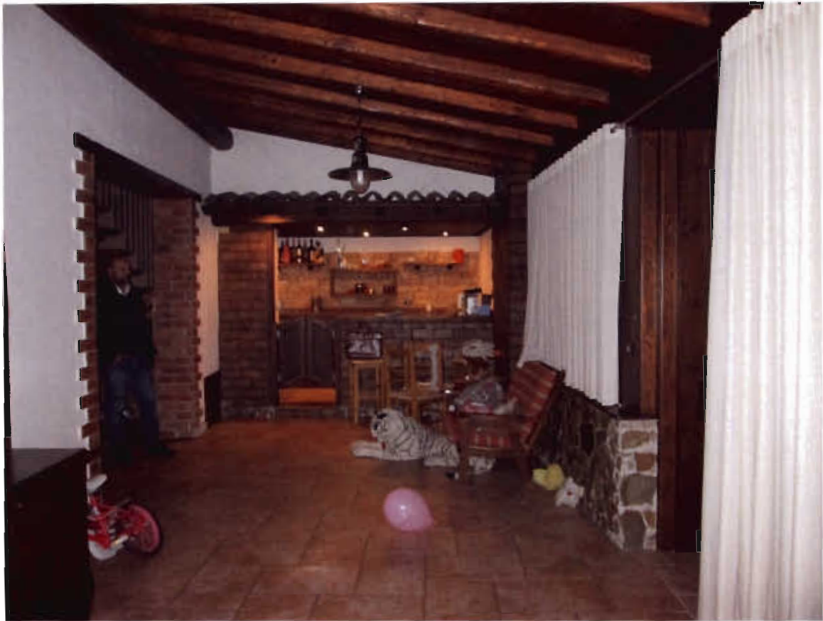
Foto n.10 area esterna inglobata nell'abitazione, con angolo bar in muratura.