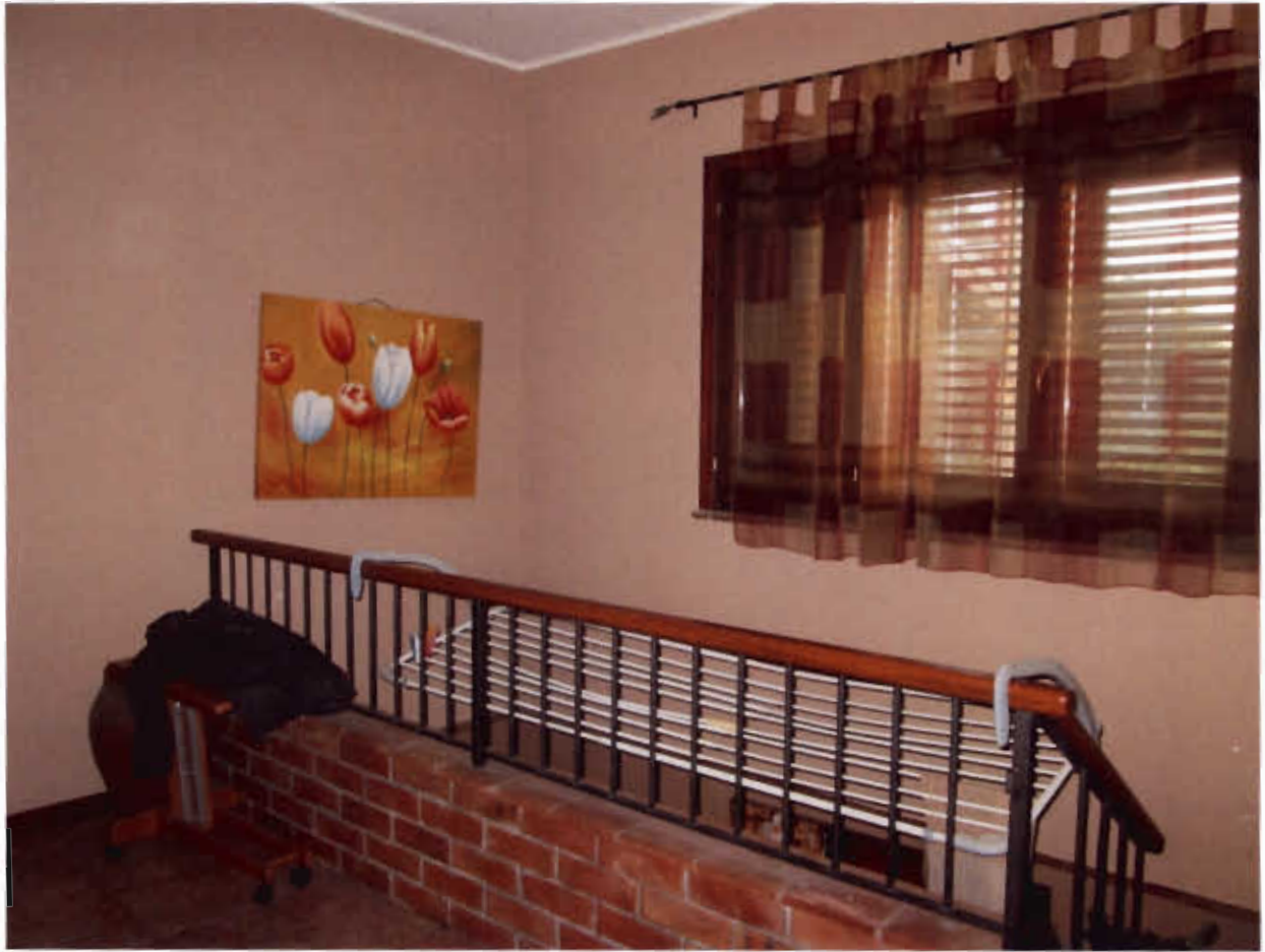
Foto n.15 spazio disimpegno piano primo