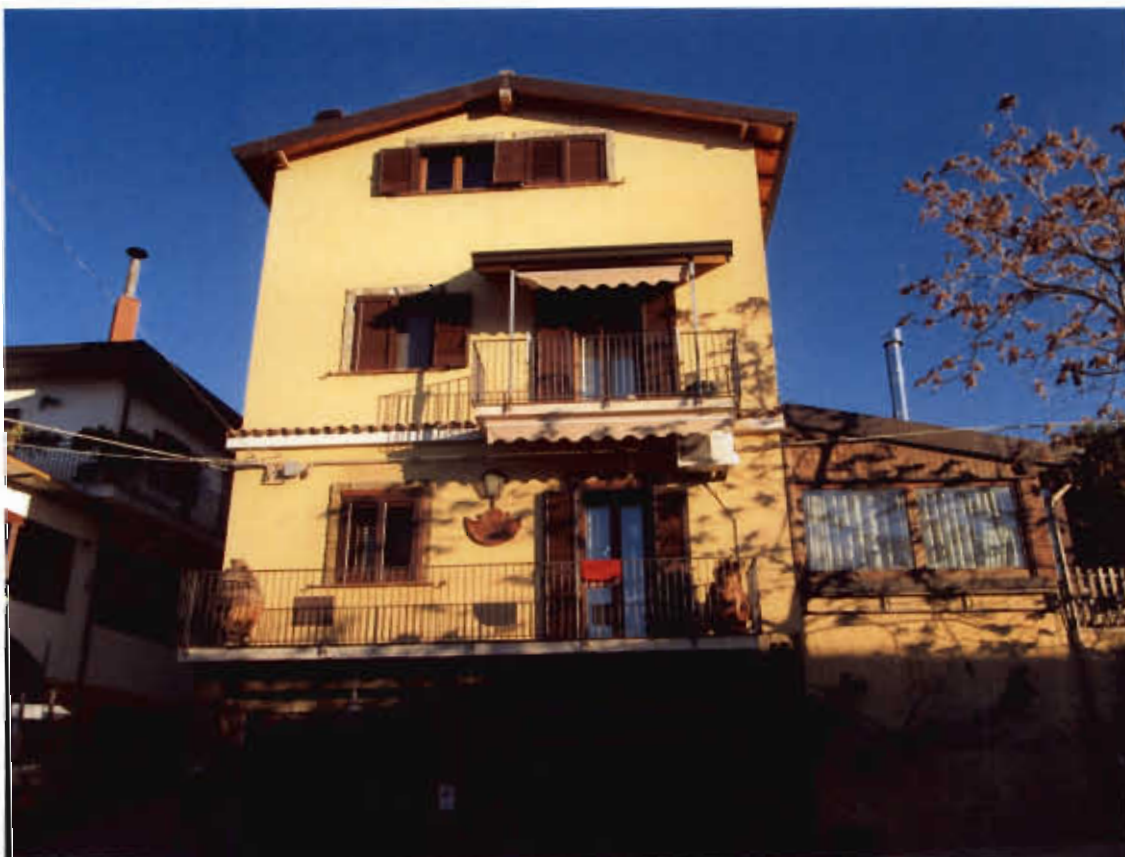
Foto n.1 Prospetto principale dell'immobile in oggetto, sito in Bronte, c.da Serra s.n.