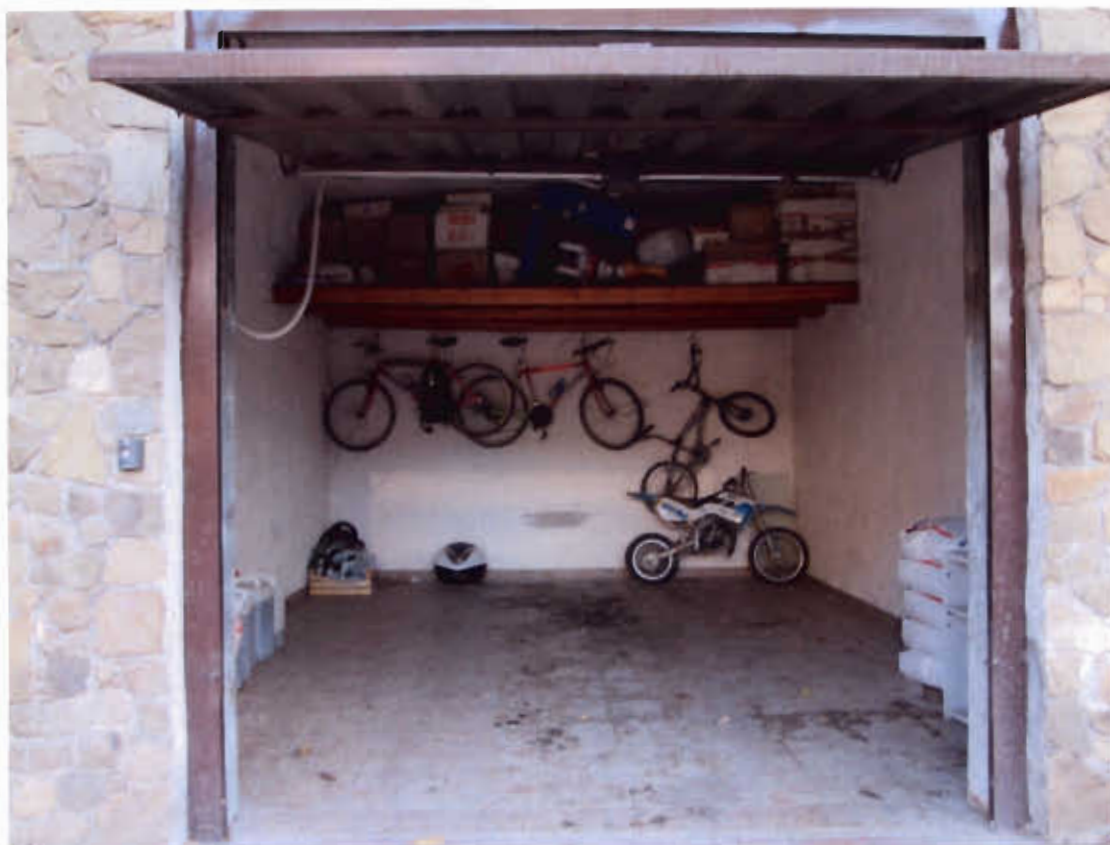
Foto n.3 interno vano garage