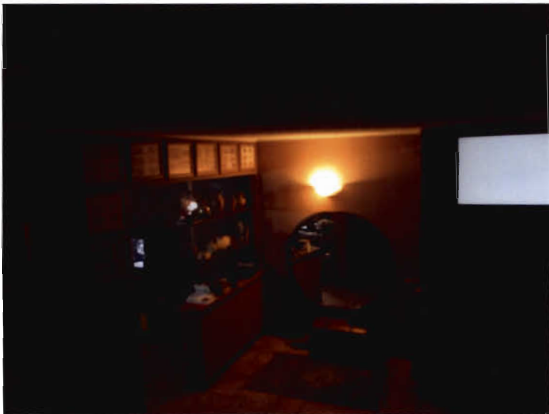
Foto n.13 vano di ingresso collegato al soggiorno ( vista dalla scala interna ).