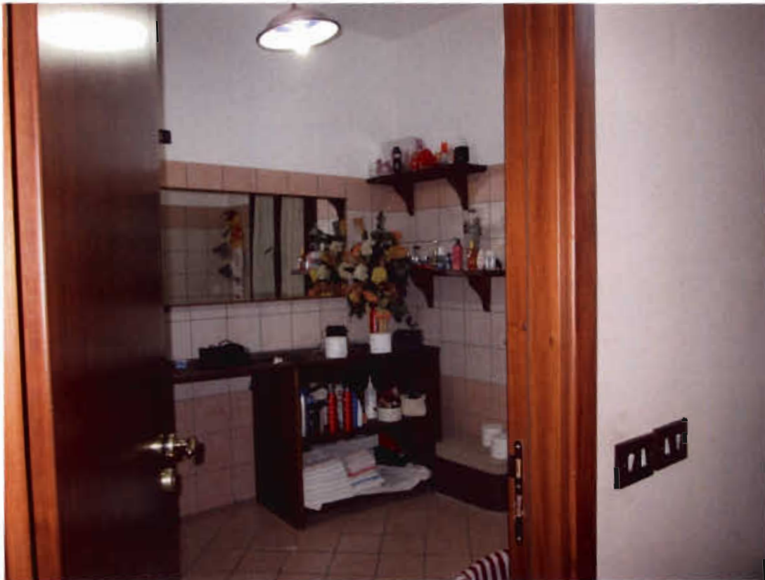
Foto n.16 bagno al piano primo