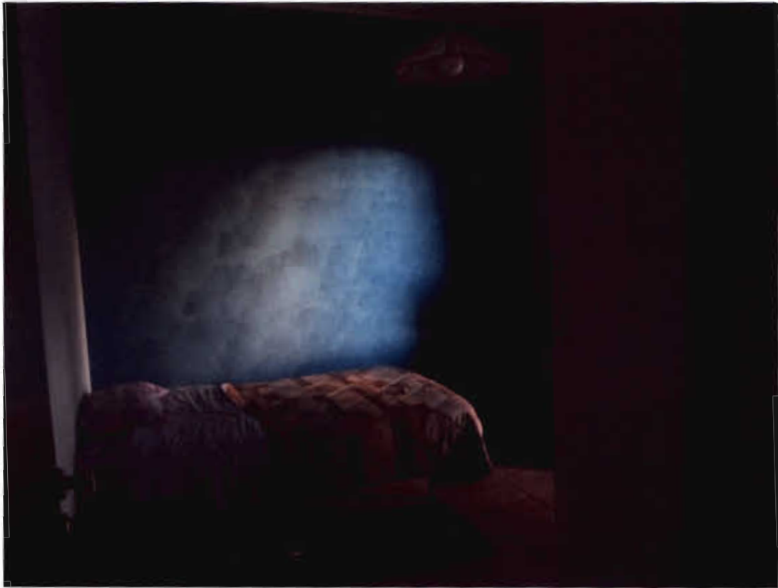
Foto n.14 camera da letto al piano primo