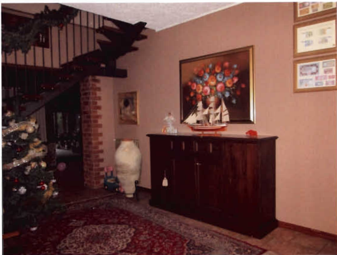
Foton.5 vano di ingresso adiacente al soggiorno, la scala interna di collegamento.