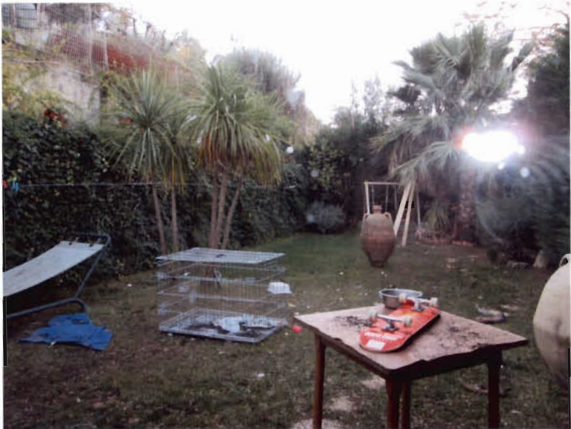
Foto n.12 Giardino sul prospetto interno del fabbricato.