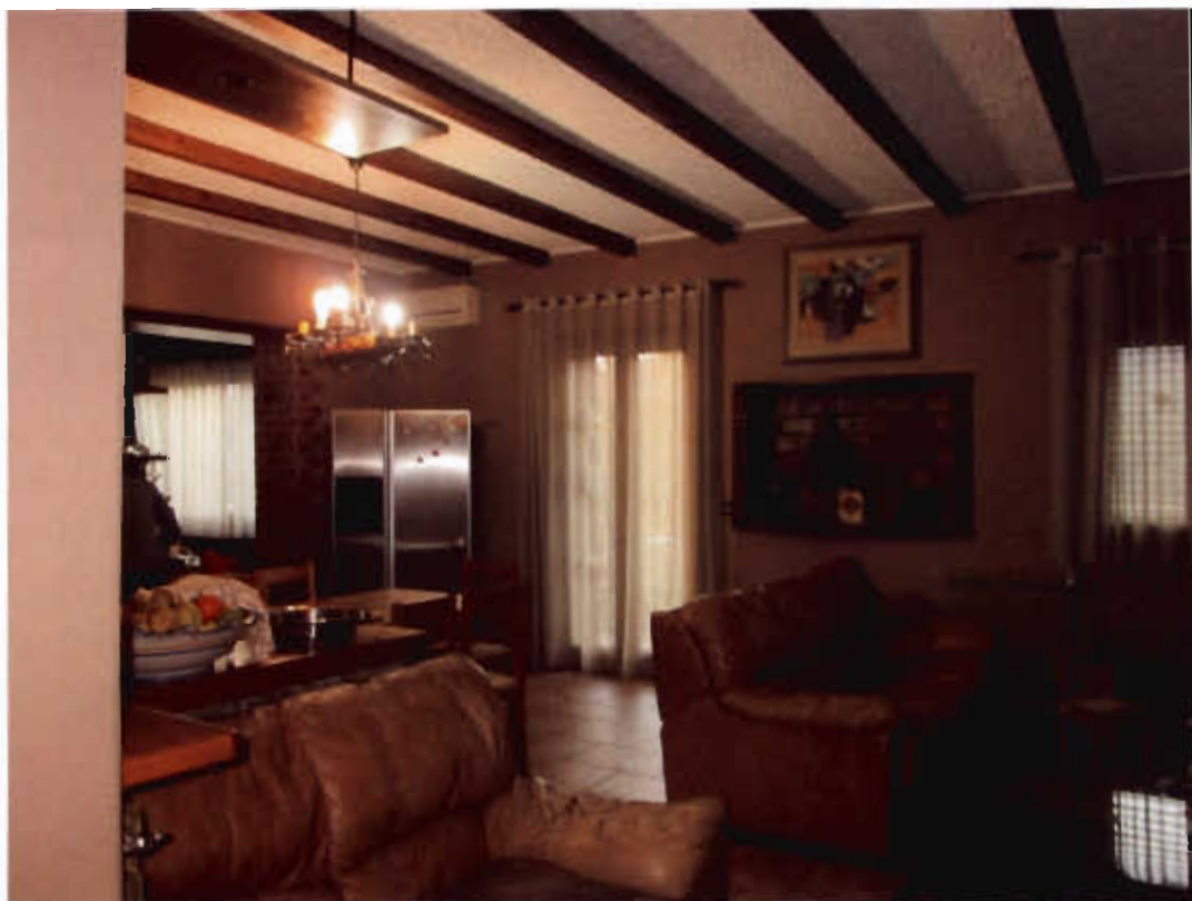
Foto n.6 soggiorno-cucina